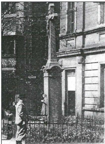
Oryginalny krzyż z początku wieku

za pośrednictwem gazetki już dzisiaj serdecznie dziękuje obsłudze baru "Sandra" za bezinteresowne udostępnienie ubikacji, ekspedientkom sklepu mięsnego obok krzyża za możliwość korzystania za darmo z wody, oraz panu z kiosku obok za darmową energię elektryczną. Te na pozór drobne gesty świadczą jednak o poczuciu odpowiedzialności za wspólne dobro i są dowodem, że nie jesteśmy społeczeństwem, które tylko bierze, ale potrafi i chce dać coś od siebie. W ten sposób tworzymy parafialną wspólnotę.