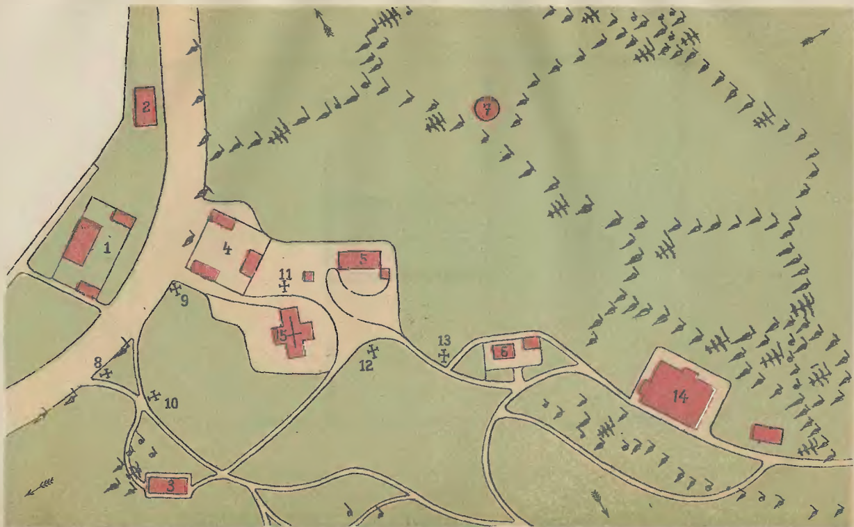
PLAN SYTUACYJNY DZIAŁU ETNOGRAFICZNEGO WYSTAWY KRAJOWEJ w ROKU 1894.