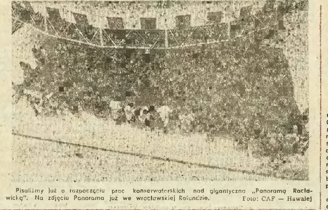
Pisaliśmy już o rozpoczęciu prac konserwatorskich nad gigantycznym „Panoramą Racławicką”. Na zdjęciu Panorama już we wrocławskiej Rotundzie.