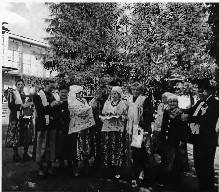
11. Zespół z Ćwiklic (2000 r.)