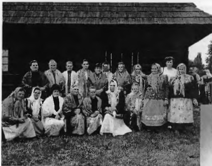
25. „Szarotki” z Mościsk (1994 r.)