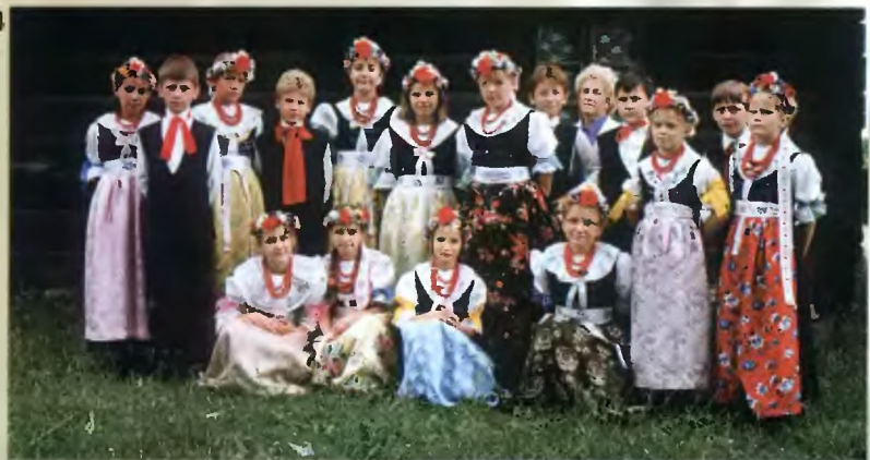
82 - „Kiszenie kapusty” – zespół „Podlesianki”; 83, 84 - „Malwinki” w Chorzowie w 1993 r. - zespół dziecięcy przy „Podlesiankach”