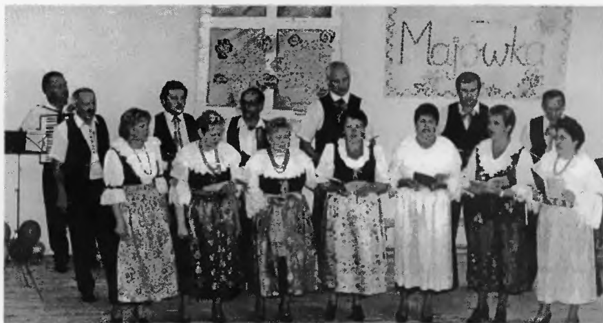
13. Zespół Śpiewaczy z Łąki