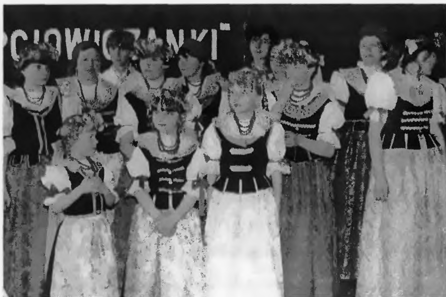
22. „Kopciowiczanki” (r. 1985)