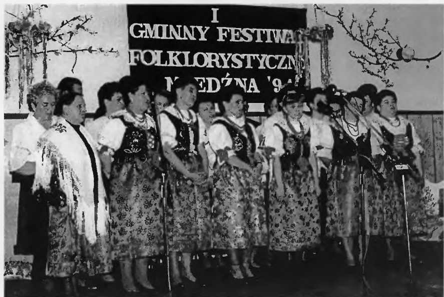
4. Zespół Śpiewaczy z Góry (1994 r.)