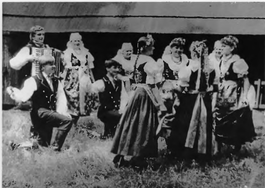
18. „Kryzanie” - początki działalności