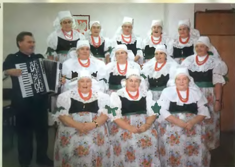
102 - „Szarotki” z Orzesza Mościsk (Kazimierz 1999 r.); 103 - „Szarotki” w Chorzwice (2000 r.); 104 - „Czułowianki” (1995 r.)