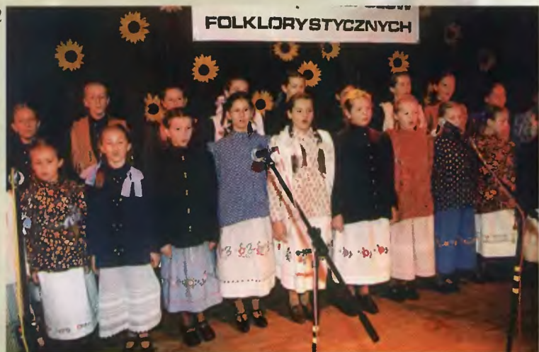
40 - „Jankowiczanki”; 41 - „Jankowiczanki” w Brennej; 42 - „Małe Jankowianki” (2001 r.)