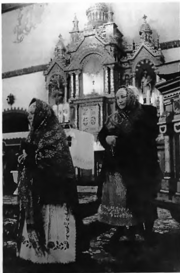
20. Kobiety z Bojszów