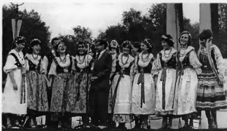
14, 15. Początki działalności zespołu „Pszczyna” - występy w Chorzowie