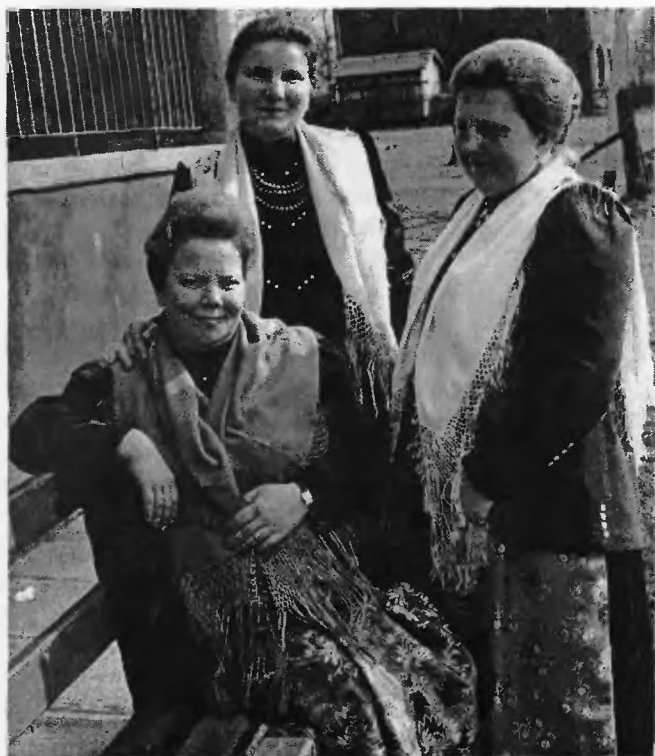
1. Kobiety z Goczałkowic (pocz. lat 70.)