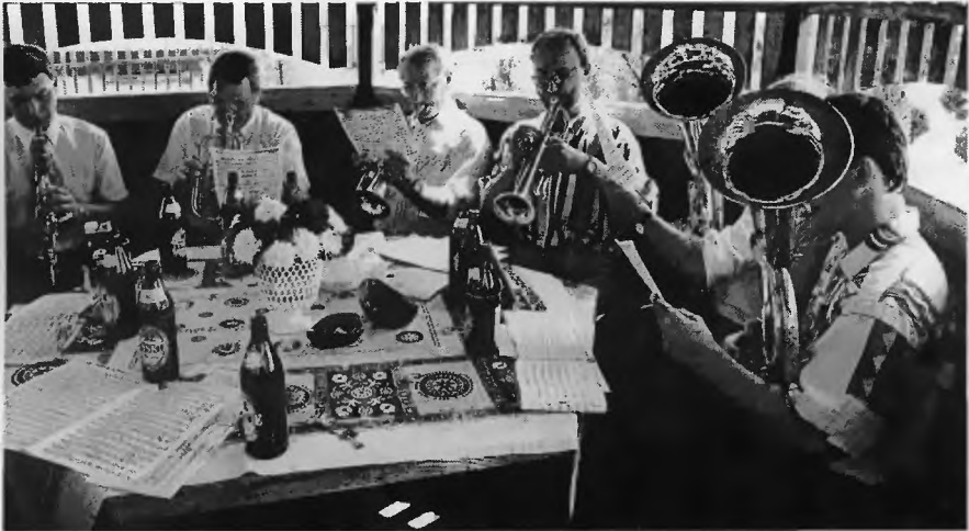
2. Kapela podczas próby

Oprac. wg relacji Jana Piłatyka, artykułu: A. Lysko, „Kalendarz Górnicy kopalni Ziemowit 1995 r.”, Łódź, s.229-230 grudzień 2000