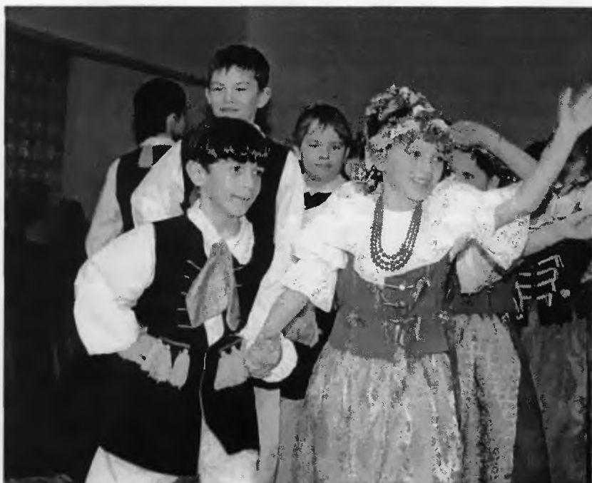
6. „Wigejce” - SP nr 2 Wola

Oprac. wg relacji Ireny Świerkot luty 2001