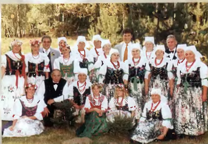
85 - „Kopciowiczanki” (1995 r.); 86 - „Kopciowiczanki” - spotkanie noworoczne w 1997 r.; 87 - „Łędzinianie”