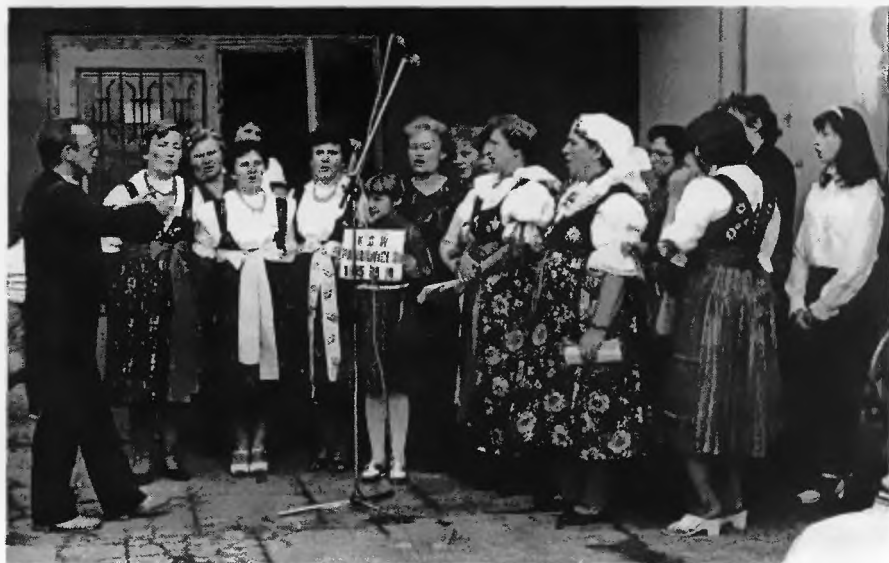
8. Początki działalności zespołu z Pawłowic

Oprac. wg relacji Róży Zielonki listopad 2000