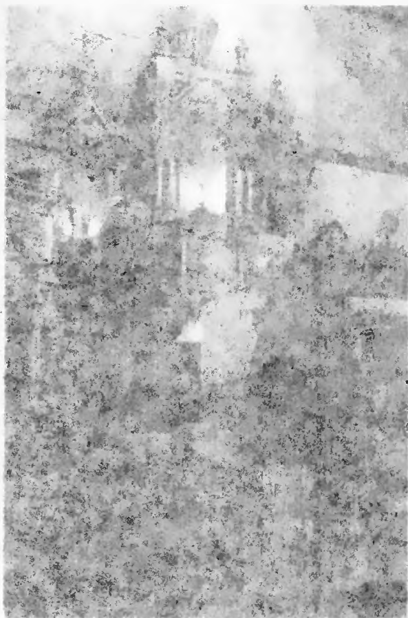
Школа в Бресте