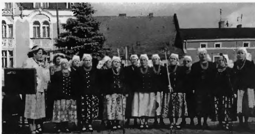
10. „Brzeźczanki” - występy w Pszczynie