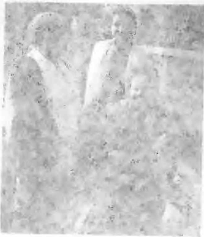
... .. 1 11