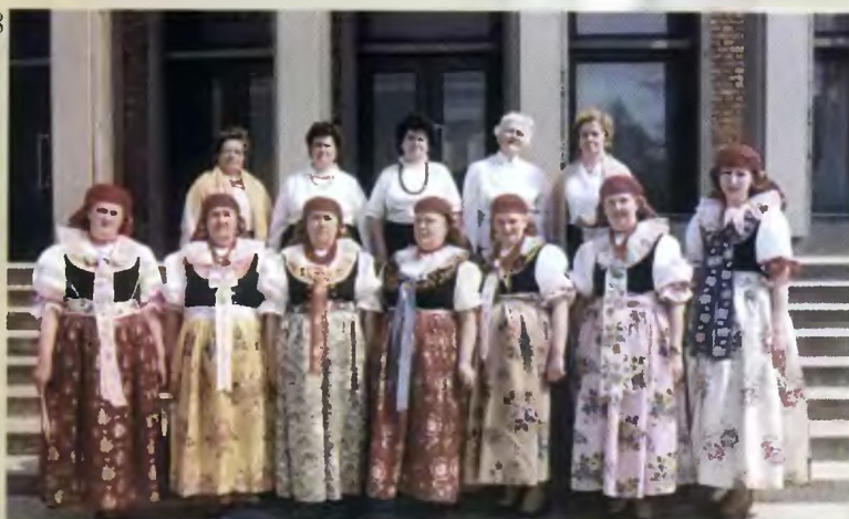
96 - „Kosztowioki” w Brennej (2000 r.); 97 - „Kosztowioki”; 98 - „Morgowianki” – Myśłowice Morgi