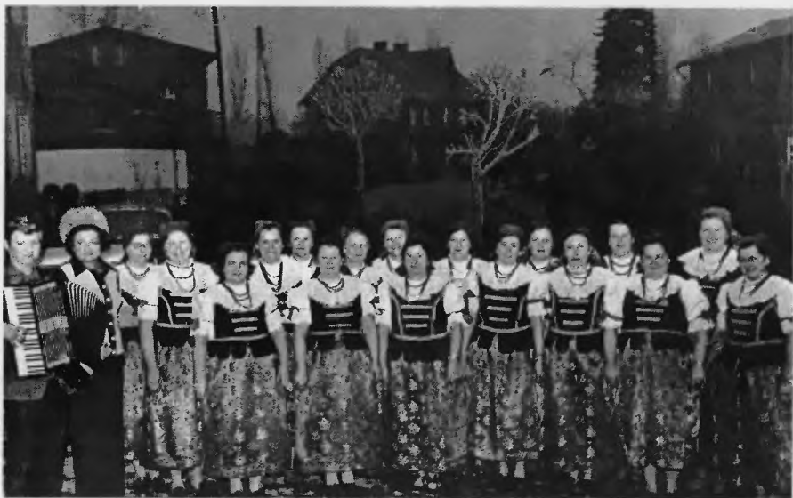
28. „Urbanowiczanki” w r. 1972

Oprac. wg relacji Krystyny Ogazy listopad 2000