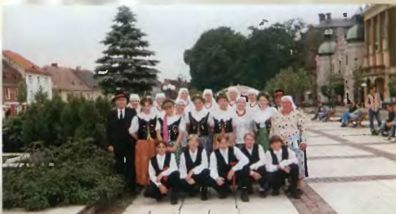
37 - „Małe Czarkowianki”; 38 - „Małe „Czarkowianki” w inscenizacji „Zagłada dzień do chatki” (2000 r.); 39 - Zespół z Ćwiklic (1997 r.)