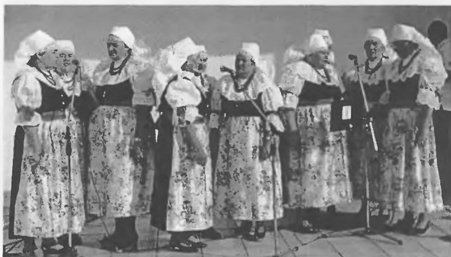
27. „Czułowianki” (1999 r.)