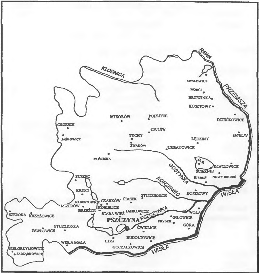
Zarys ziemi pszczyńskiej według mapy A. Hindenberga z XVII wieku.