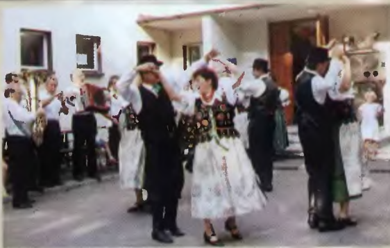
7, 8 - Kapela Piłatyków z Frydku; 9, 10 - „Swojanie” z Frydka (r. 2000)