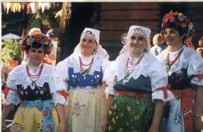
71 - „Ściemianeczki” w inscenizacji „Chrzcziny”; 72 - Zespół „Bojszowanie”; 73 - Bojszowianki (1996 r.)