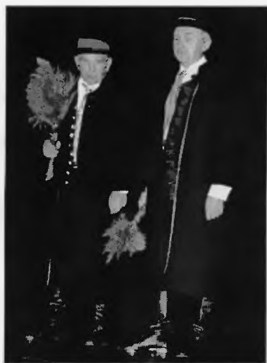
21. „Bojszowianie” w strojach regionalnych