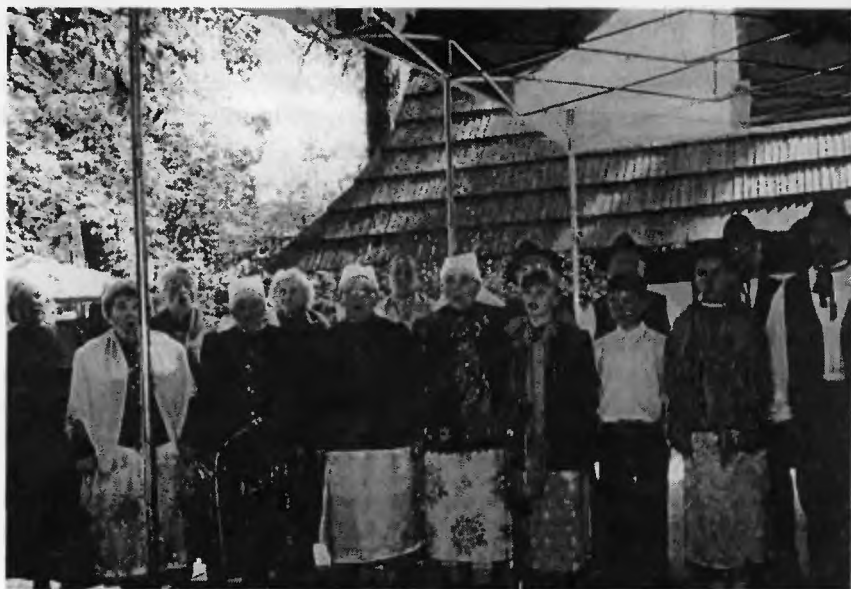
24. „Jaśkowiczanie” - zespół z Orzesza Jaśkowic