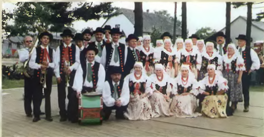
18 - „Wigiejce”; 19 - „Wolanie” (2000 r.); 20 - „Wolanie” oraz kapela Saternusów