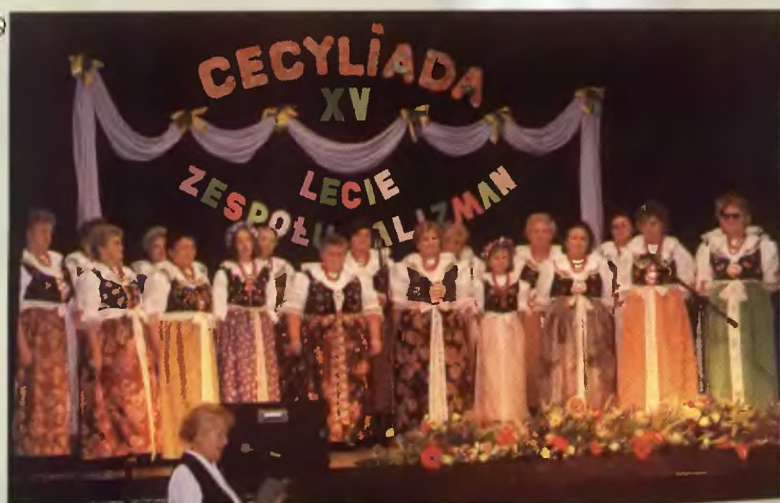
27 - „Harmonijka” – zespół młodzieżowy przy „Harmonii”; 28 - „Talizman” z Pawłowic w Chorzowie w 1994 r.; 29 - „Talizman” (2000 r.)