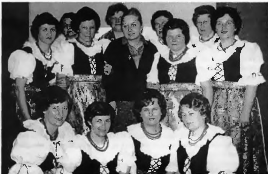
19. „Radostowiczanki” - początki działalności