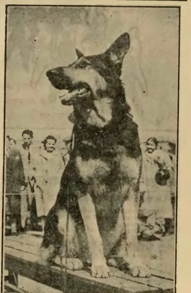
Staraniem Związku Kynologicznego została otwarta w Warszawie V Ogólnokrajowa Wystawa Psów Rasowych. — Na zdjęciu: Jednym z nagrodzonych psów został owczarek alpejski „Kip”.

Radzieckie przedsiębiorstwo filmowe „Glawkinoprokt” wypuściło już serię pierwszych w dziejach kinematografii filmów, zaopatrzonych w tego rodzaju ruchome napisy.