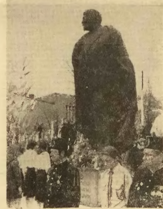
Spoleczeństwo woj. katowickiego złożyło wieńce i kwiaty pod pomnikiem W. I. Lenina w Mysłowicach — Wesołej.

Idea Lenina wечно żywa. Przyjaźń, współpraca i braterstwo narodów Polski i ZSRR gwarantują postęp i pokój. Pod takimi hasłami odbyła się wczoraj, 21 bm., manifestacja przyjaźni polsko-radzieckiej pod pomnikiem wodza Wielkiej Socjalistycznej Rewolucji Październikowej w Mysłowicach — Wesołej oraz uroczysta sesja Konferencji Samorządu Robotniczego w kopalni „Lenin”. Załoga pierwszej, zbudowanej w Polsce Ludowej kopalni, której w 50 rocznicę Wielkiej Socjalistycznej Rewolucji Październikowej, nadano imię Włodzimierza Ilicza Lenina, stanowi wzór i symbol serdecznej przyjaźni i owocnej współpracy polskich i radzieckich górników. To właśnie do tej kopalni, utrzymującej się stale w czołowie produkcyjnych zakładów kraju, trafiły jako pierwsze radzieckie kombajny, a także pierwsze zmechanizowane obudowy produkcji Kraju Rad. Produkcję górnictwa kolektyw i jego organizacja partyjna były gospodarzem wczorajszych podniosłych uroczystości leninowskich. Tak w manifestacji, jak i uroczystej sesji KSR, wraz z załogą kopalni „Lenin”, uczestniczyli przedstawiciele miast (CIĄG DALSZY NA STR. 4)