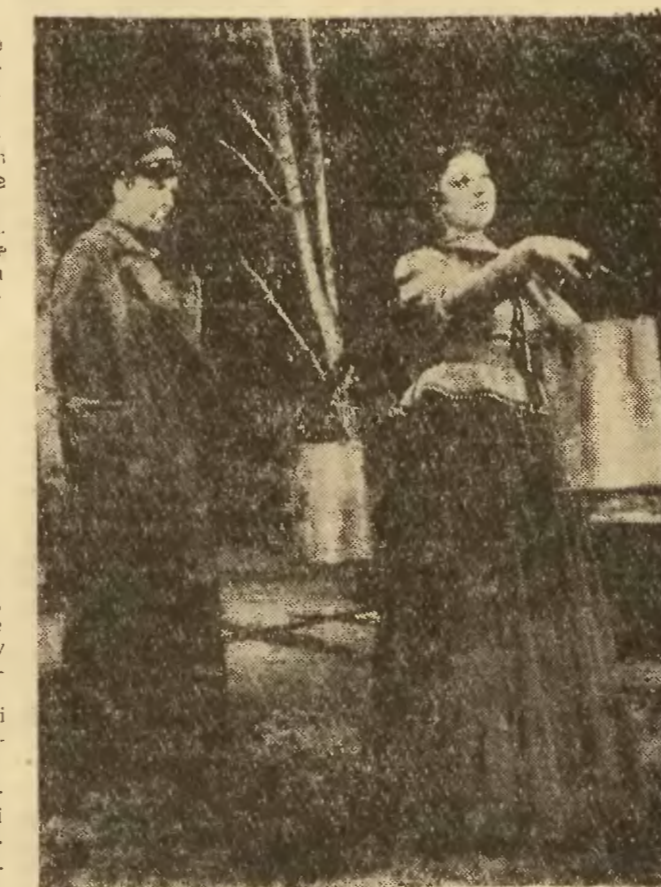
Na zdjęciu: jedna ze scen przedstawienia zaprezentowanego katowickiej publiczności przez teatr z Leningradu.