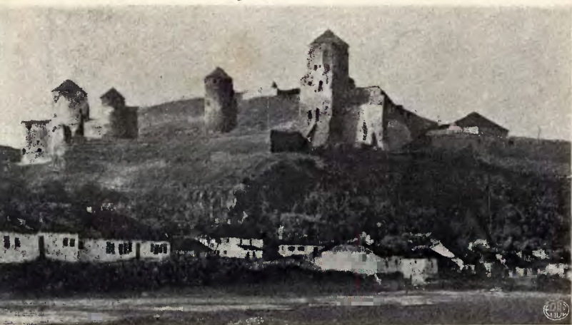
Kamieniec. Południowa strona zamku