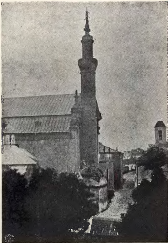
Kamieniec. Widok katedry z minaretem.