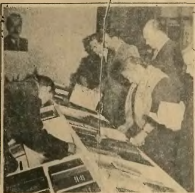
Z okazji Miesiąca Pogłębiania Przyjaźni Polsko-Radzieckiej, w dniu 18 października br. nastąpiło otwarcie Wystawy Książki i Prasy Radzieckiej w lokalnym Klubie Międzynarodowej Książki i Prasy w Warszawie. Na zdjęciu: liczni zwiedzający z zainteresowaniem oglądają stoiska z wydawnictwami radzieckimi.