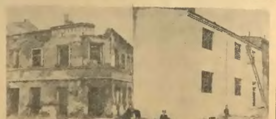
Dwa bliźniacze domy w Będzinie przy ul. Rybnej. — Jeden to rudera — drugi odremontowany z takiej właśnie rudery. Dzięki pomocy Państwa w domu tym zamieszkały 4 rodziny robotnicze.

Ile wzruszającej radości kryje się w prostych słowach górnika, który całe życie swoje marzył o kładzie