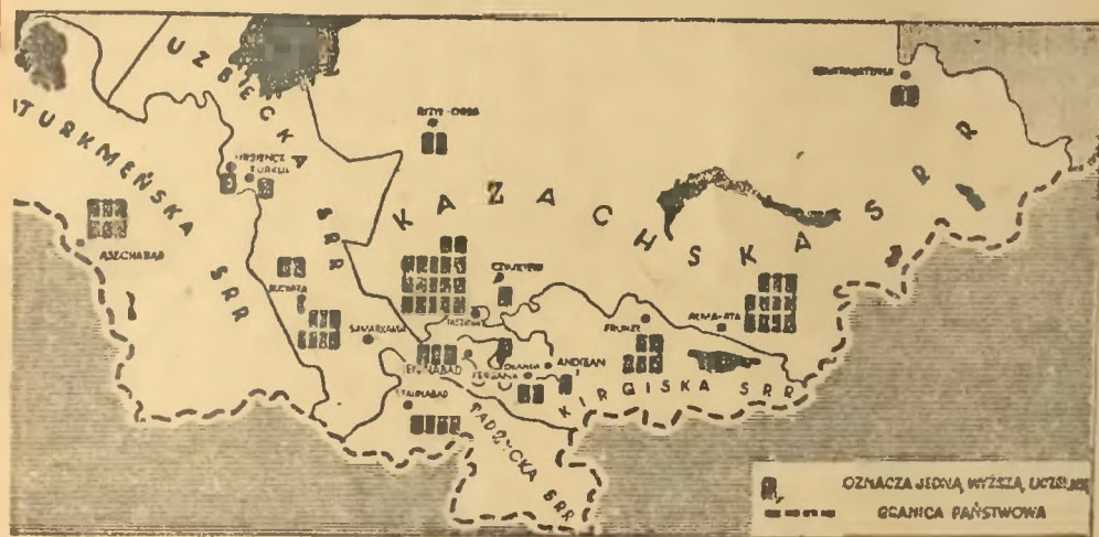
Nowe wyższe zakłady naukowe w azjatyckich republikach ZSRR

W 1914 roku na 91 wyższych uczelniach studiowało ogółem 112 tysięcy studentów; po trzydziestu latach władzy radzieckiej ilość uczelni wzrosła do 800, a liczba studentów do 1.247.000, t. zn. przeszło dziesięciokrotnie nie licząc 270.000 ludzi studiujących na wyższych uczelniach zaocznych (drogą korespondencyjną). Już przed drugą wojną światową ilość studentów w