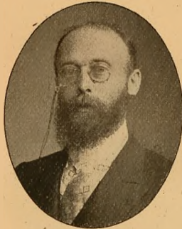
Franz von Liszt.