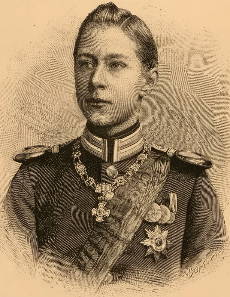
Friedrich Wilhelm, Kronprinz des Deutschen Reiches.