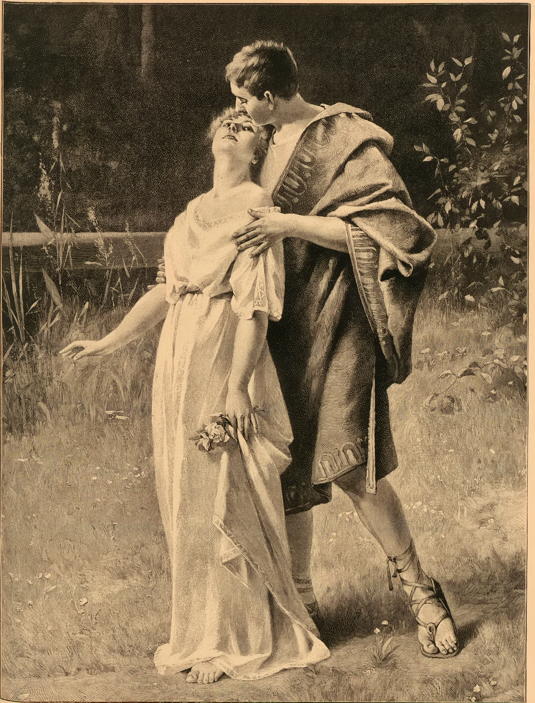
Der erste Kuß. Nach dem Gemälde von Gustav Schrödter. (Mit Gedicht auf Seite 70.)