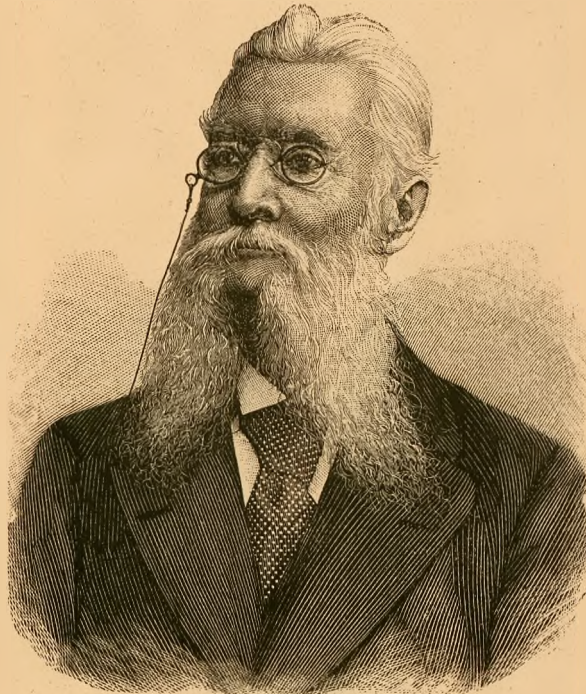
Robert v. Puttkamer. † (Text nebenstehend.)

1867 bis Mai 1871 fungirte er als vortragender Rath im Bundeskanzleramt. Im Mai 1871 Regierungspräsident von Gumbinnen, seit Dezember 1877 Bezirkspräsident von Deutsch-Lothringen, im März 1877 zum Oberpräsidenten von Schlesien ernannt, wurde v. Puttkamer nach dem Rücktritt Falks am 14. Juli