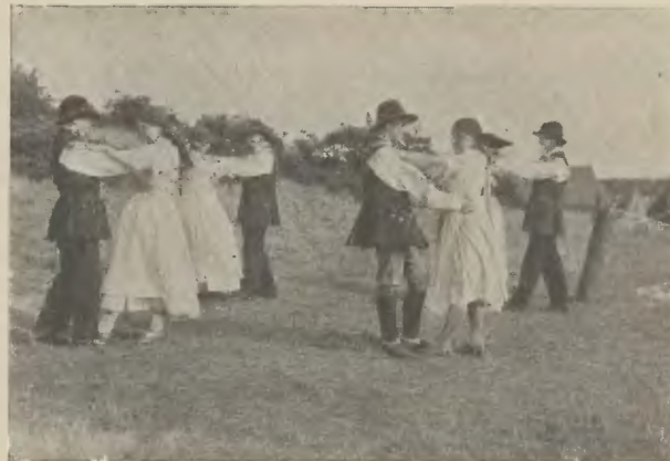
Harcerki tańczące „drybka“ na Zlocie w Jęzorze.