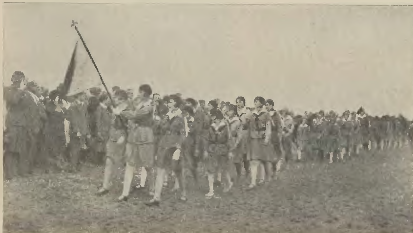
Defilada w dniu otwarcia Zlotu. Brało w niej udział około 600 druhen.