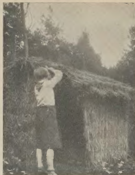
Nie tak to łatwo zbudować własny dom!

postawiła piękny totem, wyobrażający twarze trzech wiatrów — symbole trzech zastępów. Druga drużyna obozowicza zajęła się przede wszystkim zdobnictwem i urządzeniem wnętrza namiotów. Wiele pracowitych i pomysłowych przedmiotów obozowych wyszło z rąk członkiń tej drużyny, a największe zainteresowanie wzbudzało gniazdo na drzewie.