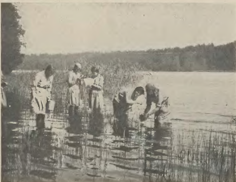
Fot. J. Zwolakowska. Złot Z. Starszyzny Harcerskiej w Kielpinach.

Nakoniec nie można pominąć milczeniem najświeższego już odkrycia, dokonanego przy pomocy promieni nadfioletowych. Oto w Hanau w Niemczech zbudowano przyrząd wysyłający te promienie, ale o takiej energii i takiej specjalnej długości fali, że pobudzają one do świecenia materiały takie jak papier, atrament. Wszystko fosforyzuje. Pisma niemieckie piszą o tej lampie jako o detektywie fizykalnym. Rzeczywiście bowiem dość skierować jej ciemne promienie na papier, a atrament natychmiast pocznie lśnić, świecić, — litery i cyfry najgenialniej nawet dopisane na dokumencie zablęsną innym jakimś światłem i fałszerstwo wyjdzie od razu na jaw.