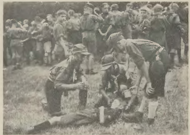
Zlot Śląskiej Chorągwi Męskiej na Buczu. Pierwsza pomoc.

— Nie wiem, co to skaut, ale to dobrze, że się nie boisz — rzekł stary. — Tu zostać nie możesz. I tobie i mnie groziłoby straszne nieszczęście. Jeśli w biały dzień przyszedł tu niepostrzeżenie, to tem bardziej prześlizniesz się nocą. Łepski z ciebie chłopak, choć dzieciuch jeszcze. Aż mi dziwno że takich z domu puścili! Daj mu tam matka do węzełka co na drogę, jak się ściemni wyprowadzę go przez sad w zarosła, stamtąd już blisko do wąwozu. A opatrz-że se dobrze karabin, bo kto wie, czy ci nie będzie potrzebny.