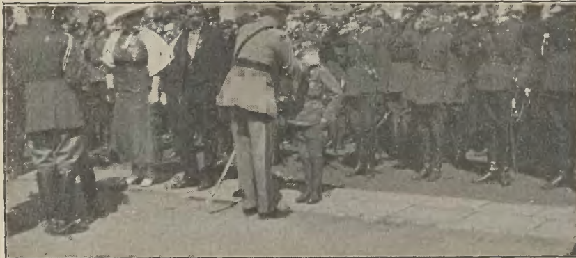
Marszałek Polski Józef Piłsudski, Protektor Związku Harcerstwa Polskiego d-koruje Krzyżem Walecznych małego harcerzyka w Płocku w 1920 r.

Również podobną litanie zdobyczy duchowych moglibyśmy wymienić a po ich zsumowaniu otrzymalibyśmy jeden wielki hymn radości, wesela, oraz uciechy milionów wolnych ludzi, mówiących w ojczywym języku, posiadających wolność sumienia i religii wyznawanej — ludzi, dla których zgrzyt zamków więziennych i ciężkich kajdan oraz jęk więzionych za walkę o wolność przodków słabym może już echem tak niedawnej naszej przeszłości dochodzi.