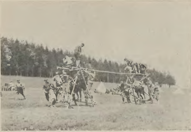
Most się buduje.