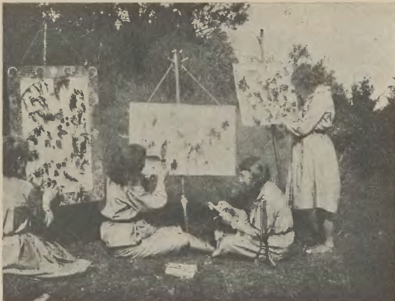
Przyrodniczki przy pracy.