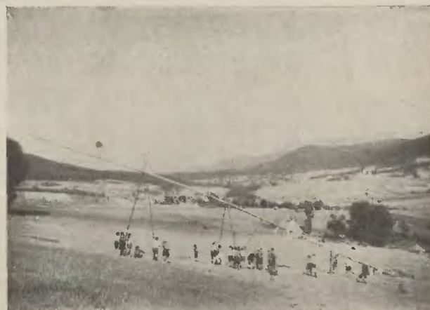
Bucze Harcerskie — podnoszenie 24-metrowego masztu.