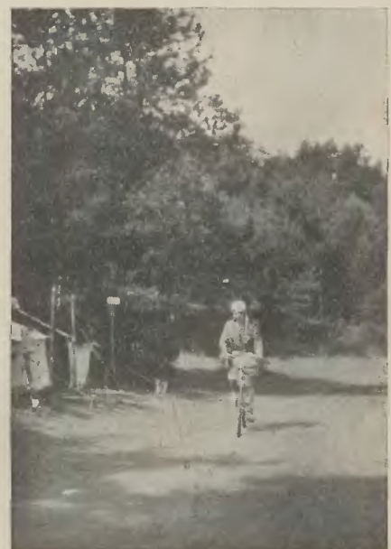
Złot Starszyzny — Komendantka obozu jedzie na inspekcję.