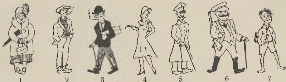
1. Starsza pani, 2. pastuch, 3. mieszkaniec miasta, 4. panienka, 5. spensjonowany pułkownik, 6. właściciel ziemski, 7. ulicznik.

Na przykład do pastucha — pekińczyk. Co? Nie podoba Ci się to zestawienie? A więc spróbuj sam. Zobaczysz, że to nie tak łatwo trafić do tych państwa odpowiednie psy!