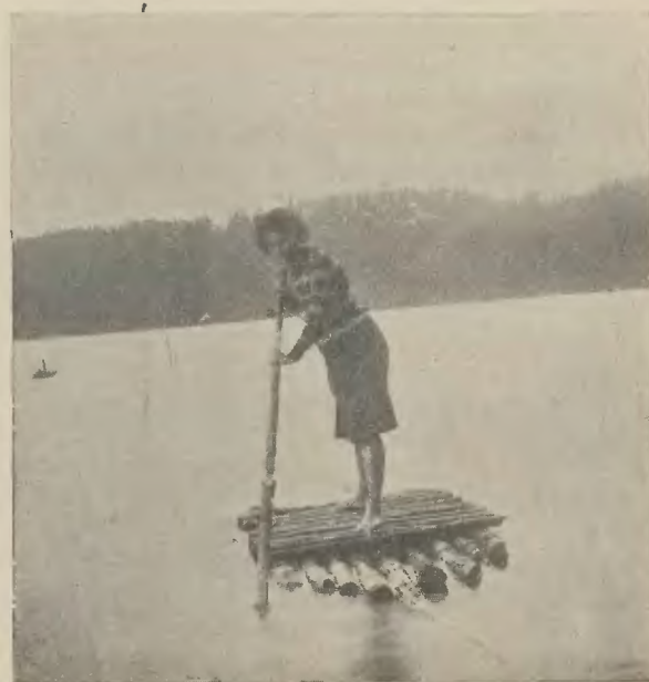
Niebezpieczna przeprawa!