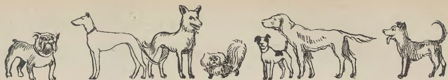
1. buldog, 2. chart, 3. wilk, 4. pekińczyk, 5. foksterjer, 6. seter, 7. mieszaniec.