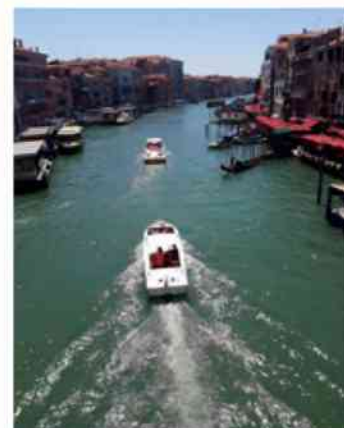
Wenecja – Canale Grande