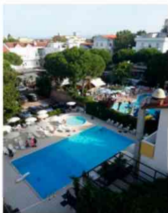
Gatteo a Mare – Park Hotel Miriam