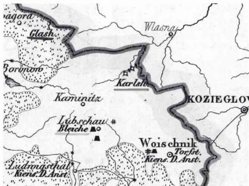
Huta Karola – fryszernia i cajniarnia oznaczone na mapie rejencji opolskiej 34