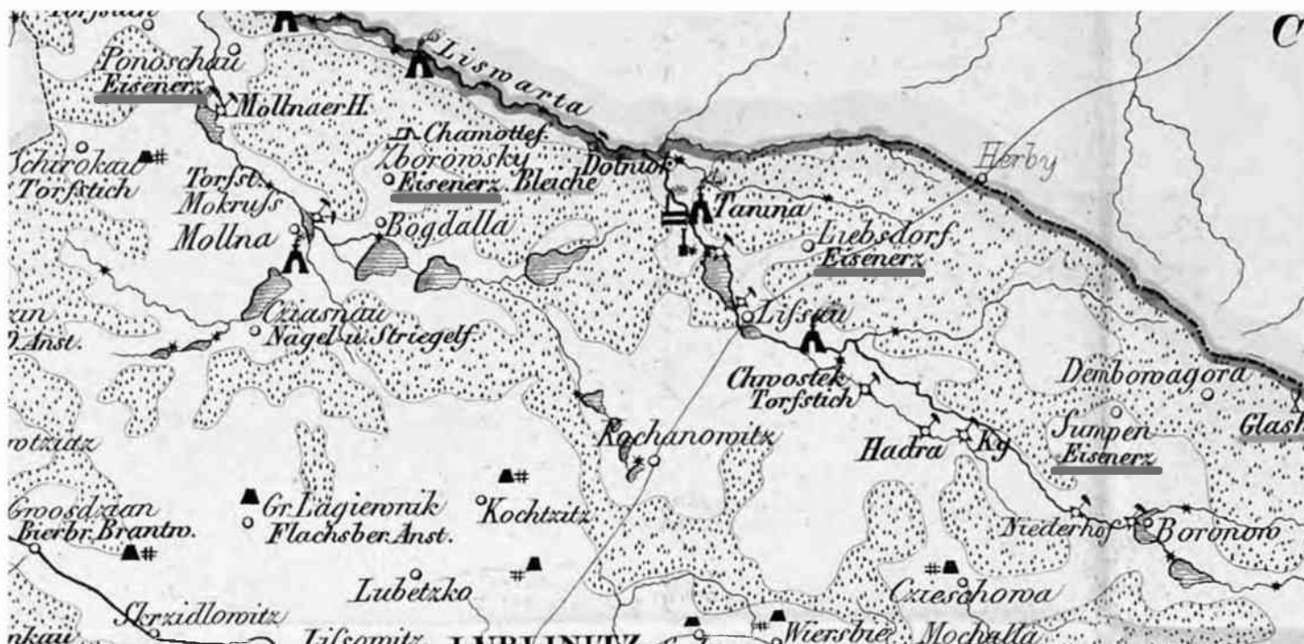
Kopalnie rud żelaza w powiecie lublinieckim – w Boronowie (Zumpach), Kolonii Lisów, Panoszowie i Zborowskiem oznaczone na mapie rejencji opolskiej z 1860 r. 83