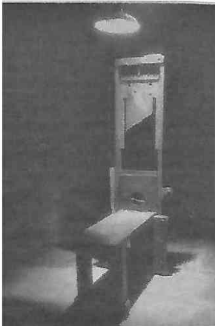
Katowicka gilotyna.