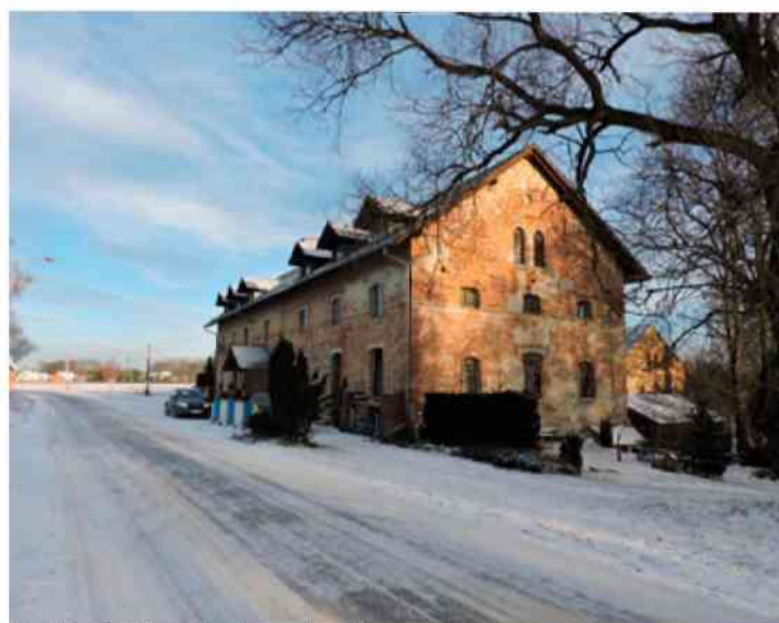
Borki Wielkie, zabudowania młyna wodnego, dziś punkt gastronomiczny.