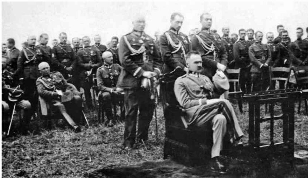
Józef Piłsudski podczas mszy polowej w Lublińcu

Polski magistrat przejął w 1922 roku niemałe długi niemieckiej administracji, które musiał spłacić. Było to 9 kredytów zaciągniętych w latach 1901–1919. Największą sumę, ponad 135 tys. zł., stanowiła spłata kredytu na budowę rzeźni, ponad 81 tys. zł. spłata kredytu na budowę Urzędu Celnego, a także pożyczki na budowę dwóch leśniczówek miejskich, Wyższej Szkoły dla Dziewcząt i Chłopców