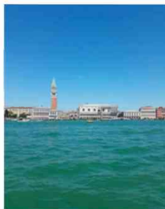
Wenecja – Laguna Wenecka