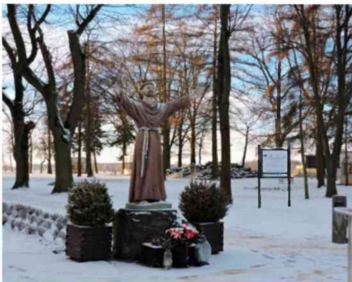
Plac kościelny i postać zakonnika franciszkańskiego witającego wiernych.