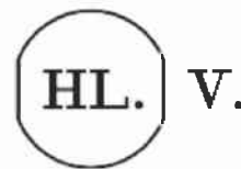
Znak fabryczny Huty Karola z 1822 r.