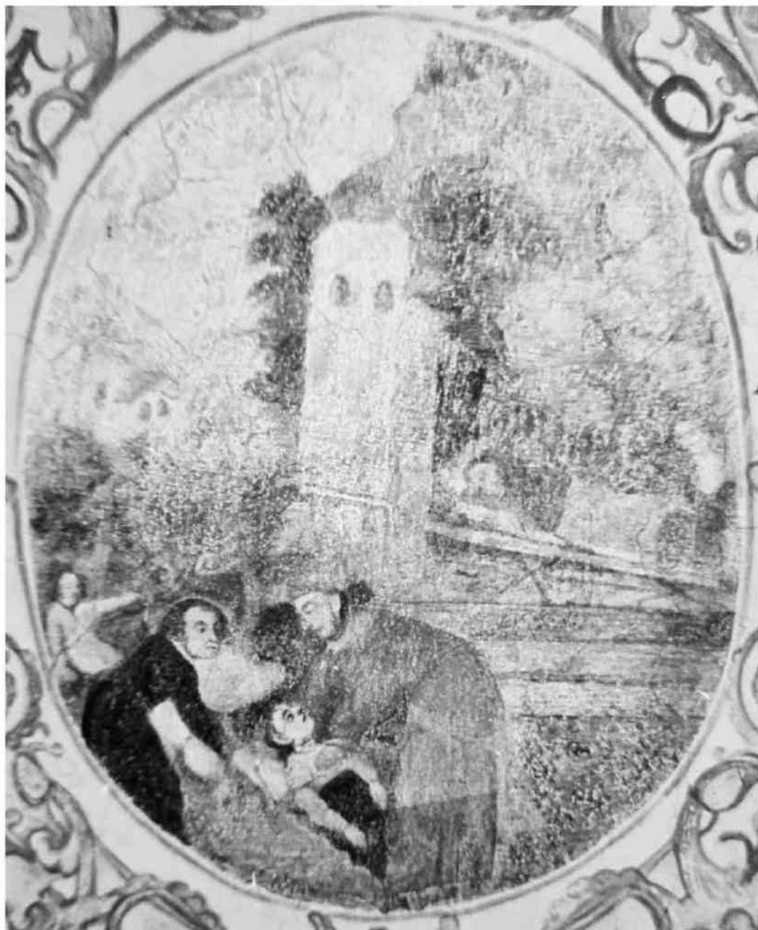
Na zdjęciu święty Karol Boromeusz udzielający posługi chorym przed kościołem św. Mikołaja w Lublińcu. Malowidło przedstawia XVII-wieczną świątynię pokrytą czerwoną dachówką z wieżą kościelną znacznie niższą od stanu obecnego.

W skład uposażenia nauczyciela szkoły parafialnej