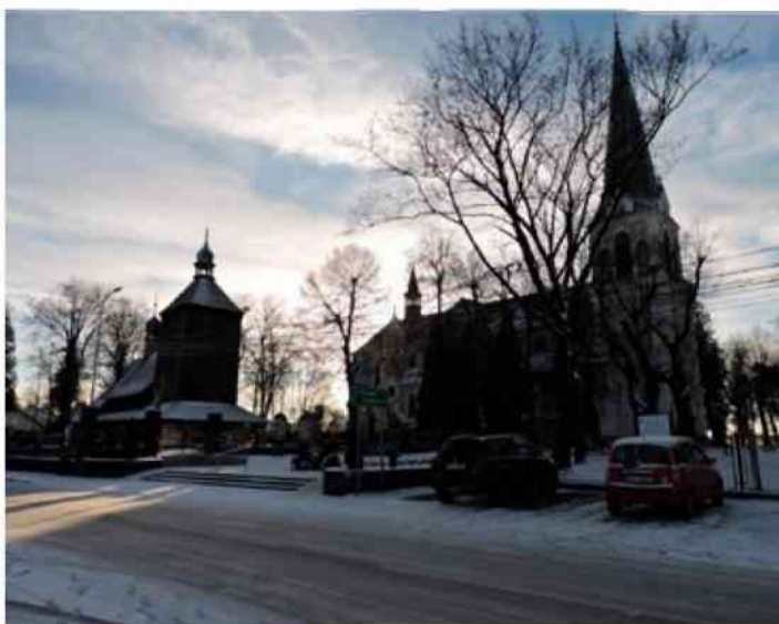
Borki Wielkie, dwie świątynie – stary kościół drewniany, nowy murowany.