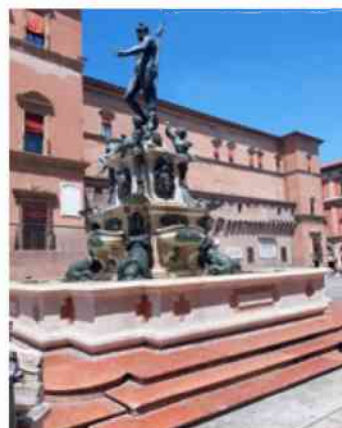
Bologna – Piazza Maggiore