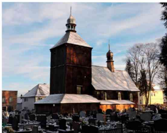
Drewniany kościół pośrodku cmentarza.