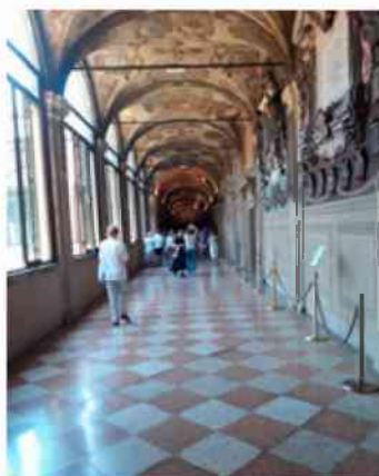
Bologna – Uniwersytet Boloński od 1088 r.