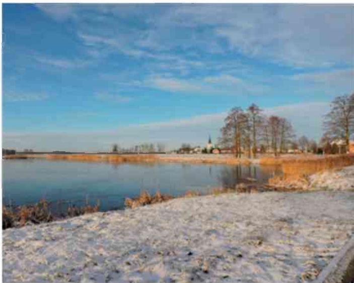
Borki Wielkie, panorama miejscowości. Widok od strony wschodniej.