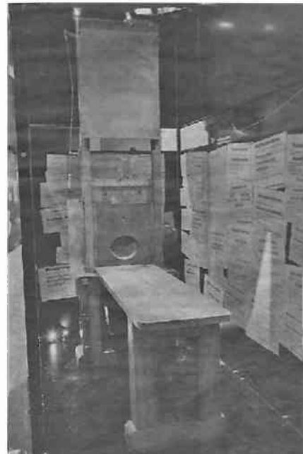
Muzeum Śląskie w Katowicach