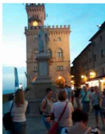
San Marino – Palazzo Pubblico