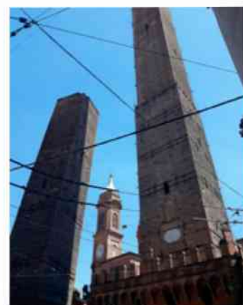
Bologna – Two Towers