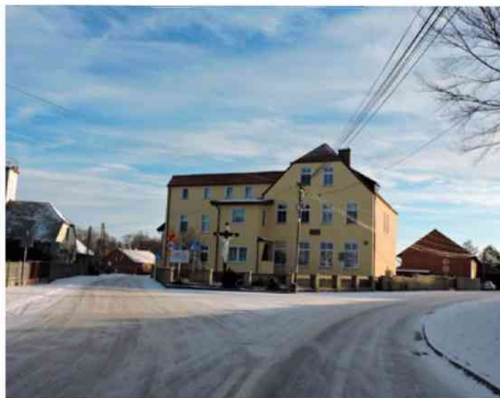
Borki Wielkie, centrum. W lewo droga na Kucoby, w prawo – do Wędziny.