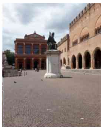
Rimini – Piazza Cavour