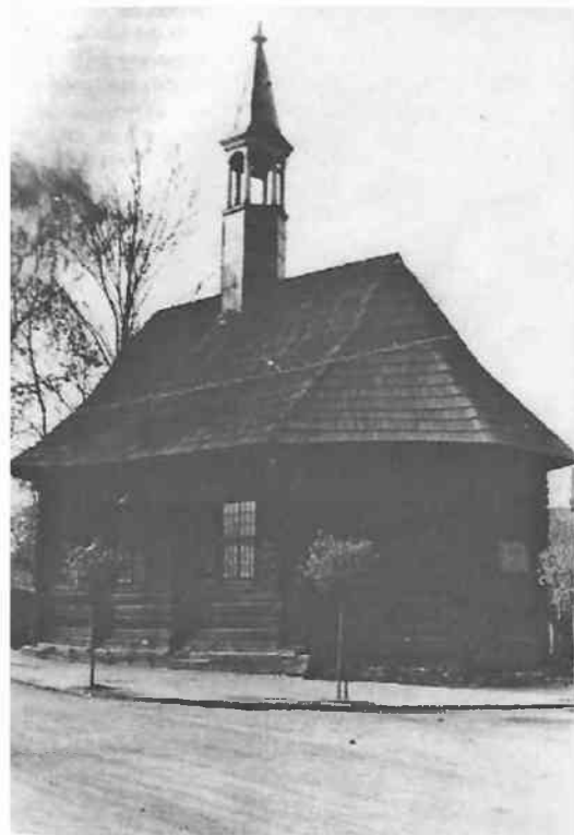
Kościół pw. św. Anny w Lublińcu