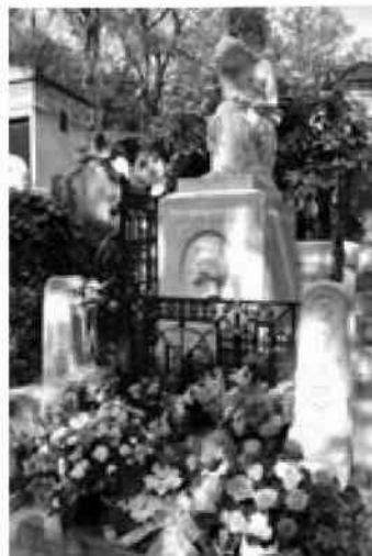
Grób Fryderyka Chopina

Początkowo cmentarz nie był chętnie wybierany jako ostatnie miejsce spoczynku. Zmieniło się to dopiero w 1817 r., kiedy to władze Paryża zdecydowały o uroczystym pochówku prochów sławnych kochanków: Aberkarda i Heloizy, których tragiczna historia zachwycała Francuzów w epoce roman-