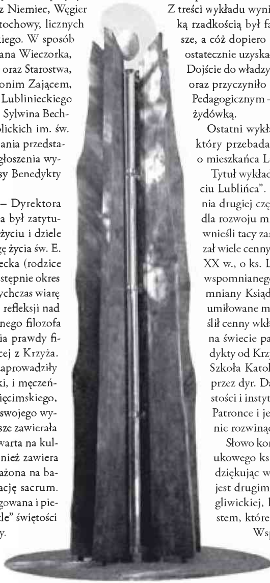
Pomnik Edyty Stein

Wspominał o trudach towarzyszących w uzyskaniu pozytywnego wniosku w Kongregacji ds. Kultu Bożego i Dyscypliny Sakramentów Stolicy Apostolskiej.