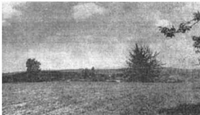
Pole bitwy pod Woźnikami

W pierwszym dniu wojny skierowano silny atak na front krakowskiej brygady kawalerii o której wcześniej była mowa. Główne siły tej brygady broniły kluczowej pozycji opóźniającej na linii Kamieńskie Młyny – Ligota Woźnicka – Woźniki. Najcięższy bój stoczono w rejonie Woźnik gdzie nieprzyjaciel kilkakrotnie musiał zmieniać kierunek natarcia. Batalion ON w Koszęcinie nie wytrzymał naporu i uległ rozszypce, natomiast jednostki 74 GPP i 3 pułku ułanów powstrzymały atak ogromnej zmotoryzowanej piechoty i czołgów. Obie strony poniosły ogromne straty. W następnym dniu rano walczące na linii Woźniki – Kłobuck oddziały krakowskiej brygady kawalerii i 74 pułku piechoty stoczyły ponownie kilkugodzinną walkę z jeszcze większą przewagą sił niemieckich w postaci 4 dywizji piechoty oraz 2 i 3 dywizji lekkiej z 400 czołgami. Na stanowiska obronne pod Woźnikami na przestrzeni około 5 km szerokości piechota niemiecka przypuściła szturm już we wczesnych godzinach rannych przy wydatnym wsparciu artylerii i około 600 czołgów. Wrogowi udało się przedrzeć w obręb polskiej pozycji, gdzie toczyły się dalsze zażarte walki. Polacy odbili w kontruderzeniu utraconą przejściowo Floriańską Górę w centrum pozycji; ale jednocześnie na północnym skrzydle 8 pułk ułanów został odrzucony w tył, a formacje niemieckie wdzierały się już do stanowisk artylerii w obwodzie Mzyki – Dw. Czarny Las. Po utracie łączności na lewo i na prawo oddziały polskie cofnęły się przed południem