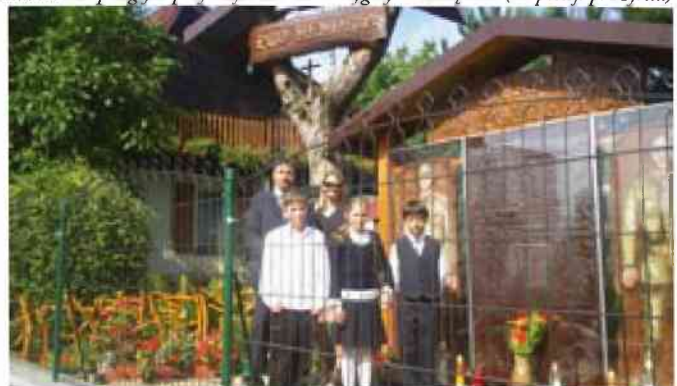
Składanie kwiatów przez młodzież i dykcję Zespołu Szkół pod „Epitafium”