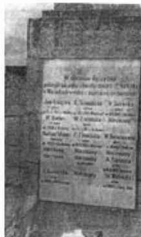
Nagrobek na mogile poległych