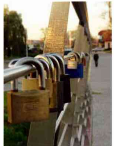
fot. Julia Gawęda →

← fot. Aleksandra Szczygieł Reportaż to, moim zdaniem, najtrudniejszy dział fotografii. Trzeba w ułamku sekundy stworzyć zdjęcie, nie tylko na określony temat, ale i odpowiednio skomponowane. „Malowanie” światłem i tonacja czarno-biała nadają dynamizmu całej scenie. (Wojciech Poznański)