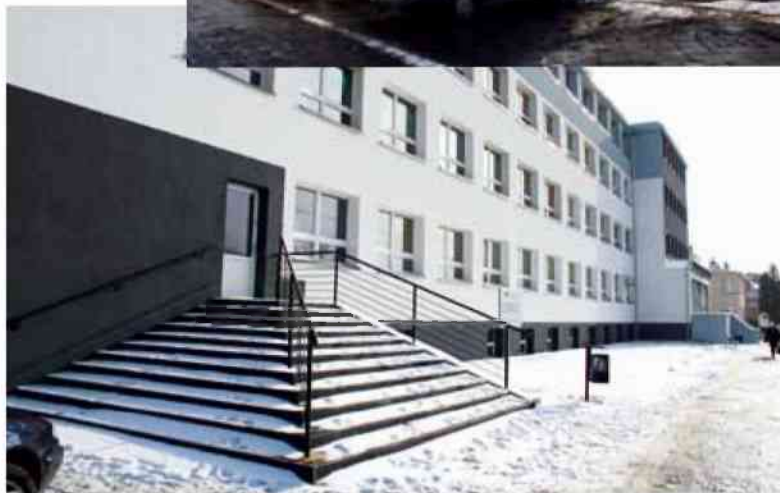
Powiatowe Centrum Usług Społecznych