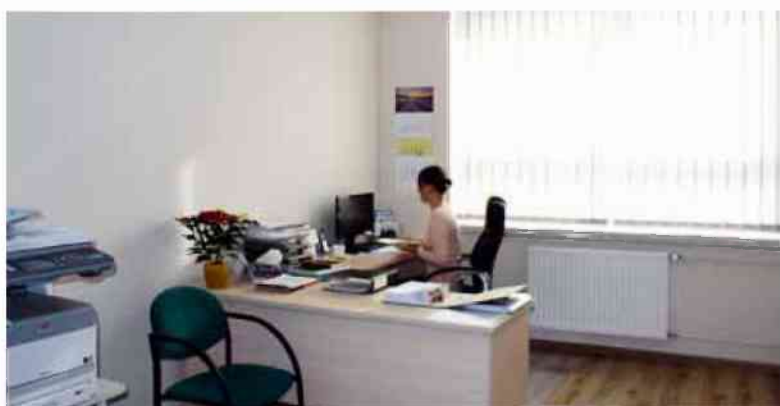
Wyremontowane pomieszczenia Powiatowego Inspektoratu Weterynarii