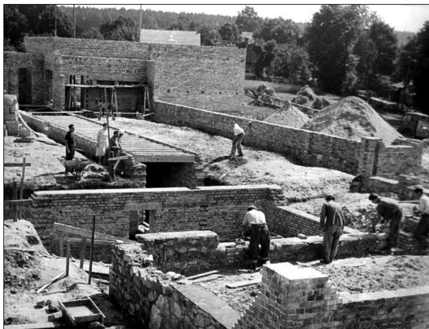
Powstaje Szkoła Tysiąclecia w Kościeliskach