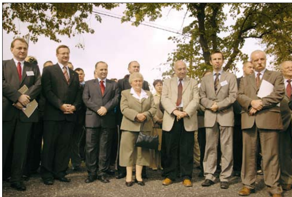
Nie zabrakło wielu znamienitych gości