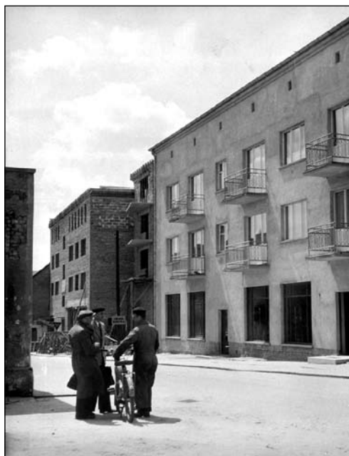
Nowy blok mieszkalny Spółdzielni Mieszkaniowej w Oleśnie