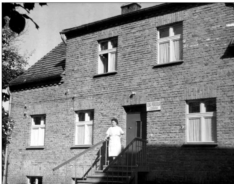
Izba Porodowa w Zębowicach