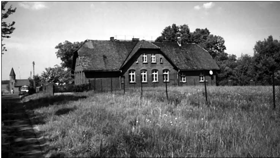
Budynek po nieczynnej szkole w Rzędowicach