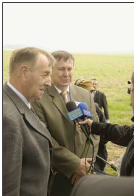
Wywiadom nie było końca...