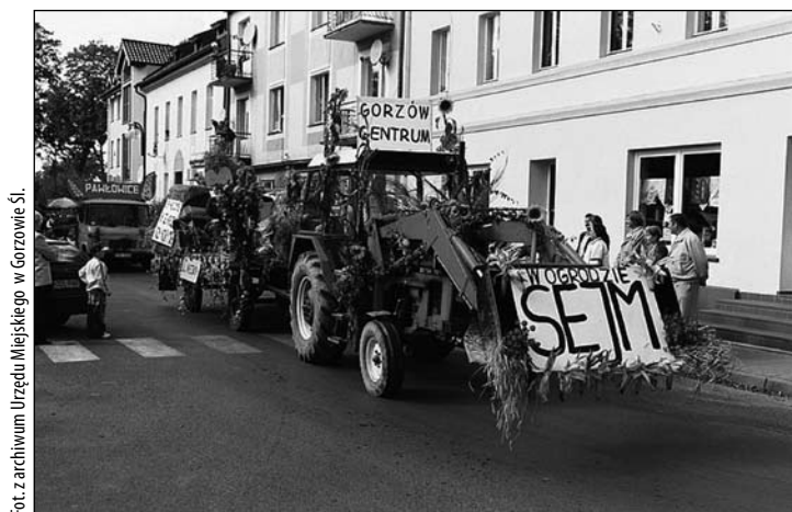
Fot. z archiwum Urzędu Miejskiego w Gorzowie Śl.