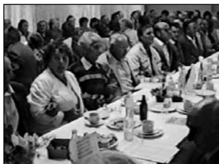
Jedno z założycielskich spotkań TSKN w restauracji „Aleksandra” w Oleśnie