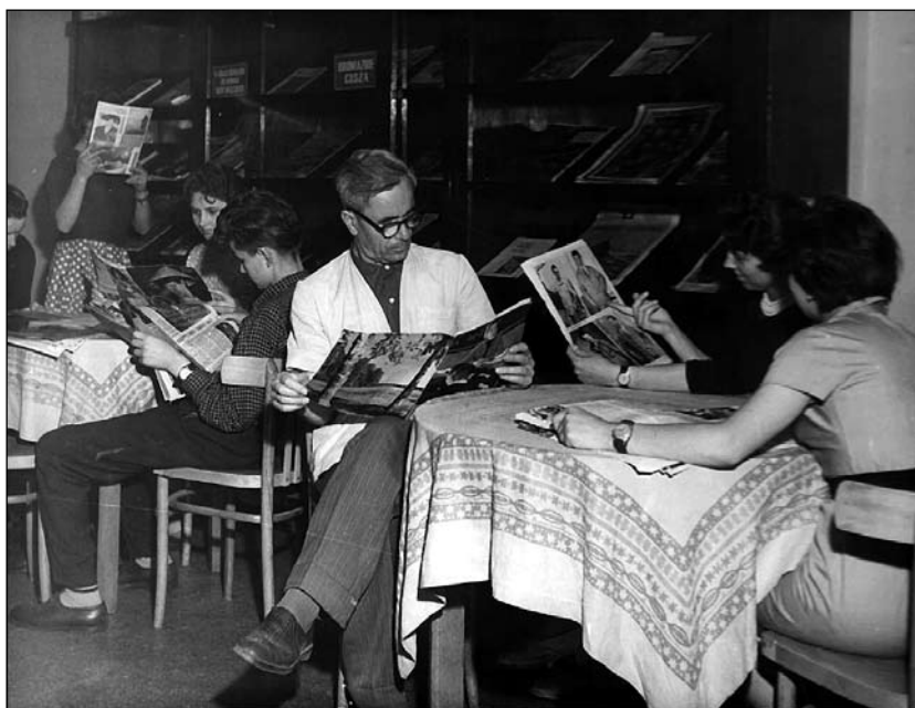
W czytelni Powiatowego Domu Kultury w Oleśnie