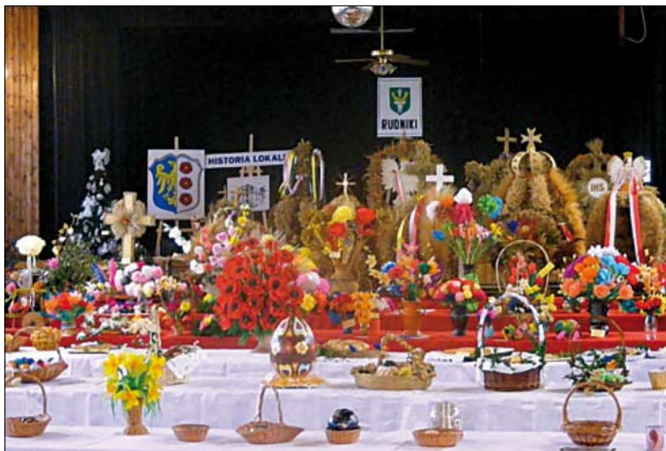
Jedno ze spotkań Historii Lokalnej w Rudnikach poświęcone było plastyce obrzędowej