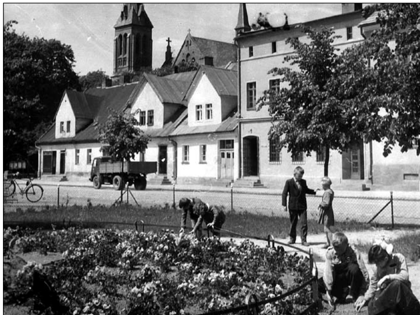
Fragment rynku w Gorzowie Śląskim