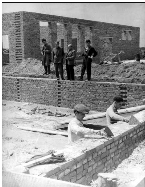
Rosną mury nowej lecznicy weterynaryjnej w Radłowie