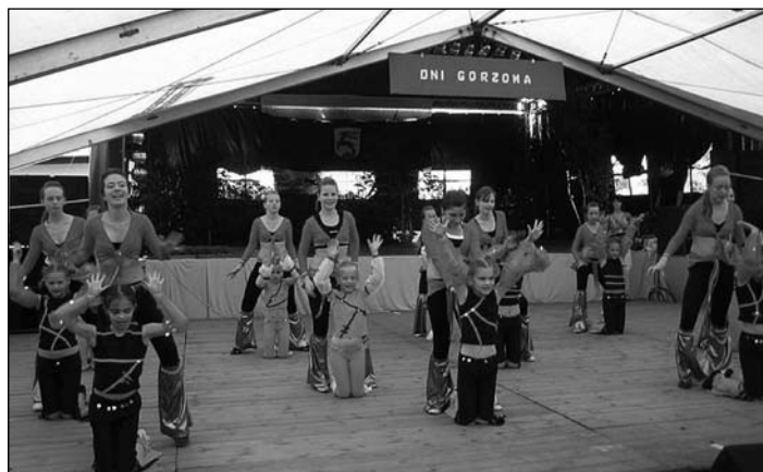
Ogólnopolski Turniej Tańca Disco