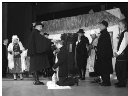
fol. Arkadiusz Ochman