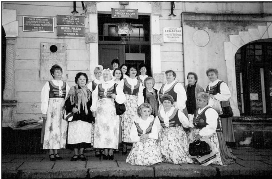
Gorzowianki w pełnej krasie

To było długotrwałe wyzwanie, ale wreszcie mazelonka była kolorystycznie dopasowana, kabotek z odpowiedniego materiału płóciennego, fortuch w kolorach kontrastowych do mazelonki, uszyte na miarę trzewiki ze skóry, czer-