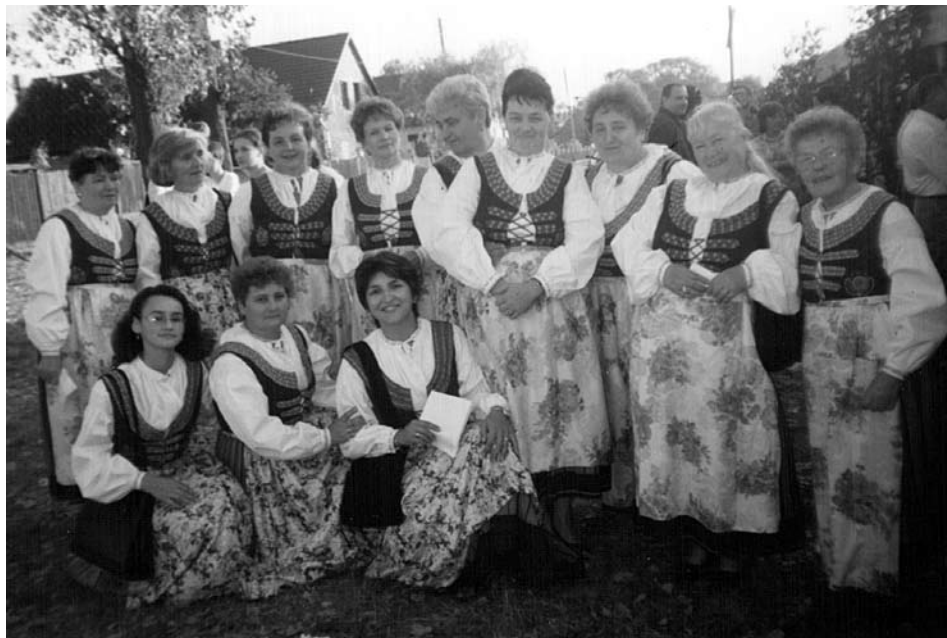
Połączyła je pasja śpiewania i kultywowania tradycji

„Gorzowianki” przygotowały jeszcze wiele imprez. Po raz pierwszy zorganizowały ludowy przegląd kolęd w grudniu 1994 roku. Zaproszonych było kilkanaście zespołów, które zaprezentowały ludową odmianę tych pieśni. Zakończyliśmy wtedy nasze 4-godzinne spotkanie wspólnym odśpiewaniem kolędy „Cicha noc”.