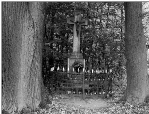
Kamień świętej Jadwigi k. wsi Kościeliska

Jako mała dziewczynka usłyszałam od mojego Taty, że na skraju lasu za Kościeliskami znajduje się kamień, na którym według tradycji jest odcisnięta stopa świętej Jadwigi, księżnej śląskiej, stopa jej psa i ślad laski. Święta Jadwiga miała stawać na tym kamieniu, kiedy wyglądała na swojego męża, księcia Henryka Brodatego, który polował w oleskich lasach. Kiedy byłam z rodzicami na odpuszczeniu w kościele świętej Anny, usłyszałam o sośnie wbudowanej w ołtarz kościoła, na której według przekazu pierwszą figurkę świętej Anny Samotrzeciej, mojej patronki, miała powieść święta Jadwiga.