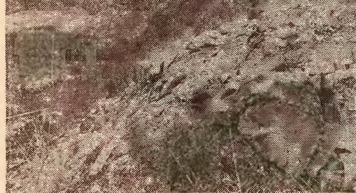
Dziki wysypisko w pobliżu zbiornika wody w Dziekowlach.