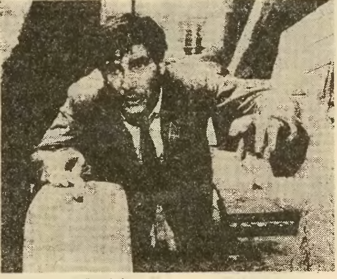
Scena z filmu "Frantic".