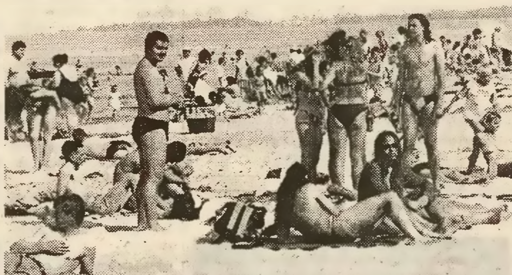
Bałtyk kojarzy się tylko z plażami, a przecież można dzięki niemu robić świetne interesy.

Dzisiaj, poza pojedynczymi poli- tykami, mającymi pełną świad- omość korzyści morskich, tworzy się coraz szersze „wy- brzeżowe” lobby działające go- spodarczo, złożone z władz wojewódzkich, lokalnych, sam- orządowych, miast i gmin po- łożonych wzdłuż morskiego brzegu, oraz większości śro- dówisk ludzi morza: marynarzy, stoczniovców i portowców. Dobrze się stało, że dołączy- li też naukowcy. Co prawda