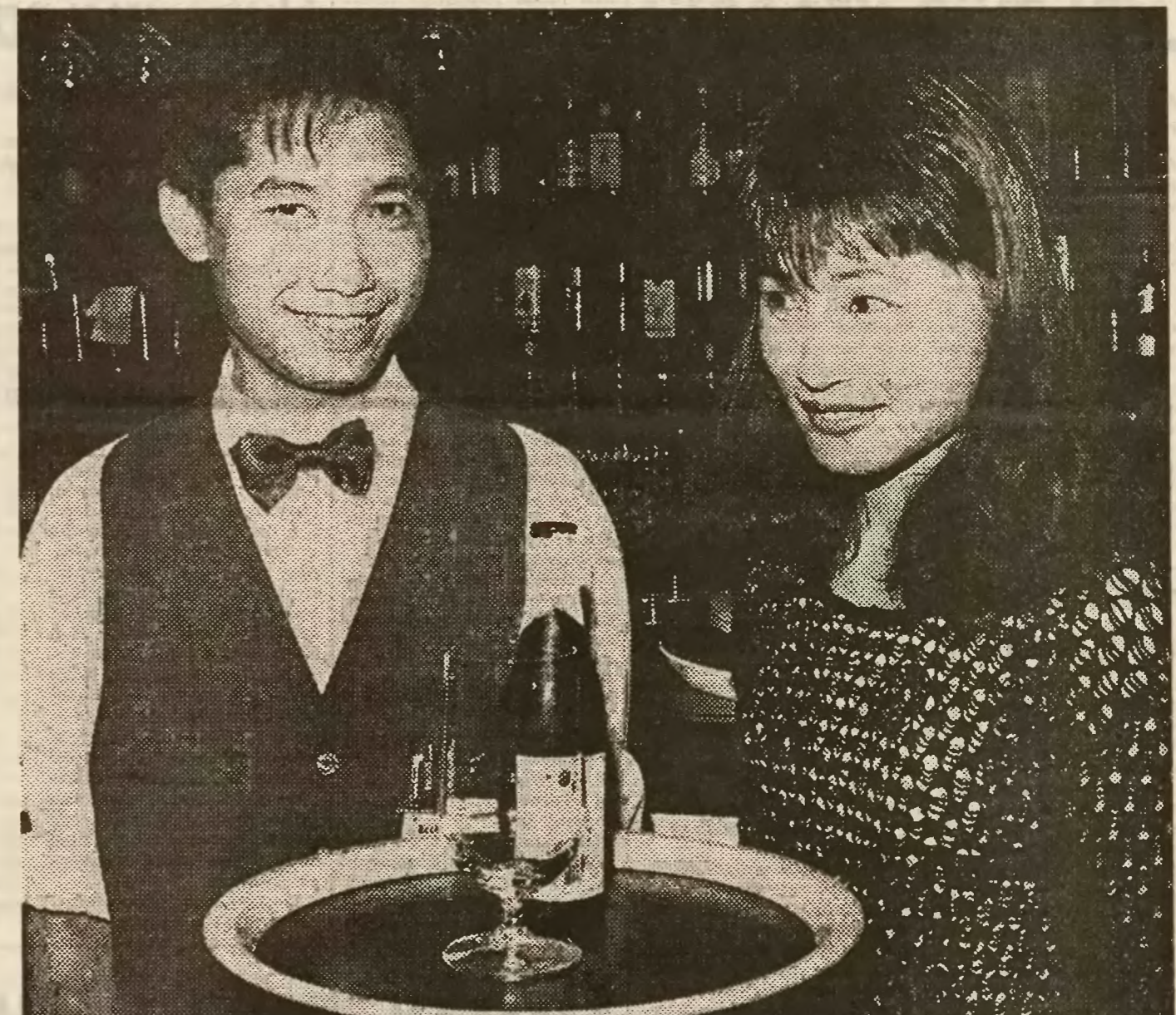
Wschodnia kuchnia jest może najsympatyczniejszą, ale na pewno nie najważniejszą dziedziną działalności Azjatów.