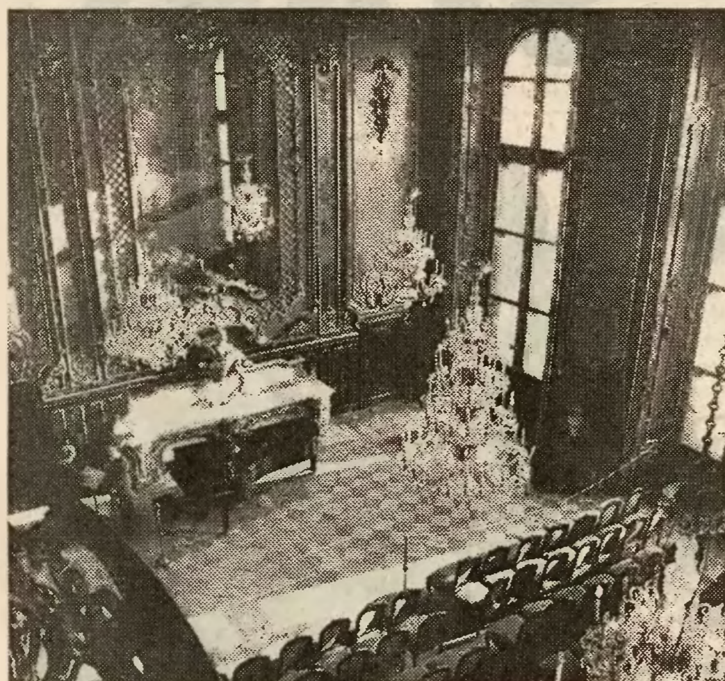
Lustra zdobiące ściany pszczyńskiego zamku powiększają pomieszczenia, które i tak nie są małe...

Pod każdym względem Pszczyna różni się od miasteczek typowych dla aglomeracji górnośląskiej. Położona nieco na uboczu stwarza wrażenie, że życie