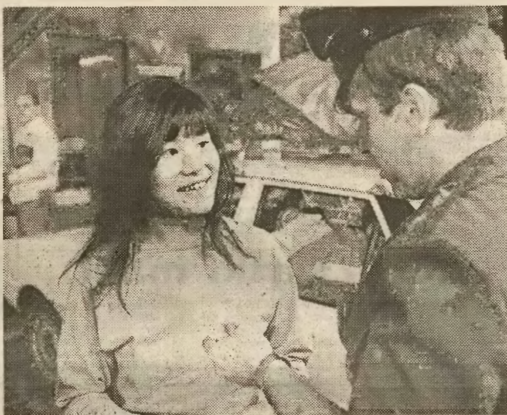
Nadciągają fale przybyszów z Dalekiego Wschodu.

Schemat „inwazji tygrysów” jest zawsze taki sam. Po kilku potentatach zaczynają napływać drobni przedsiębiorcy, a kiedy okazuje się, że tworzą własną, niewielką społeczność, nadciągają za nimi coraz więcej średnich i dużych firm.