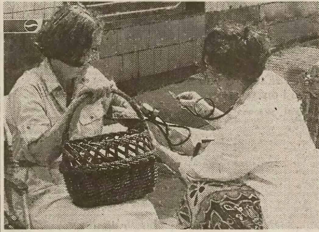
W czasie upału rośnie ciśnienie...