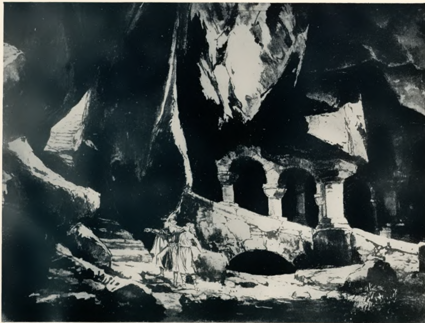
Die Uraufführung des „Parsifal“ im Bayreuther Festspielhaus vor fünfzig Jahren, am 26. Juli 1882 Szenenbild 1. Akt: Gurnemanz führt Parsifal nach der Gralsburg (Aus dem Reuter-Wagner-Museum in Eisenach)