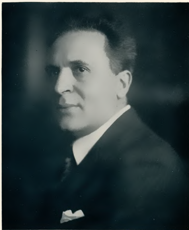
Prof. Bruno Walter

mantiker hält, weist in vielen seiner Werke romantische Elemente auf. Ich brauche nur seine „Frühlingsweihe“ — diesen ekstatischen Hymnus an die Urkraft der Natur — zu nennen. Wie ein rein naturalistischer Vorgang „romantisch“ wird durch die