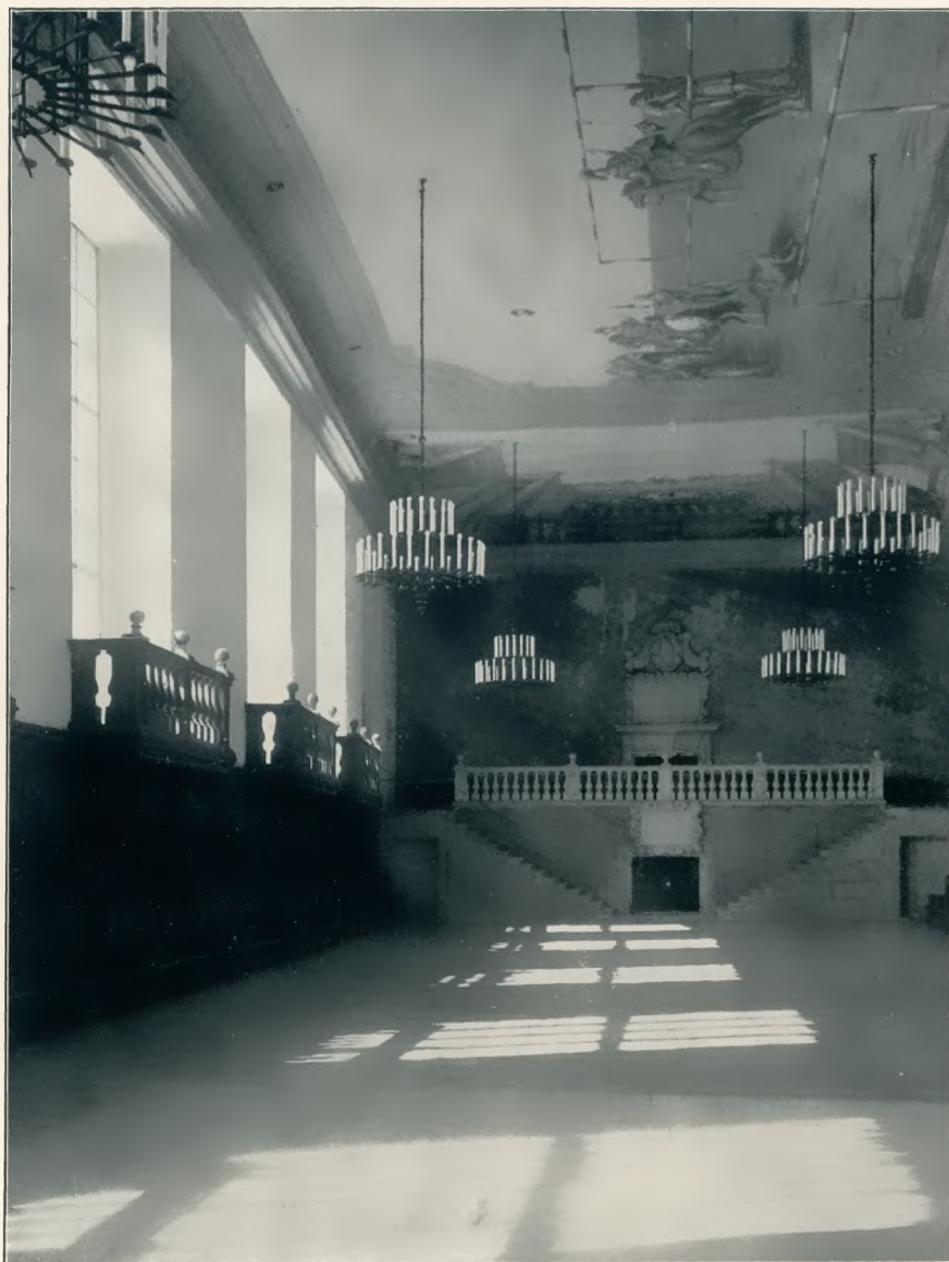
Der Stadtsaal des Festspielhauses in Salzburg