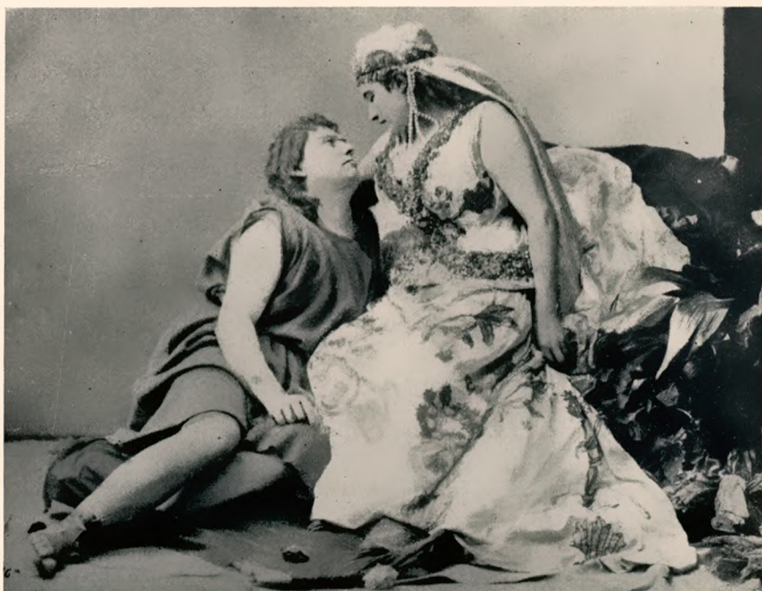
Hermann Winkelmann als Parsifal und Amalie Materna als Kundry bei der Uraufführung.

Die Württembergischen Landestheater (Stuttgart) bereiten zum 50. Todestag Richard Wagners für das Jahr 1955 die sämtlichen Bühnenwerke des Meisters in chronologischer Reihenfolge vor.