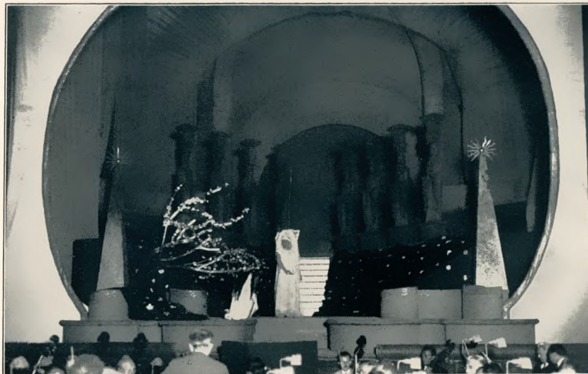
Aus den Salzburger Festspielen

im Vorjahre eine künstlerische Sensation bedeutete, war mit ihrer Tanzgruppe auch heuer in Salzburg tätig. Hofmannsthals grandioser „Jedermann“ ging in völlig neuer Gestaltung auf dem herrlichen Domplatz in Szene. Die größten Meister der Tonkunst aller Zeiten kamen mit Ausnahme Richard Wagners, der Bayreuth vorbehalten bleiben muß, zu Gehör: von Glucks „Orpheus und Eurydike“ über Mozarts „Figaros Hochzeit“, „Entführung aus dem Serail“, „Cosi fan tutte“ und „Zauberflöte“. Beethovens „Fidelio“, Webers „Oberon“ zu Richard Strauß „Rosenkavalier“ und „Frau ohne Schatten“. Das