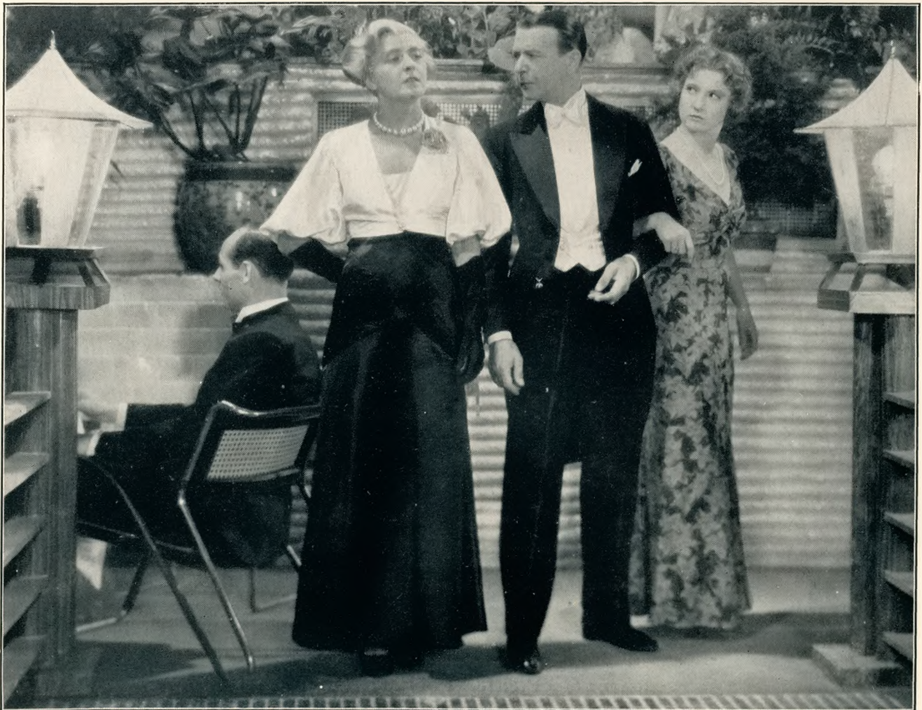
Hilde Hildebrand, Georg Alexander, Charlotte Ander in der musikalischen Tonfilmkomödie „Liebe, Scherz und — Ernst“ nach Oskar Wildes „Bunbury“. (Aus dem Nostrafilm der Messtro.) Regie führt Franz Wenzler.