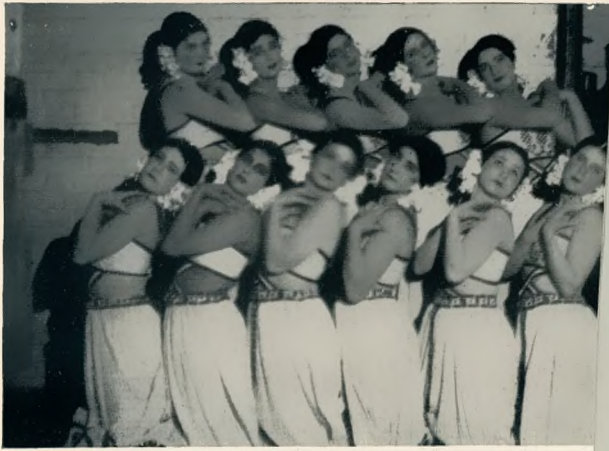
Aus der Tanzgruppe des Kasseler Staatstheaters

für die wirtschaftliche und künstlerische Unterhaltung des Theaters zu sorgen. Der preußische Staat hat 1866 bei der Verpreußung Kurhessens sich feierlich verpflichtet, das Kasseler Theater auf Staatskosten zu erhalten, und das Land Hessen übereignete dafür den Kronschatz, die ausgedehnten hessischen Forsten und Domänen, die Schlösser und Parks sowie die weltberühmte Kasseler Gemäldegalerie dem preußischen Staat. Diese vertraglichen Bindungen des Staates sind sogar beim Neubau des Kasseler Staatstheaters, den die Stadt seinerzeit mit einer Million Mark unterstützte, regelrecht erneuert worden, so daß das Vorgehen des Staates als durchaus rechtswidrig empfunden wird. Die Stadt hat das Ministerium be-