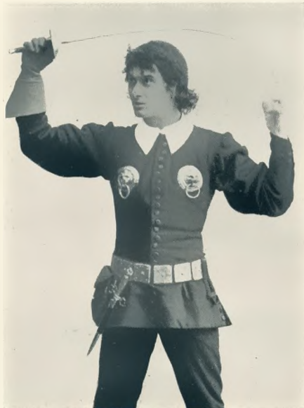
Josef Kainz † als „Hamlet“

Auf dem Gebiete des Theaters sind wir heute allzu leicht geneigt, die reproduzierende Tätigkeit höher zu stellen als die produzierende. Das Startum der Sänger und Schauspieler, der Dirigenten und Regisseure — es gilt vielfach und nicht zu Unrecht als eins der wesentlichsten Symptome der ungesunden Zustände. Trotzdem: dieses Startum radikal zu bekämpfen, hieße nichts anderes als: das Kind mit dem Bade ausschütten. Wie verkehrt solch Beginnen wäre, das Leben und die künstlerische Wesenheit des eben verstorbenen Siegfried Wagner, des Erben von Bayreuth, lehren es. Der Erbe von Bayreuth: als solcher wird Siegfried Wagner in der Geschichte der deutschen Musik, der deutschen Kultur fortleben. Fortleben auch dann noch, wenn der produzierende Künstler Siegfried Wagner längst vergessen sein wird. (Ist er's nicht vielleicht heute schon?) Das ihm anvertraute Werk eines anderen in höchster erreichbarer Vollendung Gestalt werden lassen: schönste und edelste Aufgabe des nachschaffenden Künstlers. Siegfried Wagner hatte das besondere Glück, daß es das Werk des demütig verehrten Vaters war, dem er mit solcher Treue dienen durfte. Dienst am Kunstwerk, mit solcher Treue