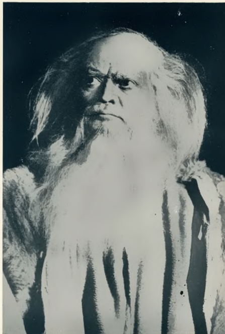
Rudolf Schildkraut † als „König Lear“

Ein Star wie wenige, ja ein wahrer Virtuose des Startums war der große Schauspieler Rudolf Schildkraut. Sonderbar: als die Nachricht von seinem Tode aus Amerika zu uns kam, war mancher überrascht. Warum? Weil Schildkraut in unserem Bewußtsein fast kaum mehr lebte. Es war das tragische Schicksal dieses reichen Menschen darstellers — und damit das tragische Schicksal der deutschen Bühne