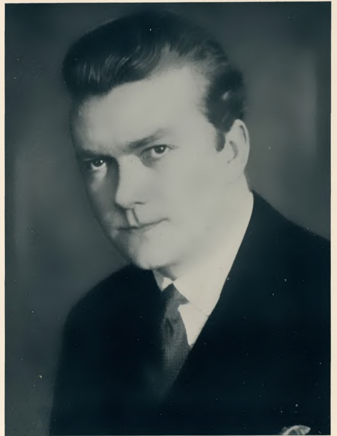
Gerhard Hüsch Staatsopern und Städtische Oper Berlin