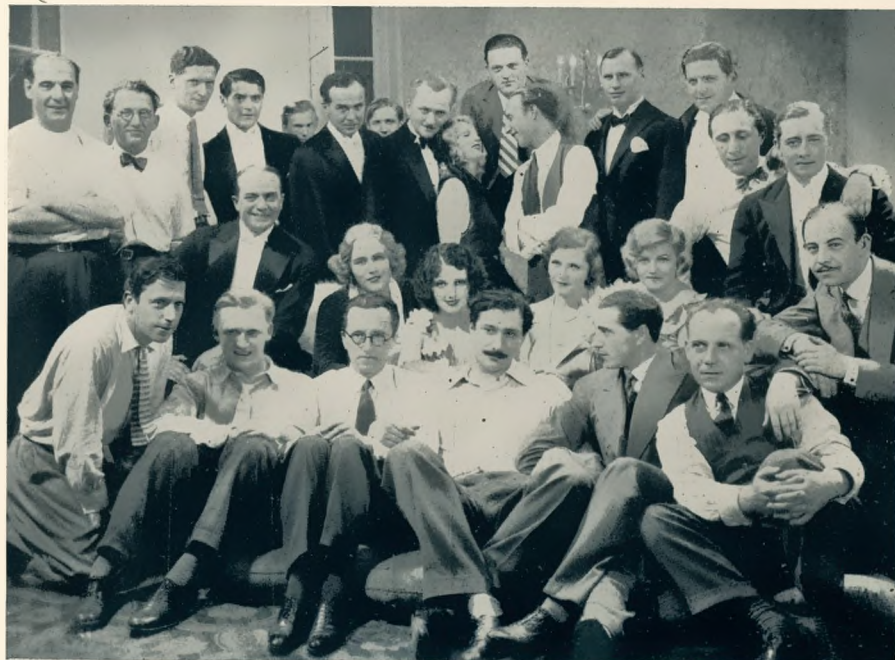
Die Darsteller des Universal-Tonfilms „Die große Sehnsucht“: Camilla Horn, Charlotte Susa, Betty Aman, Olga Tschedowa, Maria Paudler, Franz Lederer, Paul Heidemann, Walter Rilla, Theodor Loos, Fritz Rasp, Walter Janssen, Jack Trevor, der Komponist Paul Dessau, der Regisseur Szekely und der Produktionsleiter der Universal Joe Pasternak mit seinem Aufnahmestab