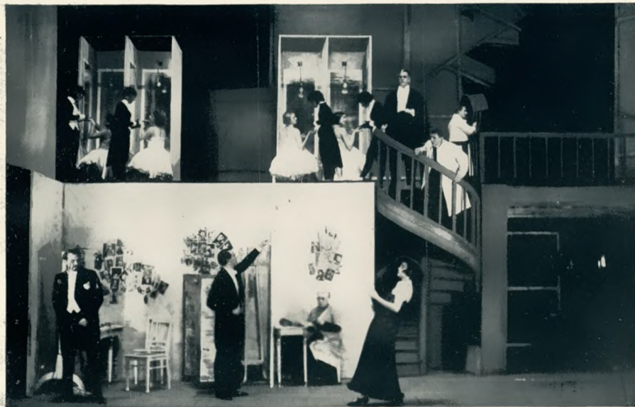
Wedekinds „Lulu“ Regie: Jacob Geis. Bühnenbild: Preußer

miths „Neues vom Tage“, Janaceks „Jenufa“, Verdis „Simone Boccanegra“, Bizets „Perlenfischer“, Alban Bergs „Wozzek“ als Erstaufführungen, sowie eine große Reihe von Neustudierungen angekündigt. Die Operette wird mit Werken von Kalman („Herzogin von Chicago“), P. Abraham („Viktoria und ihr Husar“), Benatzky („Meine Schwester und ich“) und Künneke („Der Tenor der Herzogin“) vertreten sein.