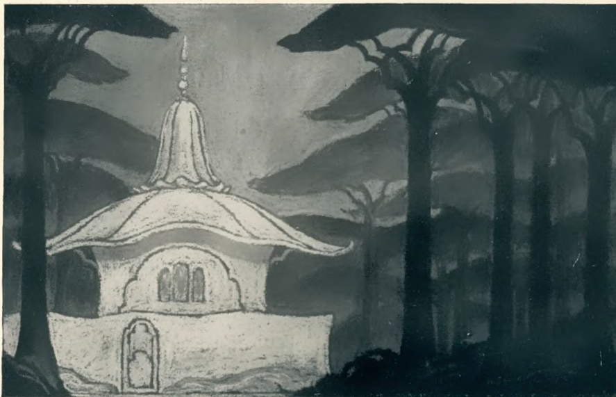
„Die Frau ohne Schatten“ von R. Strauß Regie: v. Niessen. Bühnenbild: Söhnlein

Mit dem vollbesetzten Orchester, das unter Rudolf Krasselts Führung in die Reihe der berühmten Weltorchester aufgerückt ist, werden alljährlich 8 Sinfoniekonzerte im Opernhaus gegeben, wo der Klassik, Romantik und der neuzeitlichen Kunst eine gleich liebevolle