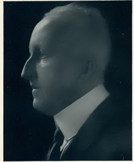
Siegfried Wagner †

—, daß es zwischen beiden zu keiner Dauerehe kommen wollte. Warum nicht? Weil in Schildkraut die große, heiße, rumorende Sehnsucht des Vaganten brannte, die immer wieder aus gebundenen Verhältnissen ausbrechen mußte. Einen gleichmäßigen, stillen Glanz zu verbreiten, dieses vielleicht höchste Glück auch des genialen Künstlers versagte ihm seine menschliche und künstlerische Natur. Ihm war vom Schicksal bestimmt, meteorhaft zu leuchten. Und wie man sich des Meteors als eines seltsamen Naturschauspiels er-