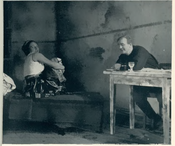
...enrich. Bühnenbild: Neher Speelmanns, Hoermann u. Ponto a. Kriegsgerichtsrat