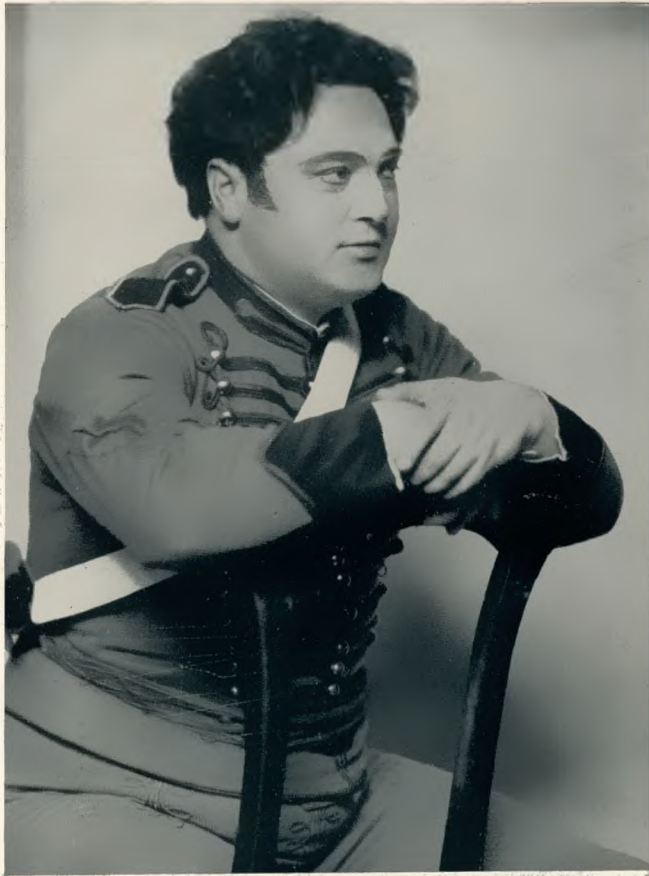
als „Don José“