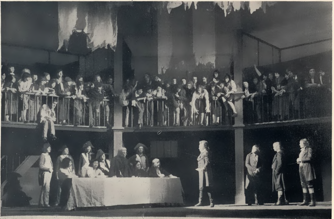
„Dantons Tod“, Drama von Büchner