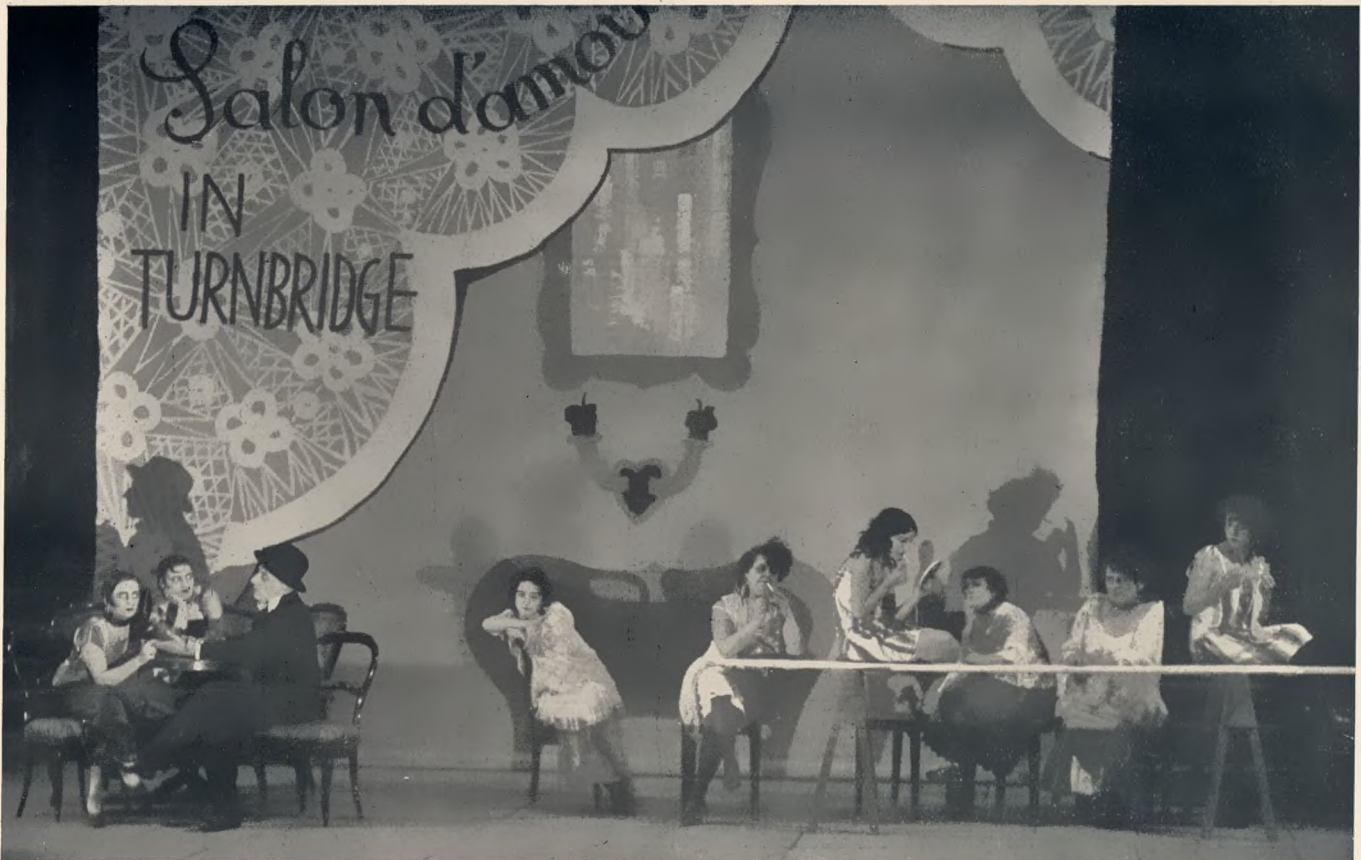
„Dreigroschenoper“ nach Gay von Bert Brecht und Kurt Weill Stadtheater Augsburg. Regie: Lustig-Prean. Bühnenbild: Leskoschek

das ihm in den meisten Fällen die Gegenspieler schuldig bleibt. Da schroff dementiert wird, daß Waldau ganz nach Wien (und Berlin) gehen wolle, ist anzunehmen, daß ihn nur ein Vertrag (ein Stück Papier) davon zurückhält. Wenn München ihn aber doch verliert,