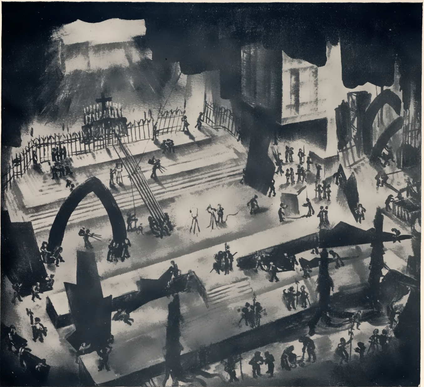
Umbau zu „Der singende Teufel“ von Schreker, Staatsoper Berlin