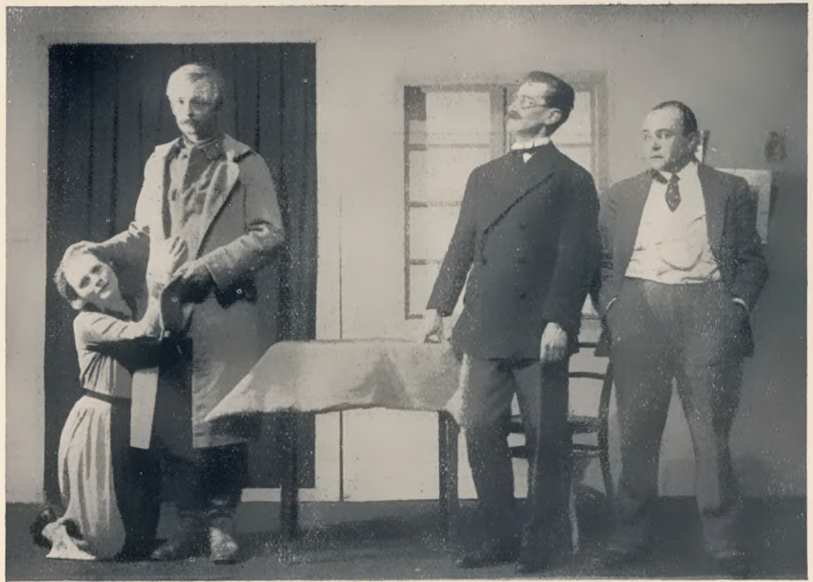
„Douaumont oder Die Heimkehr des Soldaten Odysseus“ phot. Otilie Nitzsche von Eberhard Wolfgang Möller Komödie Dresden. Regie: Koch

Eberhard Wolfgang Möller, ein junger Mensch, der noch ein Kind war, als der Krieg ausbrach, setzt sich in seinem Stück „Douaumont oder Die Heimkehr des Soldaten Odysseus“ mit dem Kriege auseinander: „Je furchtbarer, je gewaltiger es war in seiner Entsetzlichkeit, desto ernster sind wir daran, es durch Gestaltung zu bannen, denen, die daran gestorben sind, als Denkmal, uns als Weg und Zeichen, daß wir heraus sind.“ — Sieben Szenen, geschrieben mit der Leidenschaft einer Jugend, die im Kriege aufwuchs und sehen lernte, ziehen vorüber: Der Soldat O., der den Krieg vom ersten bis zum letzten Tage in der vordersten Reihe mitgemacht, der als einer der wenigen den furchtbaren Kampf um Douaumont überlebt hat, kehrt in die Heimat, in sein Haus zurück. Jahre sind vergangen. Langsam steigt er die Treppen hinauf — er trifft seinen Sohn, einen Untermieter, einen anderen Untermieter und schließlich seine Frau. Er spricht an allen vorbei, alle sprechen an ihm vorbei. Niemand versteht ihn, niemand erkennt ihn. Er bricht zusammen und wird in eine Wohnung gebracht, die einstmal seine