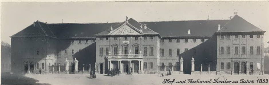
Hof- und National-Theater im Jahre 1853

MONUMENTALES SCHLOSS MIT SEHENSWERTEN SAMMLUNGEN