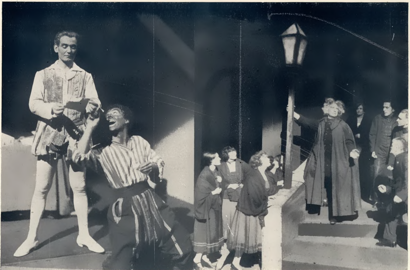
„Fiesko“ von Schiller. Regie und Bühnenbild: Pohl Feldhammer Richter

genannt werden. Bemerkenswerte Darsteller sind auch Richter, Paryla und Gelingk, die als Vertreter des jugendlichen Faches das „Provinz“-Niveau überragen. Zur alten Garde