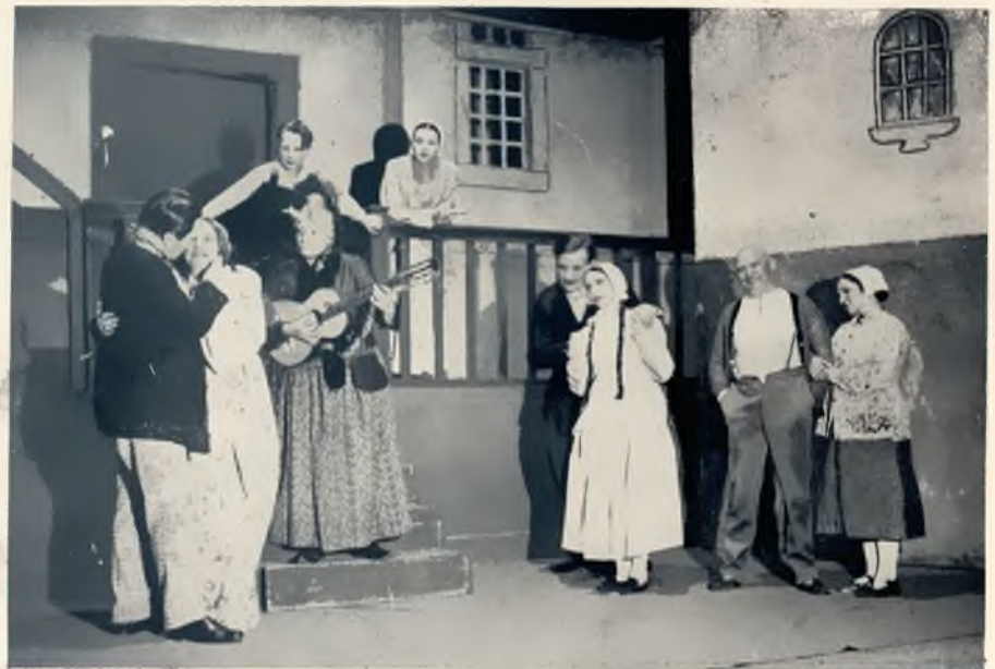
„Bei uns in der Altstadt“, Rheinisches Heimatstück Photos: Lantini von P. Seifert u. M. M. Ströter. Regie: Ludwig Schmitz u. P. Seifert. Bühnenbild: Sturm Weber, Dalands, Züge Dirk, Hall Schmitz, Alex