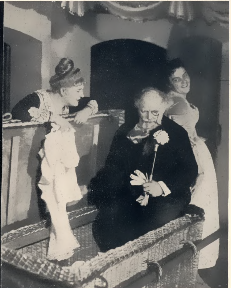
„Hoffmanns Erzählungen“ von Offenbach Staatsoper am Platz der Republik. Dir.: Zemlinsky Regie: Legal. Hammes Heidersbach