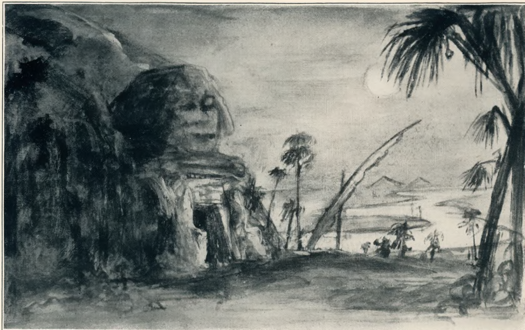
„Aida“ von Verdi, Städtische Bühnen Hannover. III. Akt Regie: Winkelmann. Bühnenbildentwurf: Dannemann

(Ellinger und Bernhard betreten von links das Parkett und bleiben — ihre Reihe suchend — vor der Loge stehen, in der Grün und Sonja sitzen. Sonja bemerkt die beiden und will hinunterreden, Grün verhindert das durch ein Zeichen mit der Hand und legt, Schweigen andeutend, einen Finger auf die Lippen.)