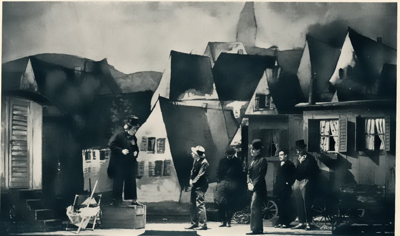
„Katharina Knie“ von Zuckmayer, Städtische Schauspiele Baden-Baden

Ich rate Ihnen, Prinzessin Eboli, bevor Sie sich entscheiden, lesen Sie das A B C des Kommunismus. Der Verfasser, dem eine dreißigjährige Erfahrung zur Seite steht, schildert nach einem geschichtlichen Ueberblick unter atemraubender Spannung mit klarer Zielsetzung und abwechselnden Ausblicken von der Warte seiner leninistischen Plattform unter allseitiger Beleuchtung und erprobten Ratschlägen, behandelt ausführlich das Verhältnis der konkreten Zusammenhänge im Lichte der ökonomisch materialistischen Dia-