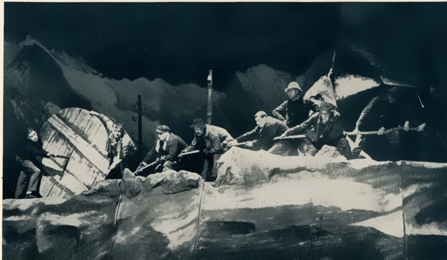
„Die Bergbahn“ von Horvath, Volksbühne Berlin Regie: Schwannecke. Bühnenbild: Suhr

Von der Musik Lehars blieb fast alles erhalten; wie einst können wir uns über diese Partitur mit ihrem Reichtum an sanglichen Melodien, mit ihren echt empfundenen Walzern und den großen, fast opernhafte Finali, erfreuen. Verändert ist außer der gelegentlichen Verschiebung im Rhythmischen nur die Instrumentation, die an manchen Stellen um die Klänge der Jazzband, um Banjo und Saxophon, bereichert ist. Neu sind — außer der Begleitmusik der Revueszenen — einige von Lehar hinzukomponierte Num-