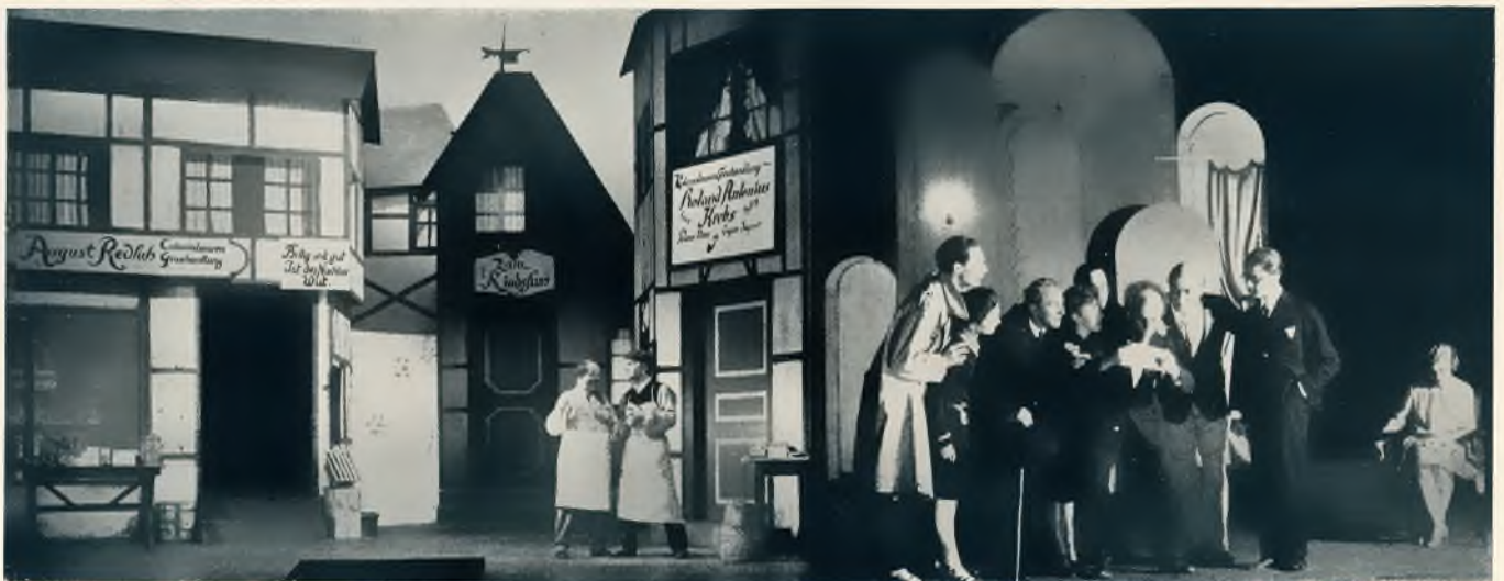
„Kolonialwaren und Liebe“ , Lustspiel von Eugen Gerber I. Akt. Stadttheater Krefeld Regie: Martin. Bühnenbild: Huhnen