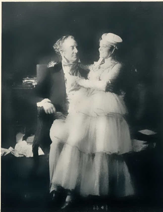
„Ist er gut? Ist er böse?“ von Didérot Schillertheater Berlin. Regie: Hoffmann-Harnisch Gülstorff Klokow

Für die Art der Frau Werbezirk habe ich nicht den geringsten Sinn. Die Gerechtigkeit verlangt, daß ich abermals den von mir aufrichtig ver-