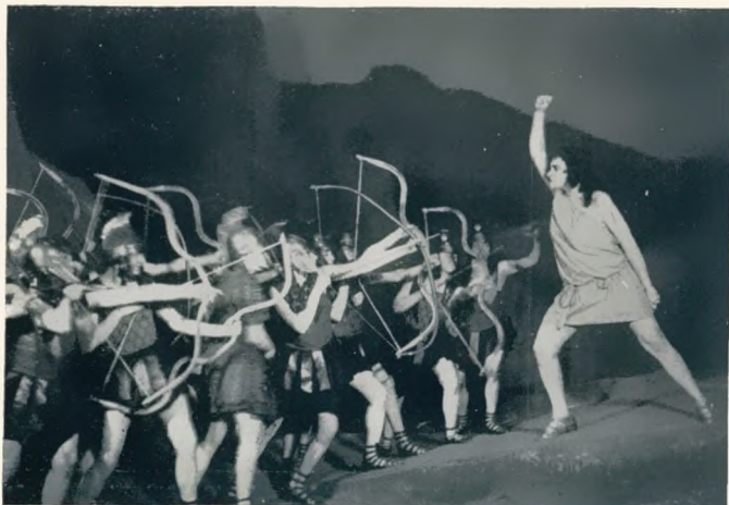
„Penthesilea“ von Schoeck Regie: Staegemann. Bühnenbild: Hasait und Pälz Tervani

Nicht alles und nicht alle konnten gewürdigt, ja nur genannt werden; dazu ist der Raum dieser Arbeit zu eng bemessen. Worauf es ankam, war ja auch in erster Linie: die bewußte Aufbau-Arbeit der Dresdner Staatsoper zu zeigen.