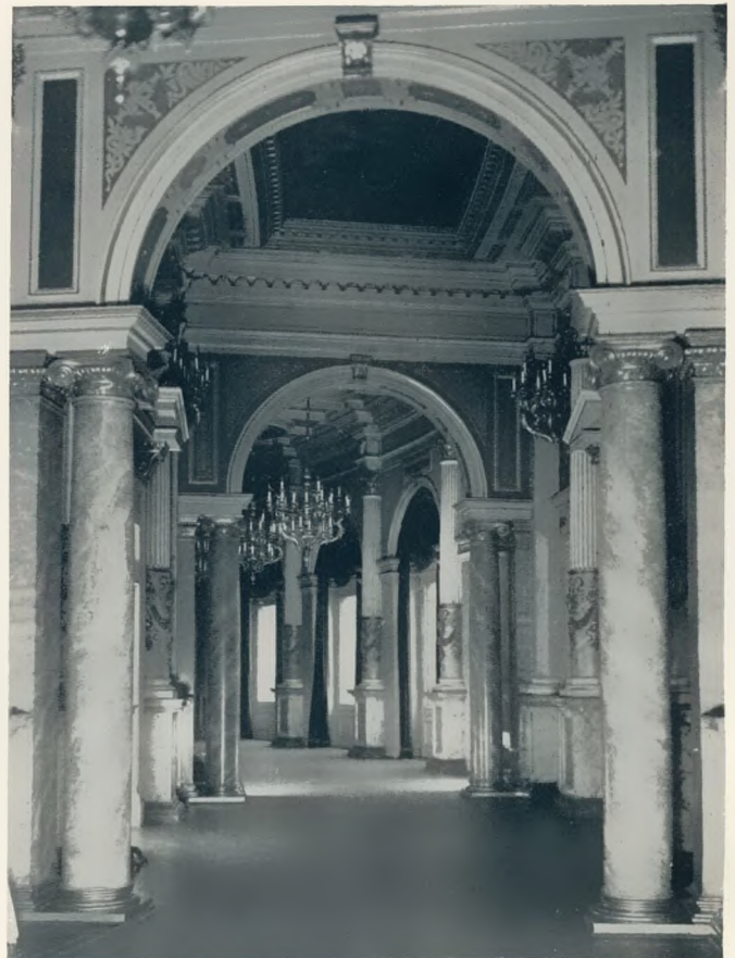
Säulengang im Foyer des Dresdner Opernhauses