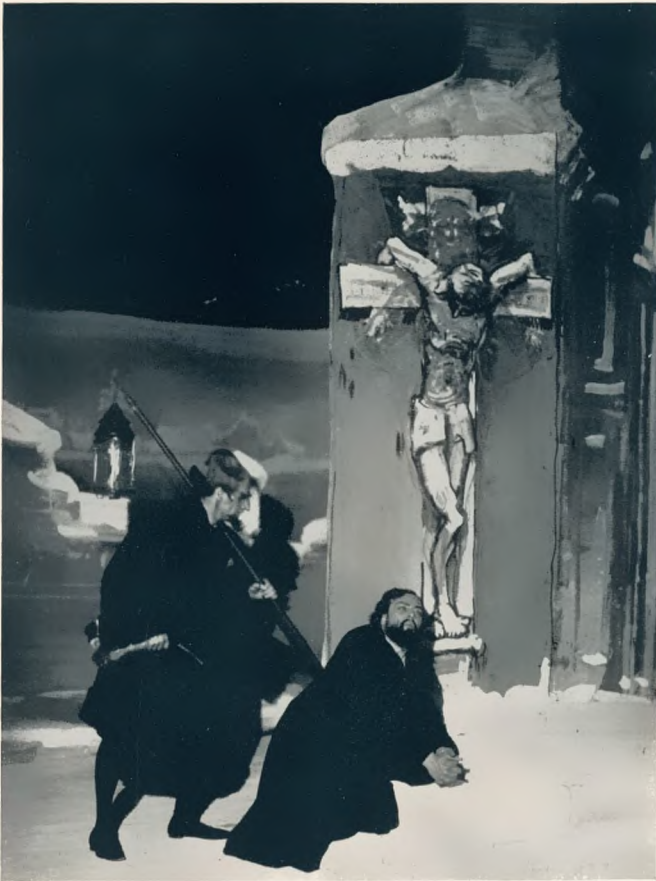
„Doktor Faust“ von Busoni, Staatsoper Dresden Regie: Reucker. Bühnenbild: Dannemann Strack Burg