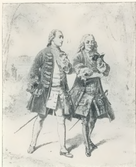
Friedrich der Große und Voltaire Holzschnitt nach W. Camphausen Zum 150. Todestag Voltaires

„Das glaub' ich nicht,“ sagte Shaw, „bei dem schläft nur das Publikum.“