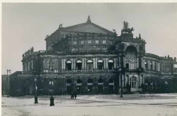
Die Dresdner Staatsoper

Ueber den „Boris“ hinaus gleich wieder ein ähnliches Ereignis hervorrufen zu wollen, wäre fast vermessen gewesen. So war es der einzig rechte Gedanke, in der folgenden Saison (1923/24) dem Spiel-plan etliche seltener aufgeführte Werke wiederzugewinnen, also auf eine planmäßige Repertoire-Erweite-rung hinzustreben. Man begann mit Wagners „Rienzi“, der — nicht zuletzt dank Vogelstrom in der Titelrolle — weit größere Lebens-