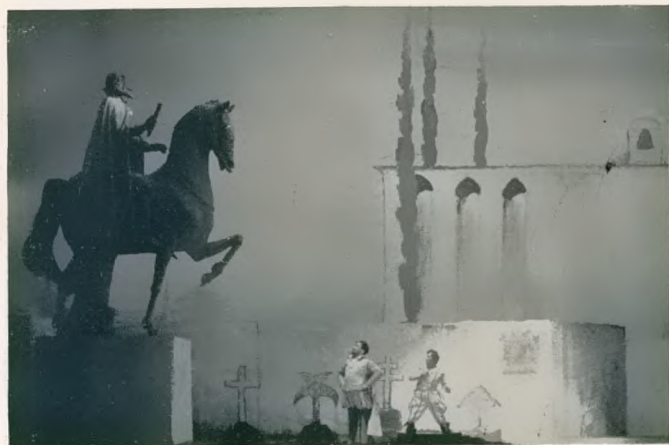
„Don Giovanni“ von Mozart Regie: Mora. Bühnenbild: Slevogt Burg Ermold

Und hier ist der Augenblick, in dem an das große Strauß-Jahrzehnt der Dresdner Oper unter Schuch abermals erinnert wer-