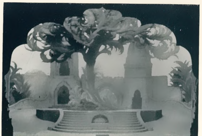
„Xerxes“ von Händel Regie: Reucker. Bühnenbild: Fanto