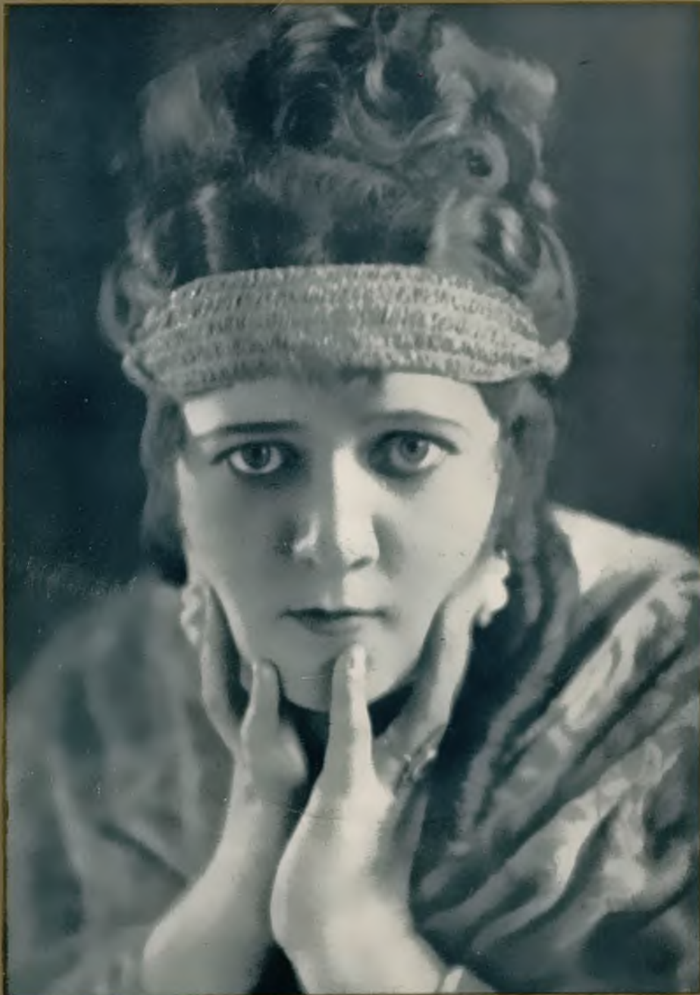
ELISABETH RETHBERG, STAATSOPER DRESDEN