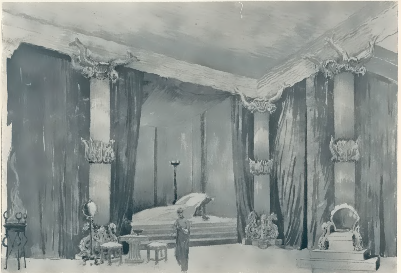
„Die ägyptische Helena“, Oper von Richard Strauß, Staatsoper Dresden Regie: Gutheil-Schoder a. G. und Erhardt. Bühnenbild: Fanto

Das „Glück des Erörtertwerdens“, in dem Polgar „eine Art sublimierter Gage“ erblickt, kann manchmal auch Brotlosigkeit zur Folge haben. Trotzdem wird dieses Glück noch lange unangetastet bleiben. Denn die Zeitung verlangt nach Schilderung von Menschen, deren Tätigkeit sich im Spiegel der Öffentlichkeit und nicht hinter der Mattscheibe des Schalterbeamten abspielt. Ein Bericht über eine landläufige Blinddarmoperation dürfte nur den Arzt, den Patienten und höchstens noch den entfernten Blinddarm interessieren. Doch die Kritik über den „Arzt am Scheideweg“ uns alle, denen die betreffende Ausführung zugänglich ist. Kür.