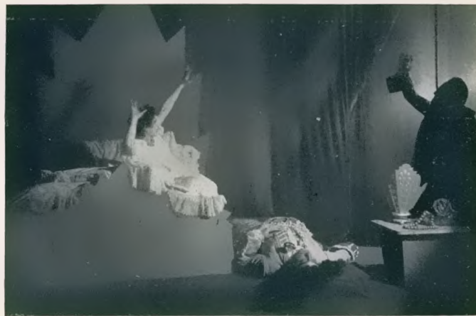
„Cardillac“ von Hindemith I. Akt 2. Bild. Regie: Dobrowen. Bühnenbild: Raffaelo Busoni Nikisch Eybisch Burg