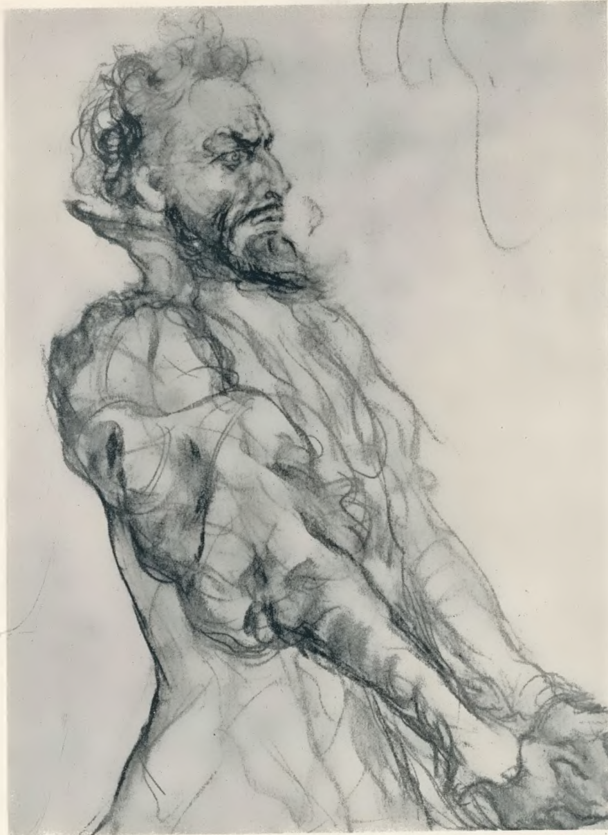
Zeichnung von Arthur Grunenbeig