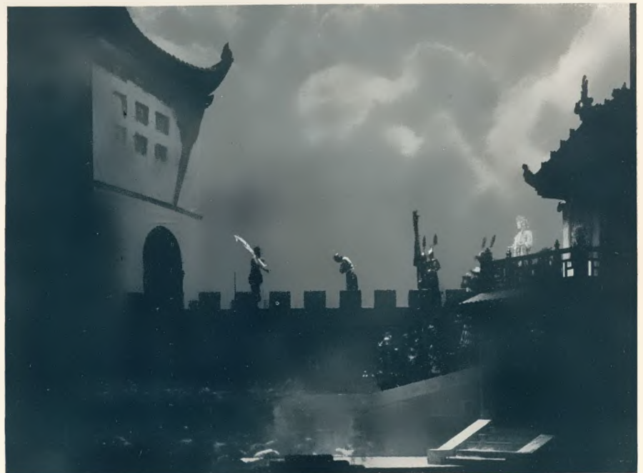
„Turandot“ von Puccini, I. Akt Regie: Dobrowen. Bühnenbild: Fanto

Kehren wir noch einmal zu jener reichen Spielzeit zurück, an deren Anfang „Feuersnot“ stand, so bleibt noch vieles Merkwürdige nachzutragen. Mit der nächst den Göttinger Festspielen ersten Aufführung des Händelschen „Xerxes“ (in Oskar