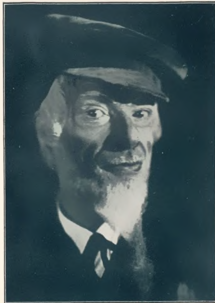
„Um ihn?!“ von Hofmeier, Staatstheater Kassel Regie: Geis. Bühnenbild: Schöнке