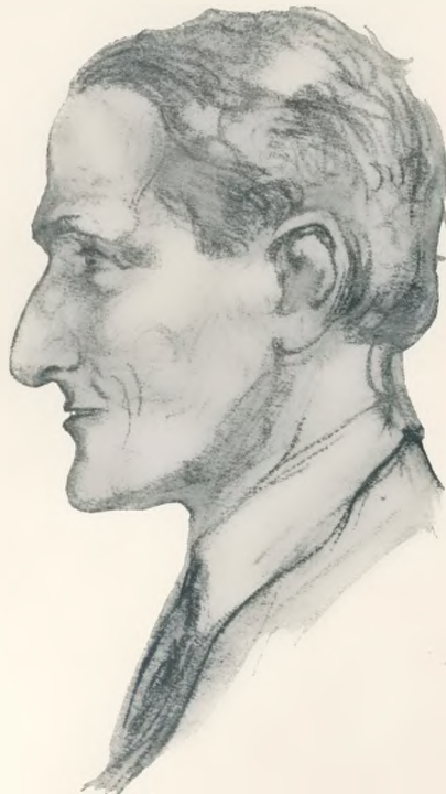
Italo Montemezzi, der Komponist der in Berlin uraufgeführten Oper „Die Liebe dreier Könige“ Zeichnung von Arthur Grunenberg

Darius Milhauds „Opéra minute“ „Die Entführung der Europa“ war zusammen mit Miniatur-Einaktern von Toch und Hindemith gelegentlich des Kammermusikfestes in Baden-Baden zur Aufführung gekommen. Intendant P. Bekker gab dem Komponisten die Anregung, dieses knappe Operchen durch ähnliche musikdramatische Miniaturwerke zu ergänzen. So entstand ein Kurzopern-Zyklus, in dem die bekannte Familiengeschichte aus der antiken Mythologie fortgeführt und zu einem gewissen Abschluß gebracht wird. „Die verlassene Ariadne“ und „Der befreite Theseus“ waren also Uraufführungen im Rahmen des Ganzen, dem man mit gespannter Aufmerksamkeit entgegenah. Sieben, elf und neun Minuten beträgt die Aufführungsdauer dieser drei Minutenoperen, in denen knapp und prägnant eine in sich abgeschlossene Handlung musikdramatischen Ausdruck findet. Henri Hoppenoth ist der Textdichter. Das Ganze darf, was besonders Ausstattung und Kostümierung betonte, als leichte Travestie angesprochen werden, die von einer phantasie- und espritreichen Melodik der Singstimmen und des Chors und einer von Klangeffekten reich durchsetzten Musik eines Kammerorchesters scharf untermalt wird. Intendant Paul Bekker hatte sich für die Inszenierung persönlich eingesetzt und auch für eine glänzende Ausstattung (Dr. Beckerath) Sorge getragen. Edith Märker, Eyvind Laholm und Karl Köther waren die hervorragenden Interpreten der Gesangspartien. Der starke Widerspruch nach dem ersten Teil ließ sich später nicht mehr vernehmen. Frig Günther