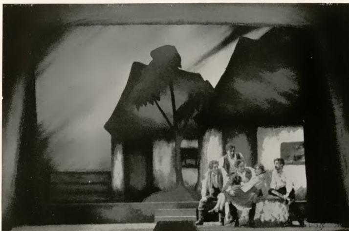
Zuckmayers „Schinderhannes“ im Stadttheater Erfurt Regie: Schirmer / Bühnenbild: Fleiner