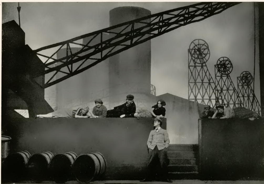
„Die Petroleuminseln“ von Lion Feuchtwanger, Deutsches Schauspielhaus Hamburg Regie: Ziegel / Bühnenbilder: Daniel / Von l. n. r.: Quinque, Latz, Goetz, Loschitz, Baeteke, Huth, Rehr

Über die talentierte Anlage kommt das Stück nicht hinaus. Die Ausführung ist unsicher. Die Absichten des Autors bleiben unklar und die Lösung unbefriedigend. Er trägt das soziale Problem, das er sich als Kernpunkt gedacht hat, stückweise an seine Gestalten heran. Er bewegt die Handlung ungenügend vorwärts und kommt unvermittelt zu einem knalligen Schluß. Er sieht wohl Menschen, aber er kann noch nicht mit ihnen umgehen. Seine Revolte bleibt