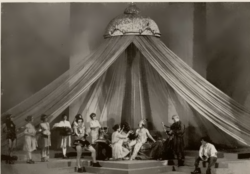
„Troilus und Cressida“ im Burgtheater Wien Zeska Mayen