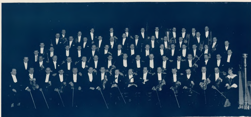
Die Mitglieder des Städtischen Orchesters in Bremen