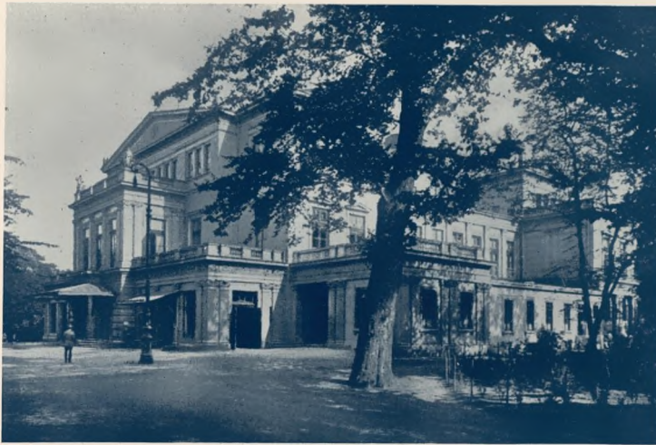
Das Bremer Stadttheater

teuersten Plätze abnehmen, im Grunde recht wenig bekümmert, wenn sie sich angenehm und ohne allzu große geistige Anstrengung den Abend vertreiben können. Wir mit unseren literarischen und kulturellen Anforderungen sind durchaus in der Minderheit und können nichts Besseres tun, als uns mit Fassung in diese Tatsache zu ergeben, die durch ihr wirtschaftliches Gewicht alle sanfteren und idealeren Neigungen im Keime erstickt.