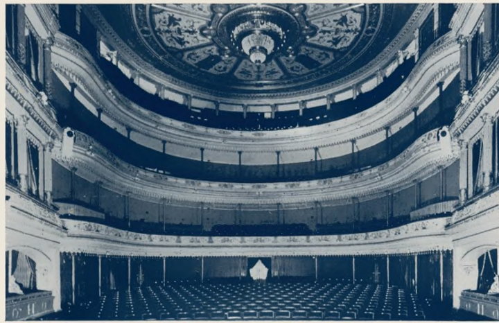
Blick in den Zuschauerraum des Bremer Stadttheaters