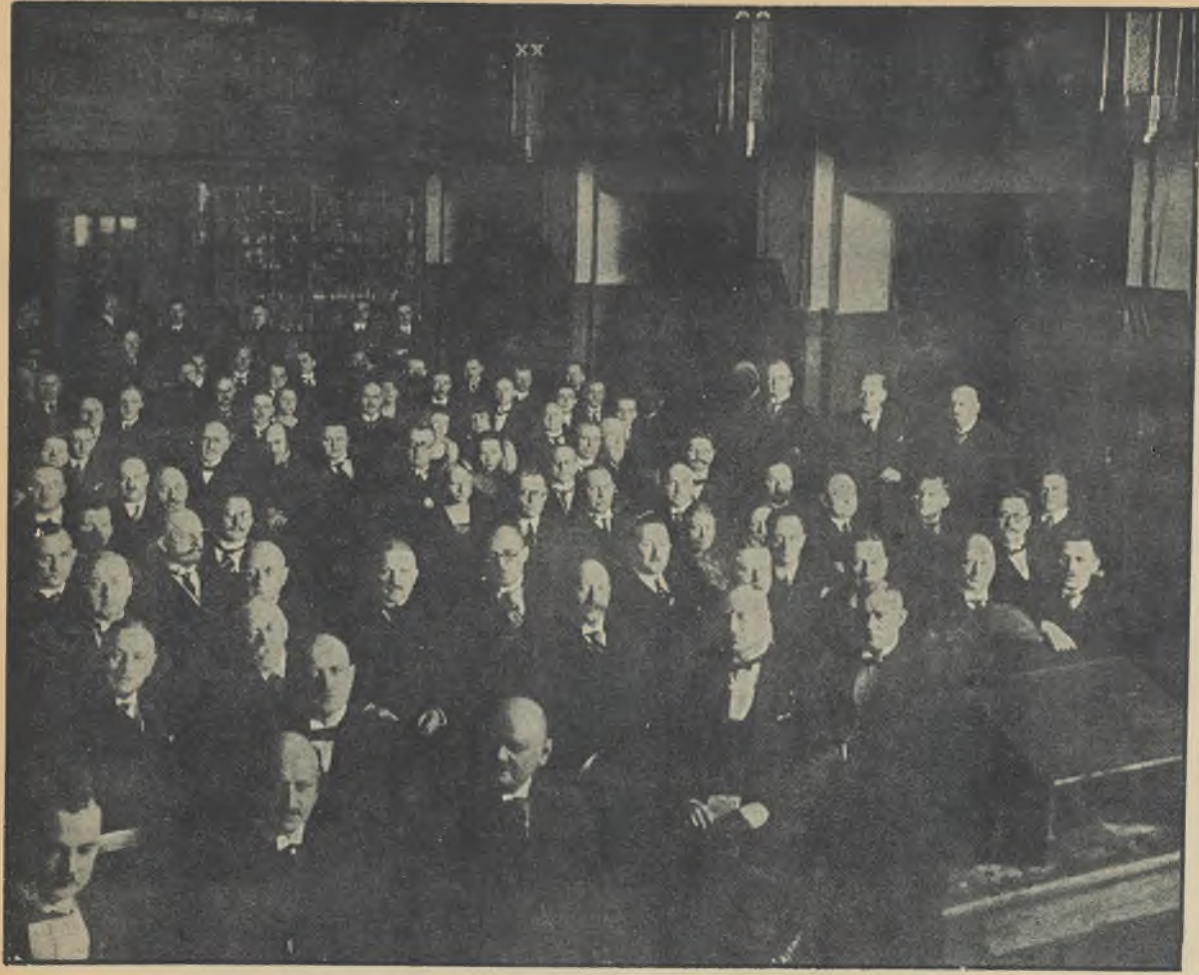
Oberschlesischer Zahn- ärztetag in Hindenburg. Am Sonnabend und Sonntag (27/28. Febr.) fand in Hindenburg ein ober-schlesischer Zahnärztetag statt, der sich besonders mit dem Problem der Zahnpflege in der Schule befaßte. Unser Bild: die Teilnehmer bei den Beratungen.