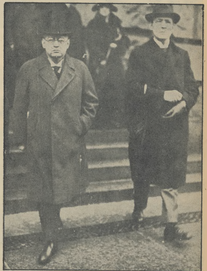
Nach der Feier vor dem Portal des Reichstags.