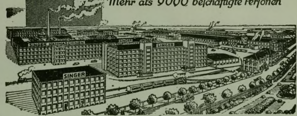
Singer Nähmaschinen-Fabrik in Wittenberge Bez. Potsdam