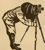
PHOTO- ARTIKEL für Amateure