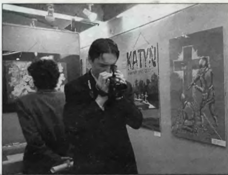
Młodzi pamiętają o tragedii polskich oficerów

W Katowicach rozstrzygnięto wczoraj konkurs dla młodzieży szkolnej „Katyń – Golgota Wschodu”. Najlepsze prace pojedą na ogólnopolski finał do Warszawy.