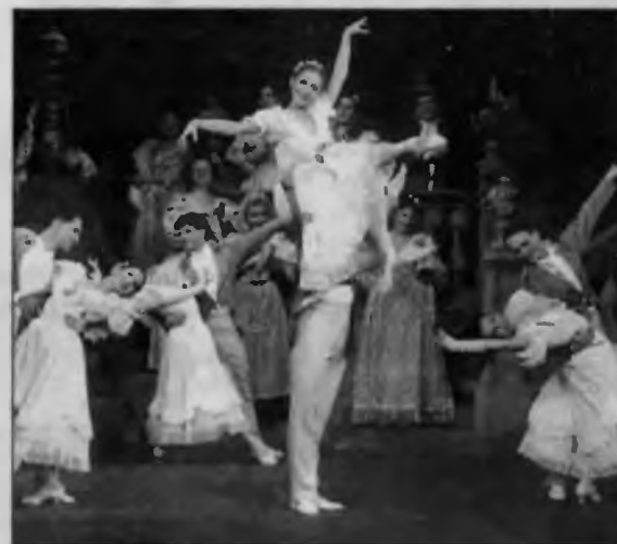
Artyści Opery Śląskiej w scenie zbiorowej spektaklu „Baron cygański” Johana Straussa.

Najpiękniejsze fragmenty z operetek, walce, polki, szalone kankany, arie i duety zabrzmiały w niedzielę o godz. 18. w Operze Śląskiej w Bytomiu. „Wiosenna Gala” rozpocznie uwerwura do „Lekkiej kawalerii” F von Suppe.