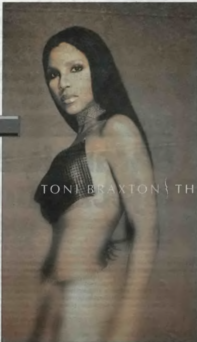
TONI BRAXTON { TH