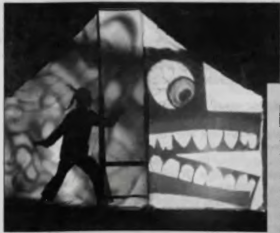
Spektakl „Bardzo smutny księżę”

Wystąpi 16 teatrów polskich oraz 24 zagraniczne z Europy (Belgia, Niemcy, Hiszpania, Włochy, Anglia, Rosja, Ukraina, Białoruś, Czechy, Węgry, Serbia, Słowenia), USA, Izraela, Japonii i Tajwanu. Pokażą ponad 40 spektakli na