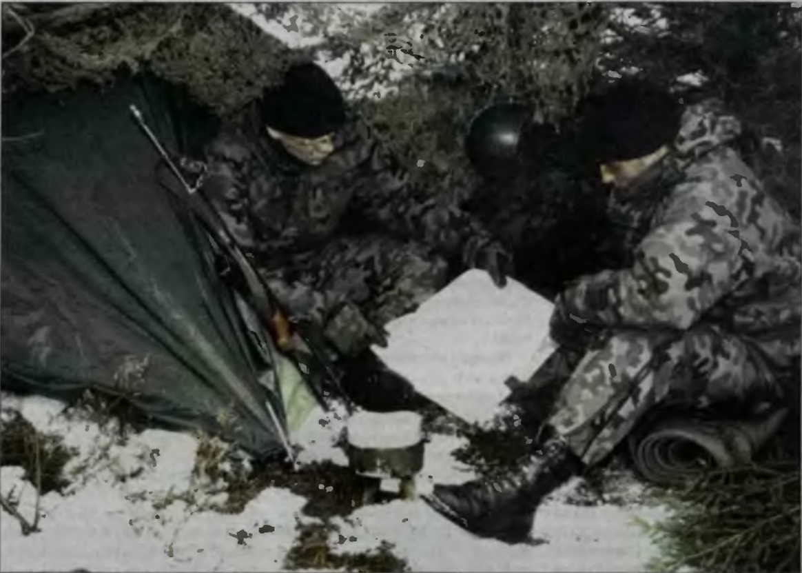
Nowe umundurowanie musi się sprawdzić w każdych warunkach.

Kiedyś żołnierze chodzili w mundurach z nadrukowanym wzorem o sympatycznej nazwie „deszczyk”. Zastąpił go „moro”. Teraz wojsko wyposażono w mundury z nadrukiem „puma”. Już niedługo żołnierskie elity paradować będą w Gore-Texie, dotychczas powszechnie używanym przez himalaistów i ekstremalnych globtroterów.