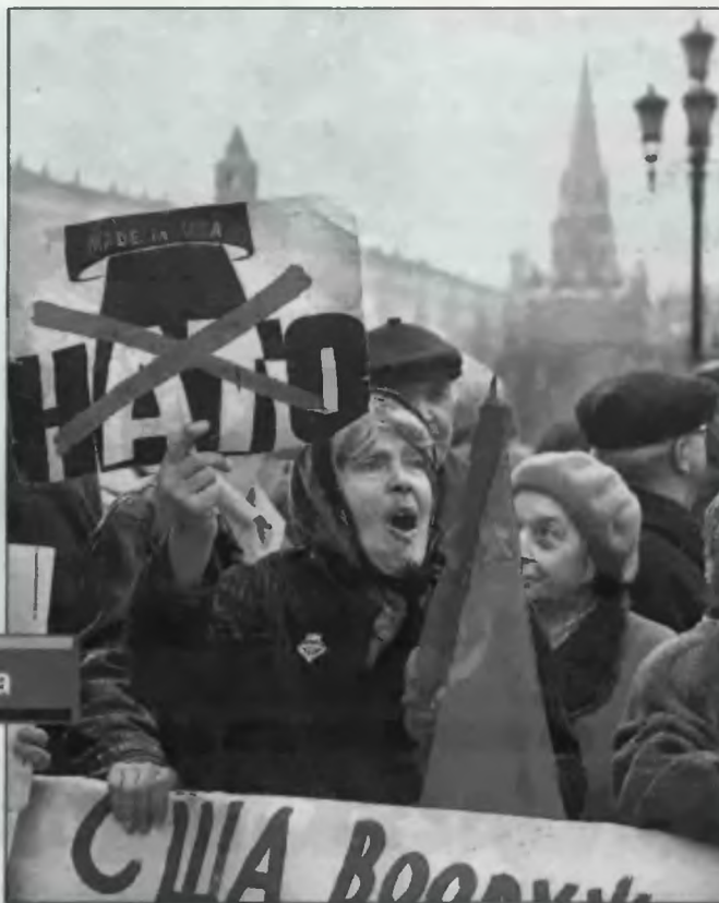
Wczoraj przed Dumą Państwową przeciwnicy ratyfikacji układu START-2 demonstrowali rosyjscy komuniści.

Rosyjska Duma Państwowa ratyfikowała wczoraj rosyjsko-amerykański układ o redukcji strategicznych zbrojeń ofensywnych START-2. Przewiduje on redukcję liczby rakiet z 6,5 tysiąca do 3 tysięcy.