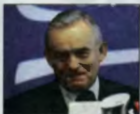
L. Miller nie widzi innego kandydata dla lewicy.

Prawdopodobnie dziś Aleksander Kwaśniewski potwierdzi czy kandyduje w wyborach prezydenckich - ma dać odpowiedź liderom SLD, partii, która wczoraj poparła jego kandydaturę. - Nie widzę innej możliwości, by SLD udzieliło poparcia komuś innemu niż Aleksander Kwaśniewski. Ale żeby tak się stało, on sam musi się zgłosić - powiedział wczoraj Leszek Miller, szef SLD. Kiedy liczy na jego odpowiedź? - Prezydent przebywa w Turcji, być może w sobotę będę znał jego opinię - dodał. Ale oficjalnie kwestię, kto będzie kandydatem Sojuszu rozstrzygnie Krajowa Konwencja Wyborcza SLD.