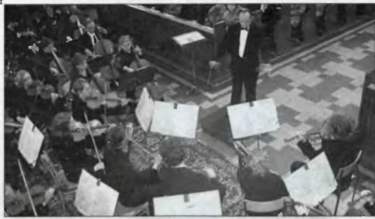
Wiele z imprez „Dni Muzyki Wokalnej” odbywało się poza murami katowickiej Akademii Muzycznej, na przykład wykonanie „Requiem” G. Faure, co najlepiej świadczy o tym, że festiwal dawno przestał być zwyczajną prezentacją akademicką.