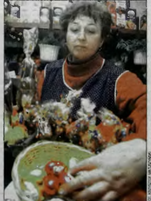
Przypomnijmy, że jutrzejsza Palmowa Niedziela to dzień handlowy. Większość sklepów - nie tylko tych największych - będzie czynna jak w dzień powszedni.

Wielu producentów przygotowało swoje standardowe wyroby w wielkanocnym przebraniu. Sprzedawcy niektórych artykułów spożywczych sprzedają starając się zwiększyć poprzez świąteczne opakowanie. Czekolada „Na Wielkanoc”, czy multipak (6 puszek) piwa „Świątecznego” z gratisową rękawicą kuchenną lub cztery butle