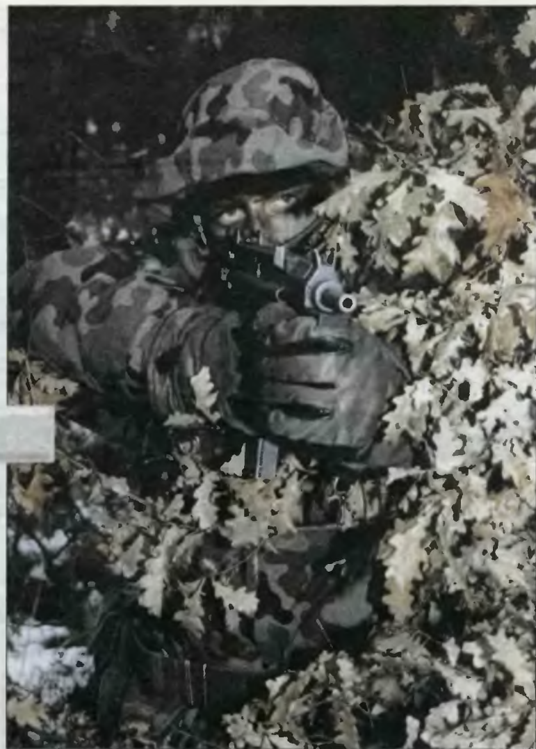
Żołnierze z Lublińca testują nowe rękawice, mundury, czapki.

– Zasobnik sprawdził się na manewrach za granicą. Zastosowaliśmy w nim mnóstwo „patentów”, dopracowanych przez wojsko. Można odpiąć klapę kryjącą i nosić ją jako samodzielną torebkę, mocowaną przy pasie. Od dużego zasobnika odpina