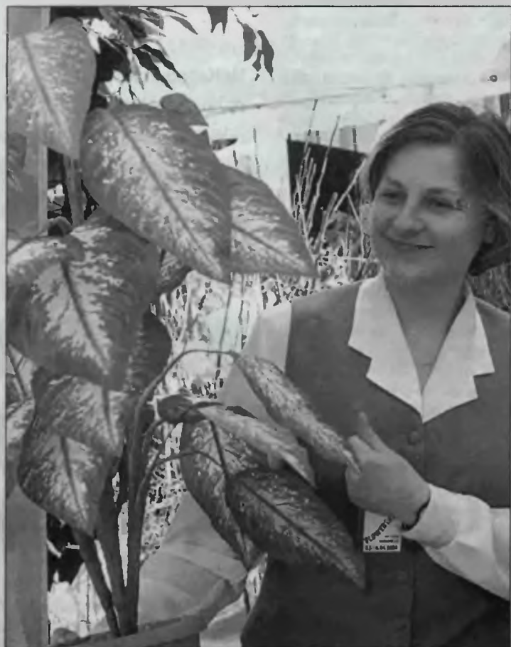
Kwiaty sztuczne wyglądają jak żywe.

Od czwartku do jutra trwają targi XX „Flower Targ”. Można na nich zobaczyć stoiska około 150 wystawców, nie tylko z Polski. Zwiedzający oglądają i kupują kwiaty, rośliny, meble i wyposażenie ogrodów. Wybredni i leniwi mogą zapoznać się z ofertą sztucznych roślin. – W większości klimatyzowa-