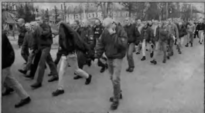
Młasto przestraszyło się najazdu skinheadów.