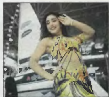
Już za kilkanaście dni biura podróży za-inaugurują tegoroczny sezon wypoczynkowy. Teraz prezentują się na targach.