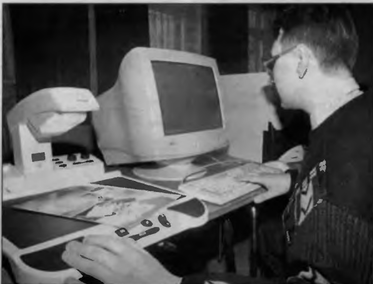
Urządzenie do powiększania tekstu dla niedowidzących.

Osoby zainteresowane kupnem sprzętu elektronicznego mogą skorzystać z programu nieoprocentowanych pożyczek „Komputer dla Homera”. Z kredytów mogą skorzystać ludzie należący do I lub II grupy inwalidzkiej z powodu poważnej dysfunkcji wzroku. Maksymalna kwota nie może przekroczyć 60 tys. zł. Okres spłaty wynosi pięć lat, z tym, że po spłaceniu połowy kredytu można wystąpić o umorzenie zadłużenia. Szczegółowych informacji na temat programu „Komputer dla Homera” udziela śląski oddział PFRON w Katowicach, pl. Grunwaldzki 8-10/10 nr tel. 594-40-82. ■ GZ