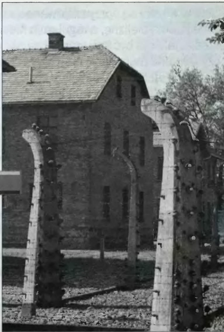
Zreformowane podręczniki nie mówią o zagładzie Żydów w Oświęcimiu.

Do nauczania o holokaucie zobowiązują m.in. inicjatywy, do jakich przystąpił polski rząd. To np. deklaracja wiedeńska z 1993 roku, zalecenia polsko-izraelskiej komisji podręcznikowej z 1995 roku oraz ostatnia deklaracja sztokholmska ze stycznia 2000 roku. Obowiązkiem państwa polskiego jest więc promowanie wiedzy na ten temat. Zgodnie z deklaracją podpisaną w stolicy Szwecji, kraje zobowiązały się do ustalenia „Dnia Pamięci o Holokaucie”. Nic nie stoi na przeszkodzie, by w Polsce stał się nim dzień wybuchu powstania w getcie warszawskim, a więc 19 kwietnia.