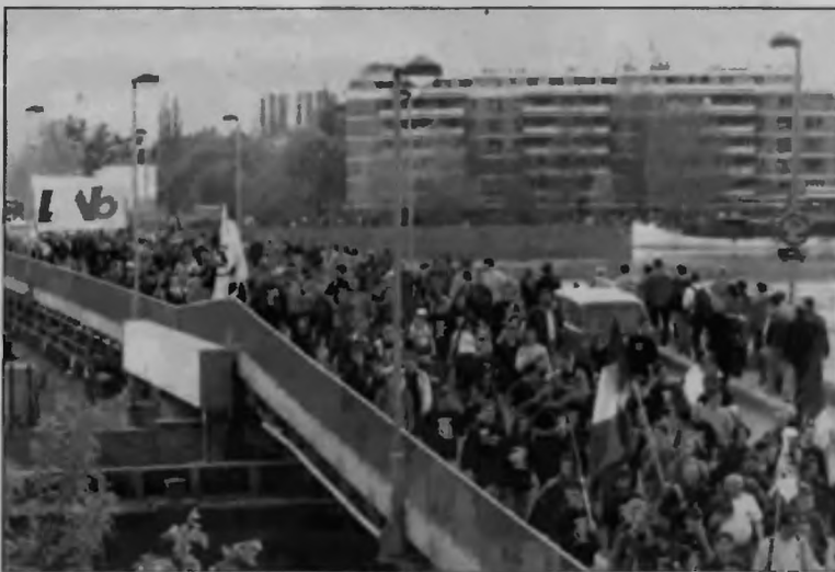
W wlecu zorganizowanym przez serbską opozycję wzięło udział kilka tysięcy studentów.

Drasković zaatakował gwałtownie prezydenta Jugosławii Slobodana Miloševića i jego popleczników. – Nie chcemy być zabijani ani przez NATO, ani przez Miloševića, ani przez kogokolwiek – oświadczył Drasković. Mówiąc o władzach w Belgradzie Drasković powiedział: – To są nie tylko modercy. To są najwięksi rabusie i najwięksi zdrajcy w dziejach tego narodu. Gdzie jesteś Slobodanie, czy widzisz ze swego bun-