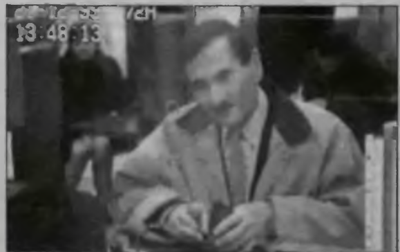
Zdjęcie oszusta, zarejestrowane bankową kamerą.

Przedstawiciele organów ścigania podejrzewają, że mężczyzna mógł być ucharakteryzowany. Sprawa wyszła na jaw kilka dni po oszustwie, kiedy prawowity właściciel lokat pojawił się w banku, aby sprawdzić wysokość odsetek. Nie wiadomo, w jaki sposób oszust uzyskał dane poszkodowanego oraz dokumentów bankowych. ■ PIET