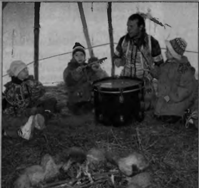
W Grabówce koło Białegostoku Stowarzyszenie Przyjaciół Indian rozstawiło na leśnej polanie namioty tipi. Obozowisko okazało się olbrzymią atrakcją dla okolicznej dzieciarni, która mogła podziwiać polskich Indian w całej okazałości.