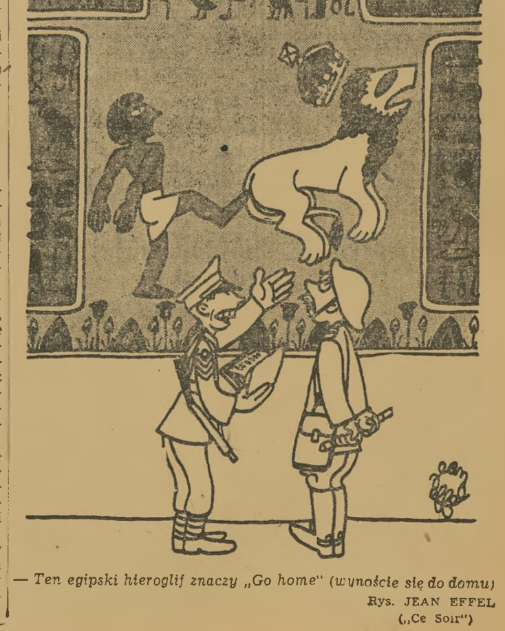
Ten egipski hieroglify znaczy „Go home“ (wznioście się do domu) Rys. JEAN EFFEL