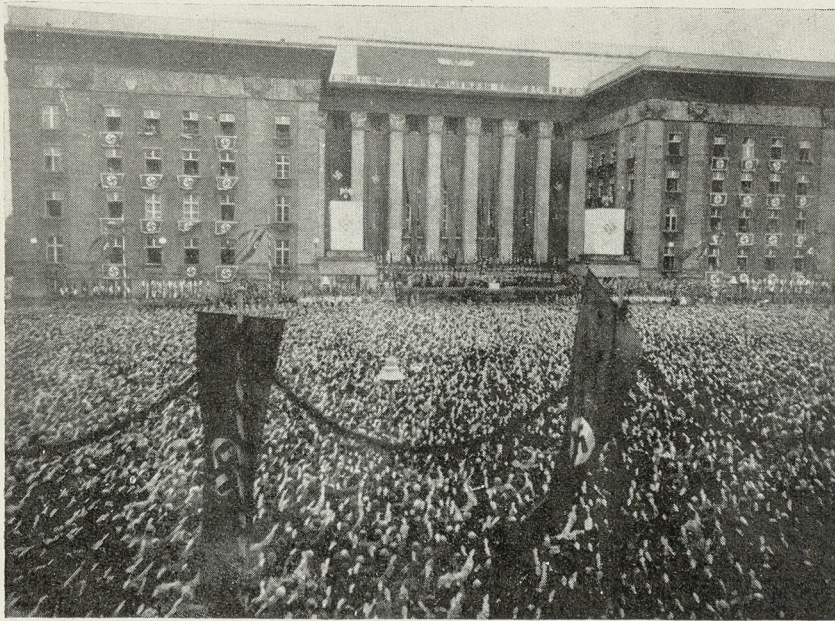
Kundgebung am 1. September 1940 mit Dr. Goebbels in Kattowitz