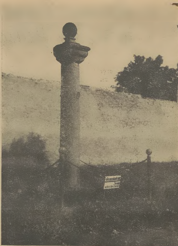
Staupsäule in Grüssau

An die gutsherrliche Gerichtsbarkeit, die das Kloster Grüssau, von dem einst die Kolonisation des Riesengebirges ausgegangen ist, über das Klostergebiet besaß, erinnerte ferner noch eine Staupsäule. An der Straße Grüssau-Friedland erhob sich vor dem Prälatentor des Konventsgebäudes der Pranger als Zeuge mittelalterlichen Rechts. An die Säule angekettet stand der Übeltäter zum Gespött von Jung und Alt seine Strafe ab. Hier erhielt er vor versammelter Gemeinde vom Büttel die Rutenschläge zuerteilt, die das Klostergericht festgesetzt hatte.