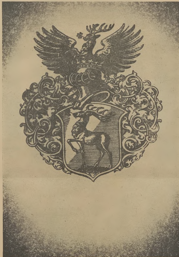
Das Hirschberger Wappen

Als im Verlaufe der deutschen Wiederbesiedlung Schlesiens vor rund 700 Jahren die Städte in unserer Heimat gegründet und zu deutschem Recht angesetzt wurden, war bereits das Urkundenwesen und Schreibwerk in langsamem aber stetigem und bald immer stärker anwachsendem Fortschreiten begriffen und infolge der rechtlichen und politischen Einrichtungen eine Notwendigkeit. Auch eine Stadt