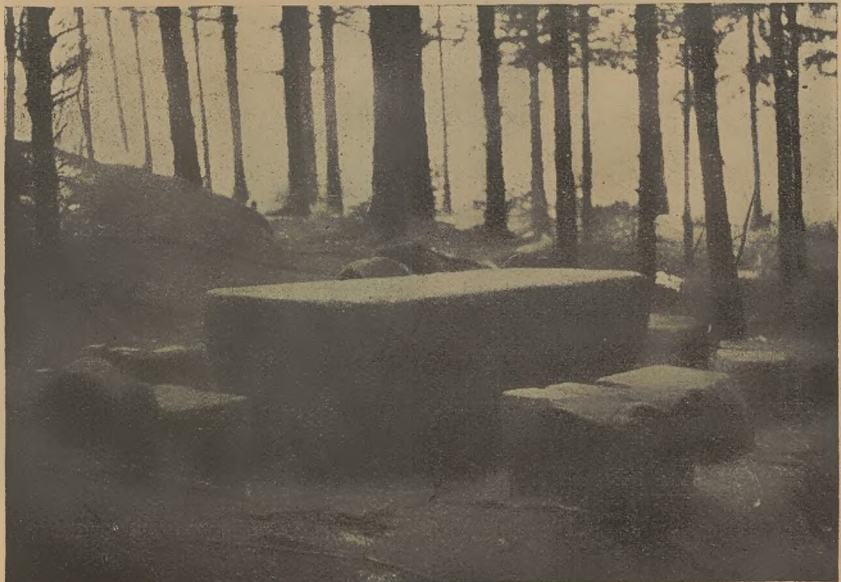
Gerichtstisch bei Trautliebersdorf