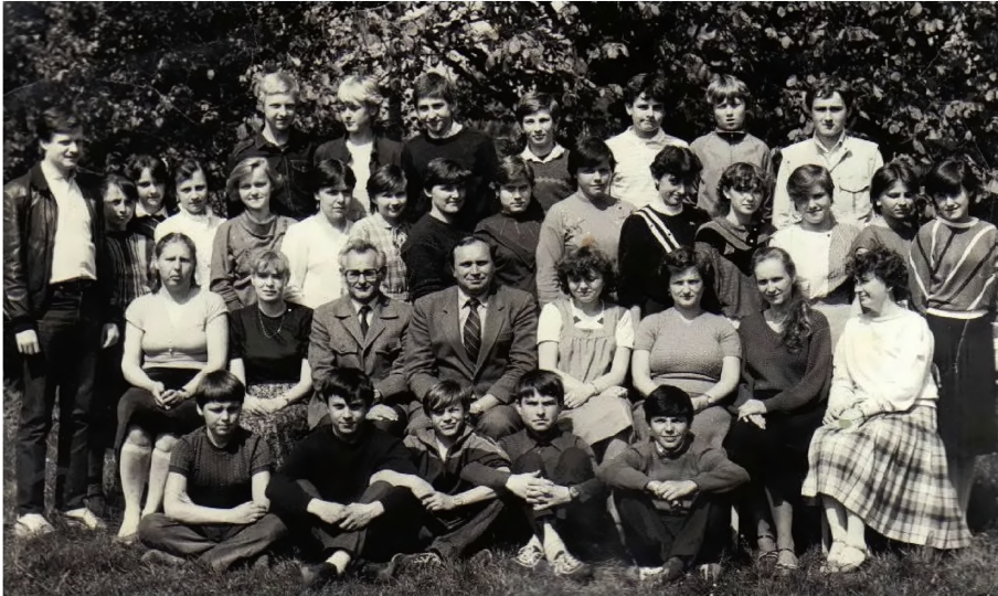
20. Absolwenci szkoły rocznika 1971