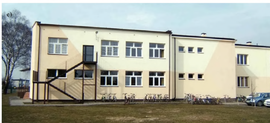
34. Budynek szkoły w Borowej Wsi obecnie a) Widok od zachodu na skrzydło z 1939 r., b) widok od wschodu na łącznik z 1993 r., c) widok od południowego-wschodu Fot. Przemysław Noparlić