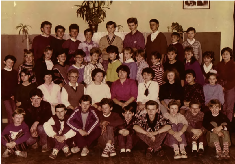
24. Absolwenci szkoły w Borowej Wsi w 1990 r. z nauczycielami