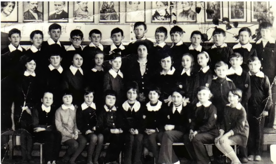
21. Uczniowie rocznika 1961 w roku szkolnym 1972/73