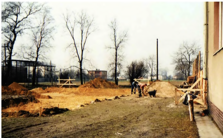
27. Budowa sali gimnastycznej (marzec 1993 r.)