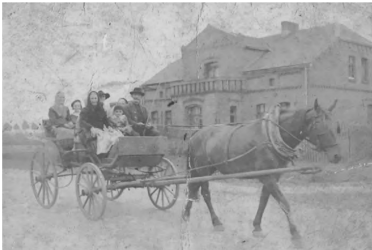
5. Ulica Gliwicka w początkach XX w.

W 1824 r. Borową Wieś przecięła, jedna z pierwszych na Śląsku, szosa prowincjonalna, czyli bita droga z kamieni. Prowadziła wzdłuż dawnej drogi z Wrocławia przez Gliwice, Mikołów i Oświęcim do Krakowa. Od tego czasu do połowy XIX w. był to główny szlak komunikacyjny w tej części Śląska. Jego rola spadała wraz z rozwojem kolei żelaznej, która połączyła Wrocław z Krakowem w 1847 r., zaś ponownie wzrosła w XX w. po uruchomieniu komunikacji autobusowej 113 . Asfalt na niej położono jeszcze przed wojną. W 1961 r. drogę poszerzono, przez co znacznie nasilił się ruch samochodowy 114 .