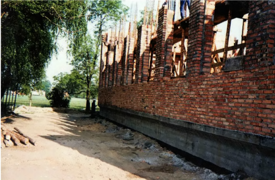
28. Budowa sali gimnastycznej (maj 1993 r.)