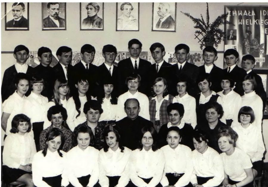
19. Uczniowie szkoły w roku szkolnym 1969/70