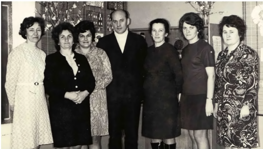
22. Grono Pedagogiczne w roku 1972/73