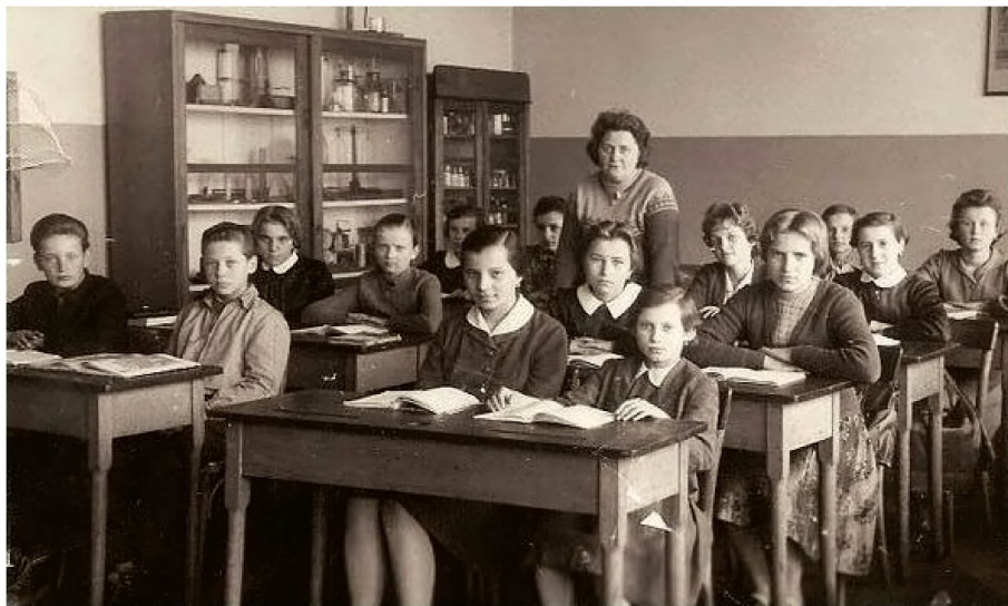
16. Uczniowie szkoły w roku 1959/1960