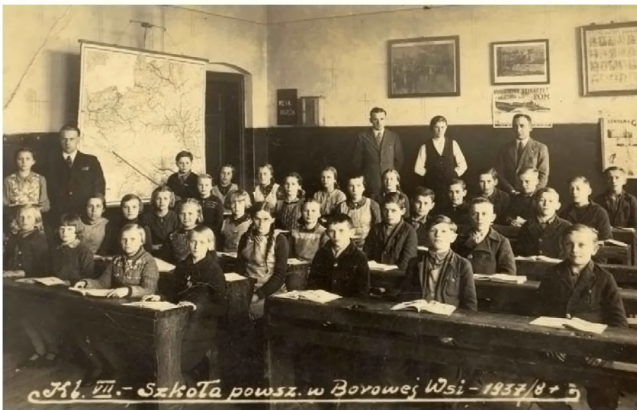
3. Uczniowie klasy VII w roku 1937/39 w starym budynku szkoły