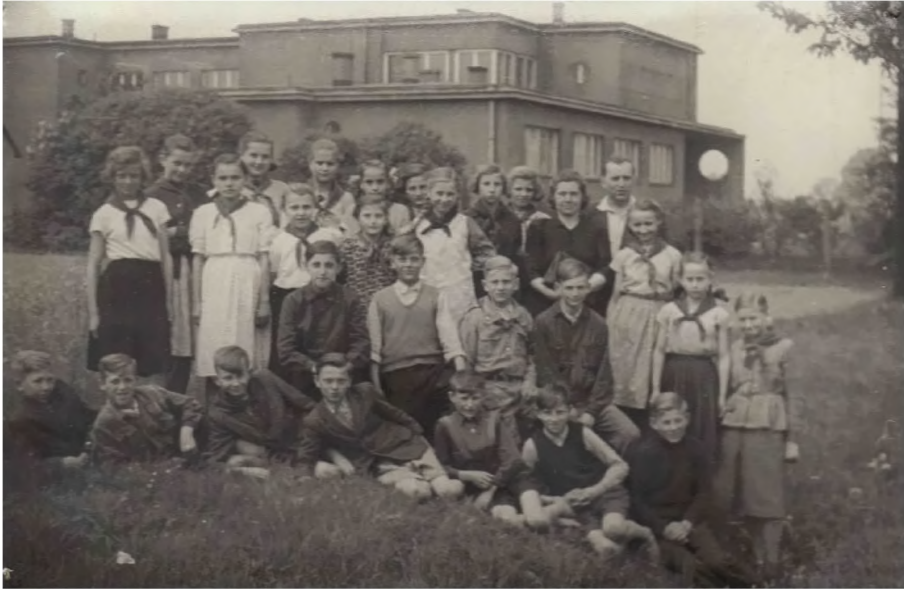
12. Świetlica szkolna w roku szkolnym 1953/54 Ze zbioru Archiwum Zespołu Szkół nr 2 w Mikołowie-Borowej Wsi