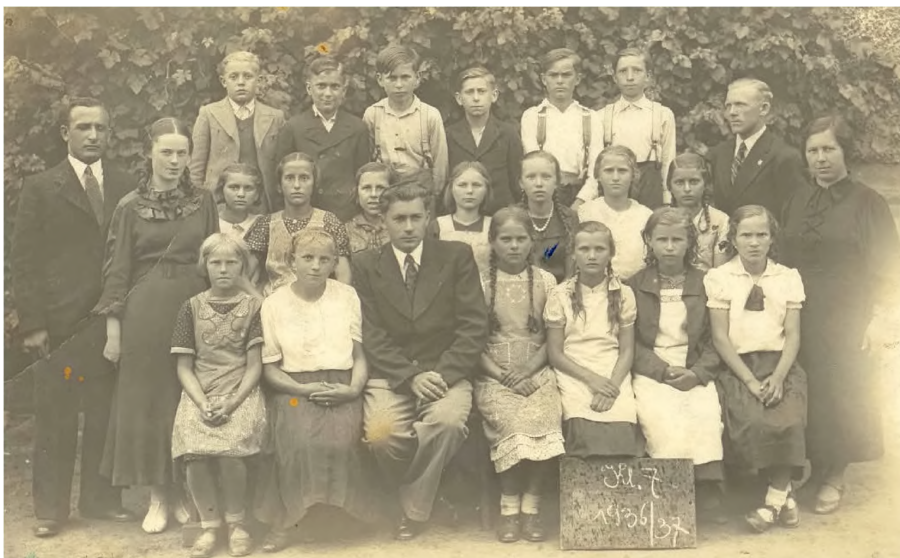
5. Uczniowie klasy VII w roku szkolnym 1936/37