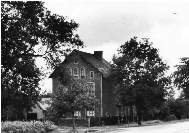
9. Budynek starej szkoły w Borowej Wsi (obecnie przedszkole)

Liczne wpisy w kronice szkolnej na temat budynku dają jego pełny obraz. Do początku lat trzydziestych XX w. szkoła posiadała dwie sale lekcyjne. Trzecią wykończono na piętrze w 1932 r. Mimo to pomieszczenia te były za małe i trudne do ogrzania 25 . W końcu tej dekady powstała czwarta sala lekcyjna, którą uzyskano, adaptując na ten cel pomieszczenia gospodarcze i mieszkanie nauczyciela 26 .