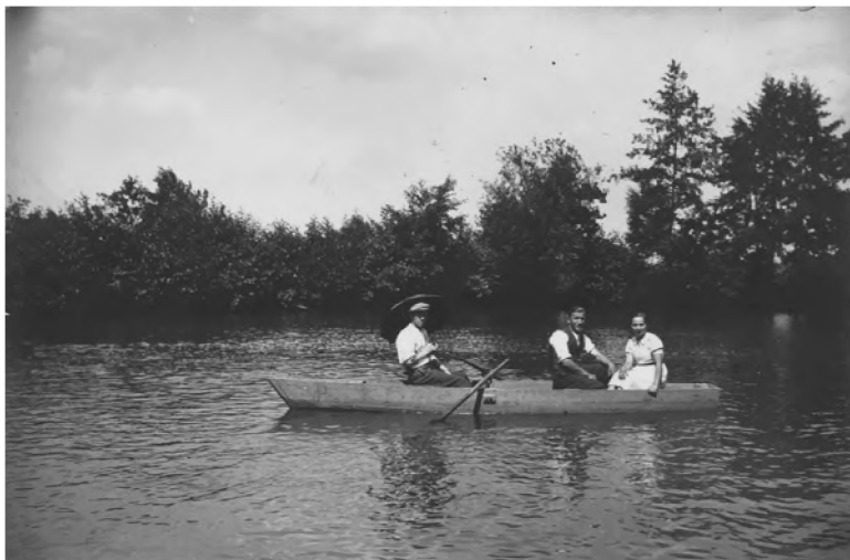
4. Zbiornik wodny przy dawnej gospodzie

rodzina Marcol, która przybyła tu z przyznanych wówczas Niemcom Gliwic 55 . Wcześniej w kronice szkolnej kilkakrotnie jest mowa o gospodzie Dyllusa (niem. Dylluse'schen Gasthaus ) 56 .