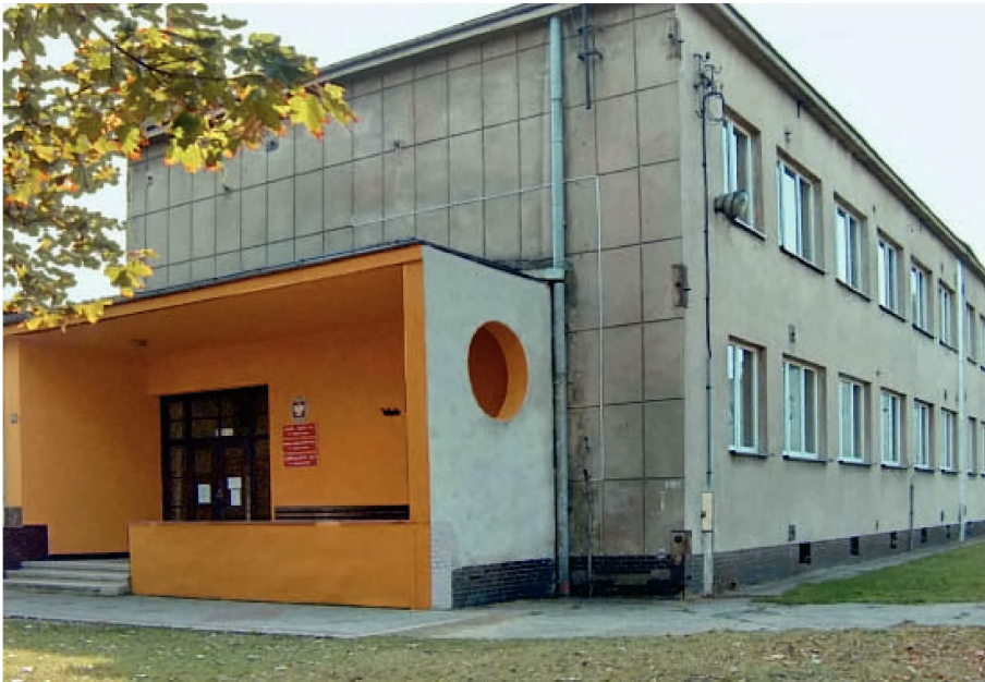
33. Budynek szkoły z 1939 r. w końcu XX w.