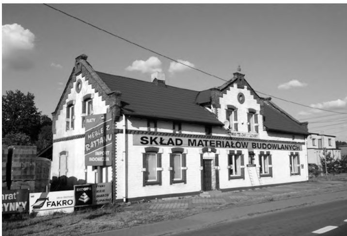
2. Budynek dawnej karczmy – tzw. Nowej Wygody (stan obecny)

U progu XX w. wzniesiono stojący do dziś budynek nowej karczmy nazwany Nową Wygodą . Postawiono go kilkaset metrów na wschód od Starej Wygody, po północno-zachodniej stronie skrzyżowania obecnych ulic Gliwickiej i Mariana Buczka. Jest to piętrowy obiekt, wykonany z cegły, przykryty dwuspadowym dachem. Jego istnienie oraz funkcję potwierdzają mapy z początku XX w. 43