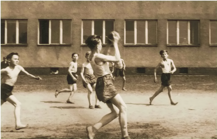
7. Lekcja wychowania fizycznego na placu szkoły (lata czterdzieste XX wieku)