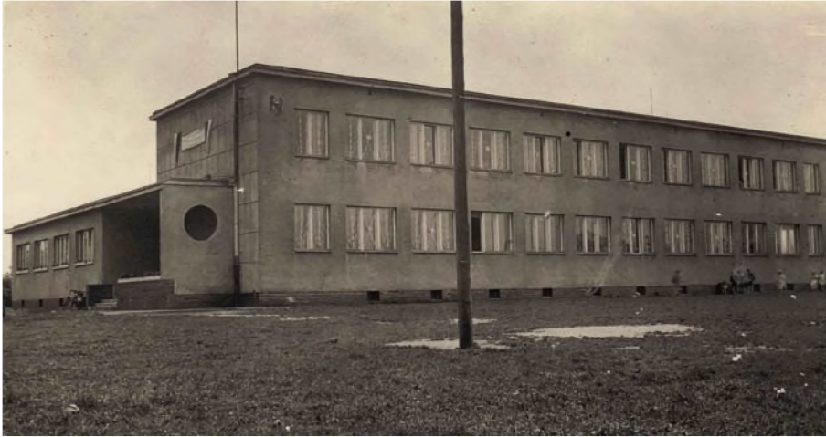
32. Budynek szkoły z 1939 r. w połowie XX w. Widok od zachodu