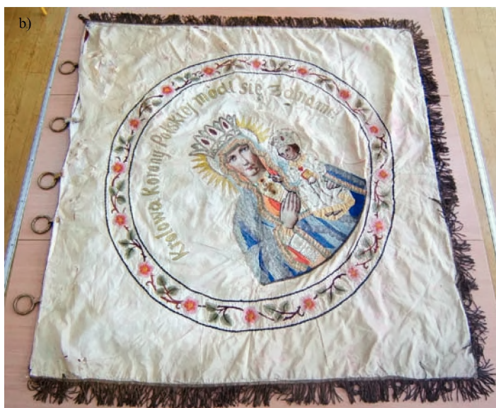
35. Sztandar Zjednoczenia Zawodowego Polskiego z 1922 r. a) awers, b) rewers