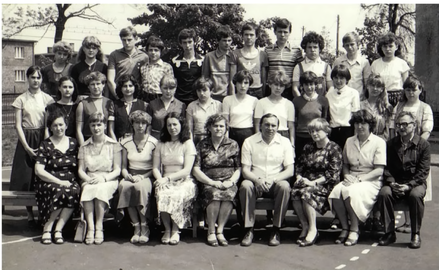
23. Absolwenci szkoły w Borowej Wsi w 1983 r.