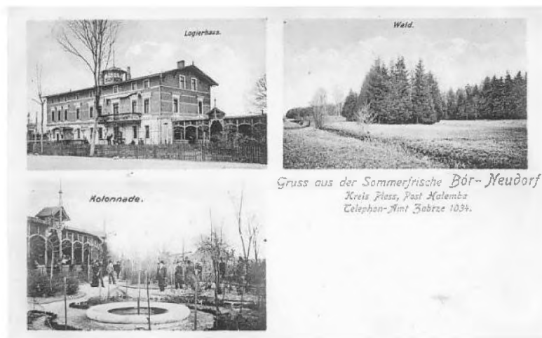
3. Pocztówka z początku XX w. ukazująca dawną gospodę

Mimo to nadal na początku XX stulecia wielu mieszkańców utrzymywało się z rolnictwa. W 1913 r. w Borowej Wsi przeprowadzono spis rolny. Mieszkańcy w 98 zagrodach posiadali 27 koni, 162 sztuki rogacizny, 107 świń i 49 kóz. Poza tym w 80 ogrodach naliczono 706 drzew owocowych 52 .