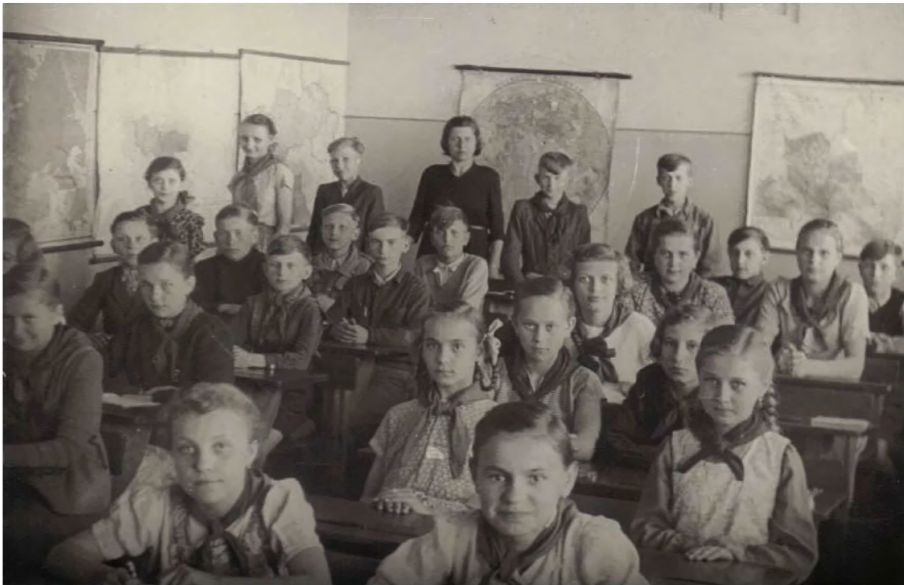
13. Uczniowie szkoły w Borowej Wsi w roku szkolnym 1953/54