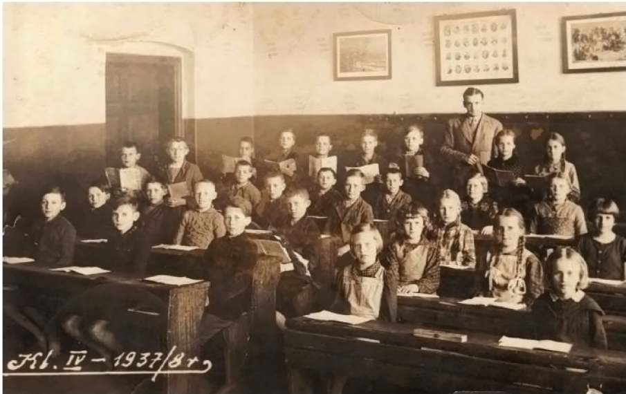
2. Uczniowie klasy IV w roku 1937/39 w starym budynku szkoły