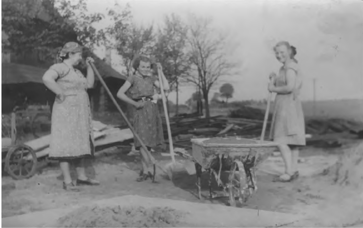
8. Składanie kościoła z Przyszwic w Borowej Wsi (1937 r.)

Sporna jest data powstania świątyni. Do niedawna, mimo wątpliwości, przyjmowano rok 1720 za datę budowy kościoła 29 . Nowsze ustalenia przesuwają to wydarzenie do 1640 r. 30