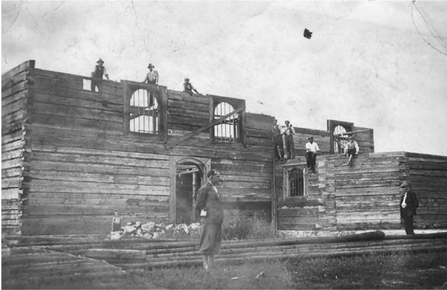
7. Składanie kościoła z Przyszowic w Borowej Wsi (1937 r.)

przetrwiał nienaruszony i do dnia dzisiejszego służy mieszkańcom. 20 grudnia 1957 r. w Borowej Wsi erygowano samodzielną parafię.