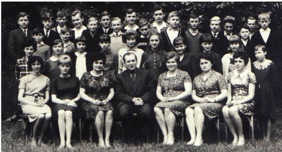
18. Klasa VII wraz z gronem pedagogicznym (rok 1965/66)