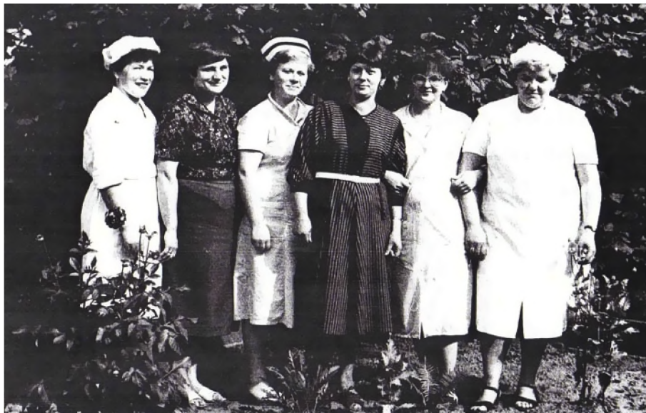
26. Personel szkoły w Borowej Wsi (około 1986 r.)