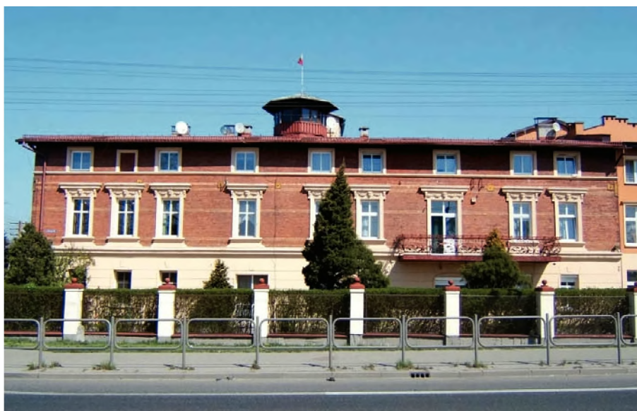
31. Budynek obecnego Ośrodka „Miłosierdzie Boże” Pierwotnie budynek mieścił zajazd (niem. Gasthaus). W latach trzydziestych XX wieku szkoła wynajmo- wała tu kilka pomieszczeń na dodatkowe sale lekcyjne