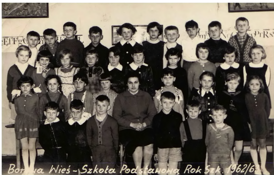
17. Uczniowie szkoły w roku 1962/63