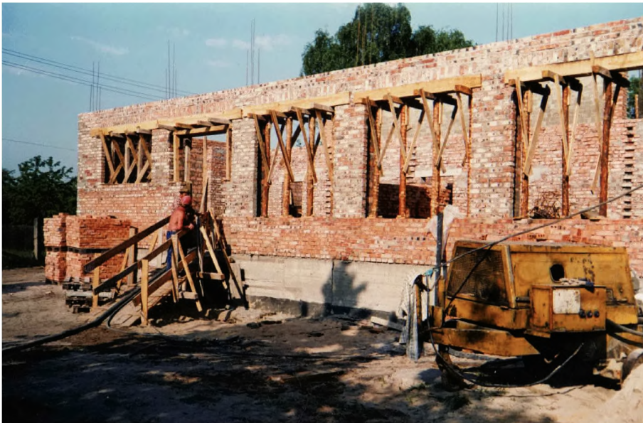
29. Budowa sali gimnastycznej (maj 1993 r.)