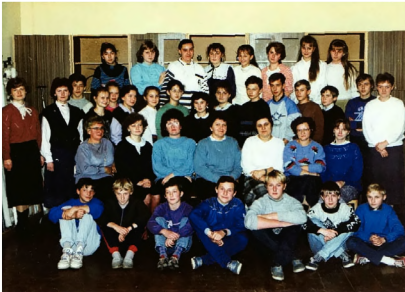
25. Absolwenci szkoły w Borowej Wsi w 1991 r. z nauczycielami