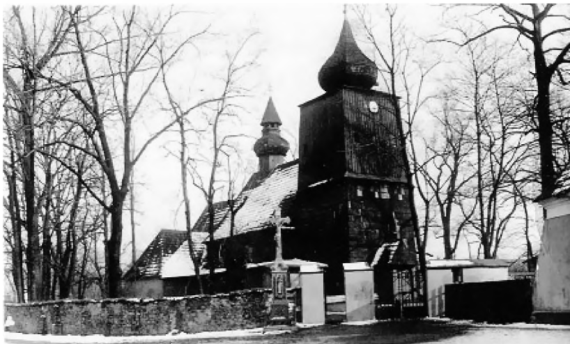
6. Kościół drewniany pw. św. Mikołaja w Przyszowicach przed 1937 r.

w Paniówkach przecinała powiat bytomski, a kończyła się w powiecie gliwicko-toszeckim. Sprawa ta wymaga odrębnego zbadania.