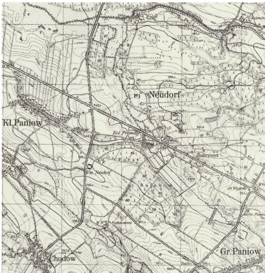
1. Obszar Borowej Wsi (niem. Neudorf) w 1940 r.