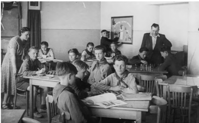
10. Świetlica szkolna w roku szkolnym 1953/54

kwalifikacyjny od IV klasy 33 . W 1955 r. zorganizowano zjazd absolwentów szkoły, połączony z wystawą jej dorobku po 1945 r. Z imprezy tej zachowało się kilka zdjęć 34 .