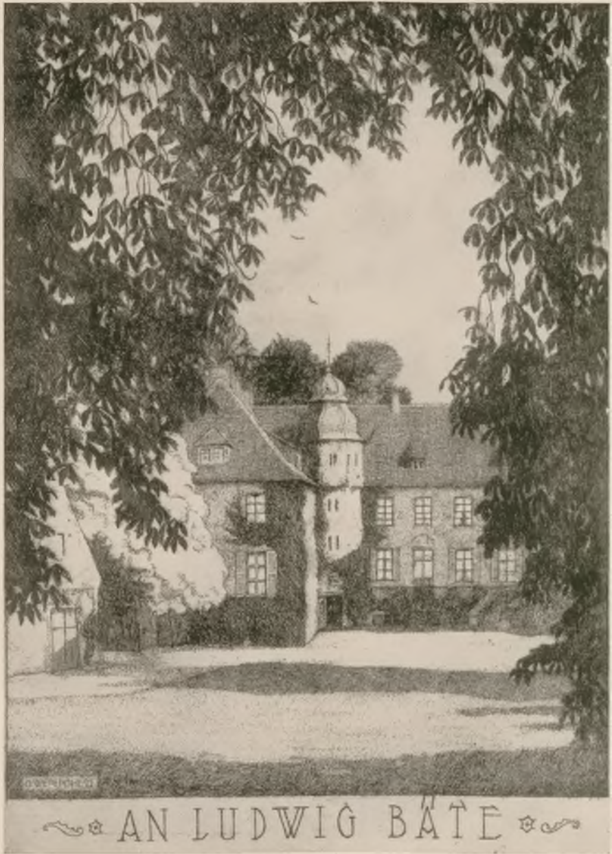
Radierung von G. Webeppel