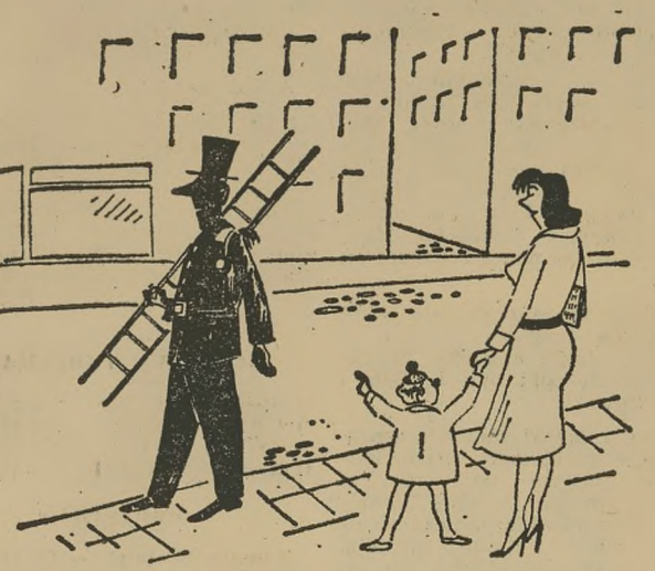
Ten pan pewno nie wie, że jest miesiąc czystości.