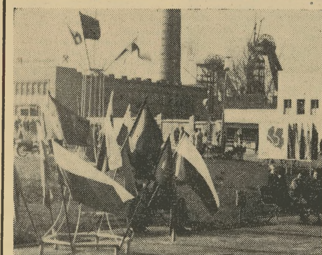
Już na kilka dni przed Majowym Świętem, parki, skwery, place zabaw, ulice, domy przybrały uroczysty i radosny wygląd. Rozkwitły barwami flag narodowych, kłombami kwiatów, pięknymi, nieraz bardzo oryginalnymi dekoracjami. I taki też wygląd przybrało centralne miejsce spotkań mieszkańców Klimontowa.

A oto ważniejsze imprezy bedzińskie w dniu 1 maja: godz. 11.30 — stadion „Stali” — mecz piłki nożnej (w przerwie podnoszenie ciężarów), godz. 15 — wyścig kolarski ulicami miasta, godzina 18 — zabawa młodzieżowa