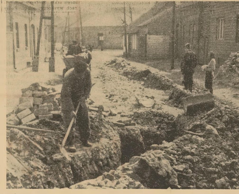
Osrodek Zdrowia w Koziegłowach to melodia najbliższej przyszłości. Co prawda prace przy jego budowie są już mocno zaawansowane, ale nie należy się spodziewać aby w tym roku osrodek był oddany do użytku.

W międzyczasie jednak władze miejskie postanowiły wybudować dobrą drogę prowadzącą do osrodku. Na ulicy Czestochowskiej rozpoczęto już prace, zakłada się tu obecnie kanalizację, a w lecie ekipy robocze przystąpią do wylewania asfaltu.