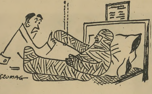
I wtedy zobaczyłem latające talerze.