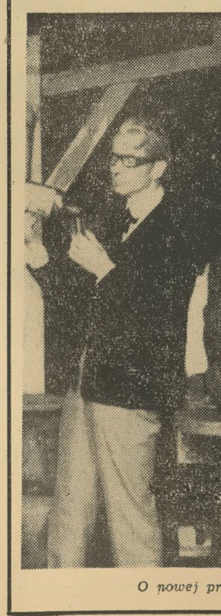
O nowej premierze w PTZ piszemy na str. 4.