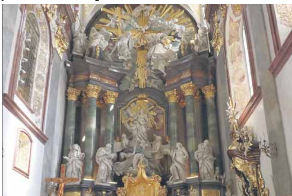
Ołtarz główny w kościele klasztornym na Jasnej Górze, dzieło śląskich artystów z lat 1728-31.