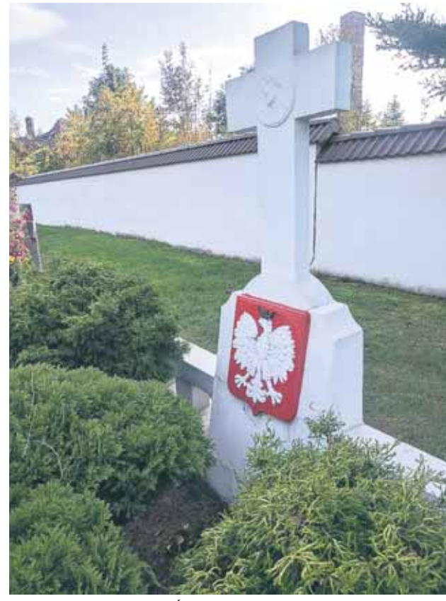
Na cmentarzu w Chełmie Śl. odnawiane są 4 nagrobki

Od zeszłego roku Instytut Pamięci Narodowej finansuje i odnawia nagrobki powstańców śląskich. Również w Chełmie Śląskim trwa renowacja powstańczych grobów.