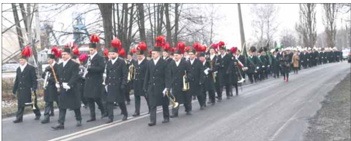
Barbórki w tym roku mają mieć charakter symboliczny

Polska Grupa Górnicza wydała zalecenia, aby tegoroczne obchody górniczego święta we wszystkich oddziałach i kopalniach spółki miały charakter symboliczny i ograniczały się do niezbędnego minimum. – Należy unikać organizowania wszelkich uroczystości barbórkowych charakteryzujących się przebywaniem w jednym miejscu i w tym