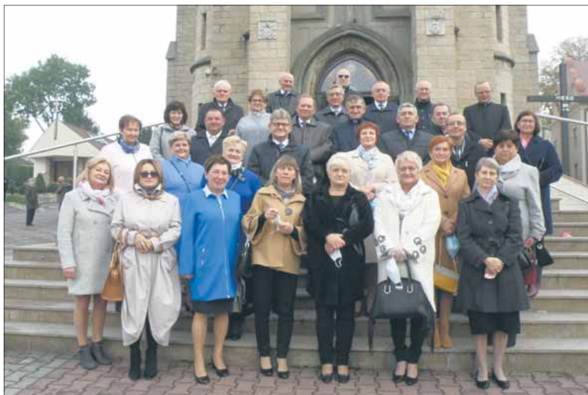
Solenizanci z rocznika 1960 spotykają się już od 30 lat

W niedzielę, 25 października wspólne urodziny świętowali tegoroczni 60-latkowie z Imielina.