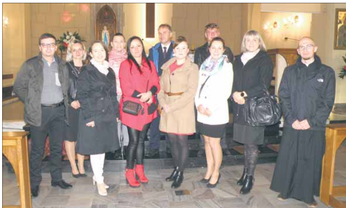
Huczne spotkanie klasowe nie doszło do skutku, ale część klasowych kolegów i koleżanek spotkało się na mszy św.

W sobotę, 24 października mieli spotkać się na klasowej imprezie imielińscy 35-latkowie. Okazja do świętowania była podwójna, bo mieli świętować urodziny i 20-lecie ukończenia szkoły podstawowej.