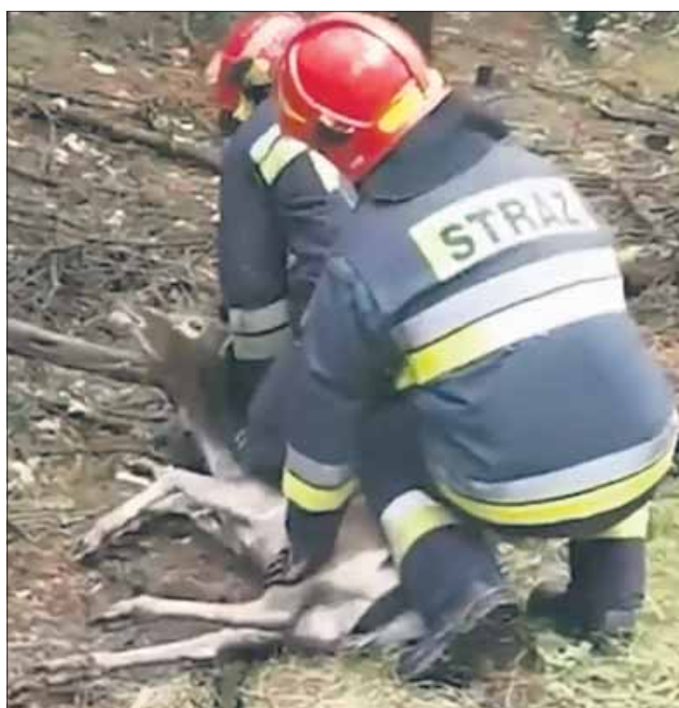
Strażacy zdołali pomóc zwierzęciu

Tym razem daniel miał wiele szczęścia, że spotkał na swojej drodze człowieka, który zachował się wzorowo i pomógł urato-