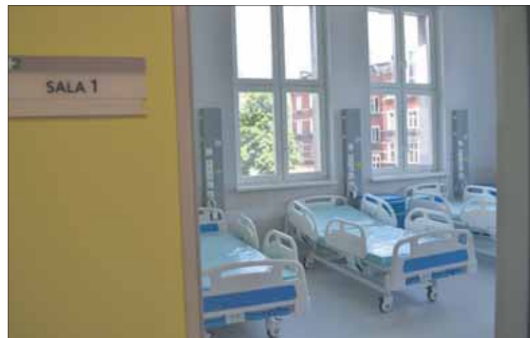
Oddział Chirurgii Ogólnej wznowił działalność w trybie ostrego dyżuru

Przyjęcia zostały wstrzymane do poniedziałku włącznie. Na Oddziale Chirurgii Ogólnej – zawieszono przyjęcia planowe jak i ostrodyżurowe, Oddział Chirurgii Urazowo-Ortopedycznej udziela konsultacji i przyjmuje w ramach ostrego dyżuru. – Oddział wewnętrzny – czekamy na wyniki naszej kadry – informuje szpital.