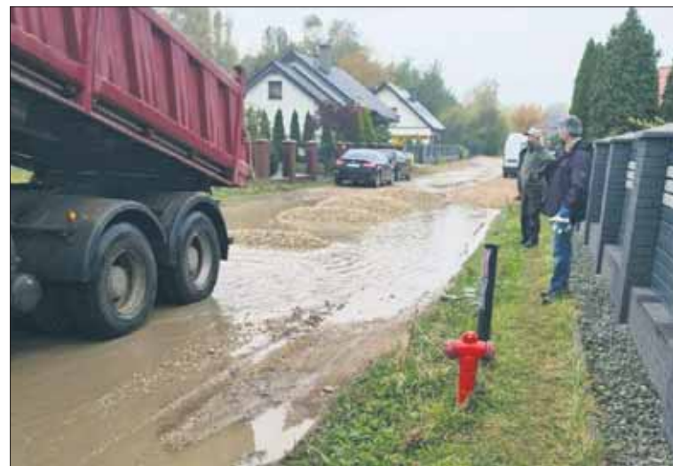
Mieszkańcy sami sfinansowali remont

Chodzi o drogę, o której pisaliśmy już niedawno – po deszczu tworzą się tam ogromne rozlewi-