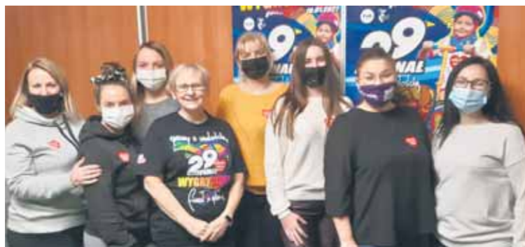
Wspólne pamiątkowe zdjęcie po przeliczeniu pieniędzy