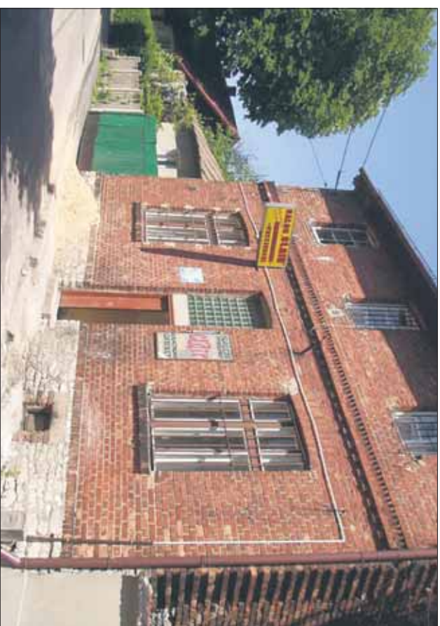
Budynek bożnicy i szkoły żydowskiej na ul. Sądowej (stan z 2003 r.)

W okresie międzywojennym społeczność żydowska na terenie ówczesnego Jaworzna stanowiła około 10 proc. populacji miasta. Nie była ona aż tak liczna jak w pobliskich miejscowościach, tak jak np. w Będzinie, w którego centrum starozakonnistawili około 70 proc. mieszkańców, w niczym nie zmienia to jednak faktu, że Żydzi w Jaworznie spotkać można było niemal na każdym kroku. Dzisiaj, w wyniku eksterminacji dokonanej przez Niemców w okresie II wojny światowej, niemal wszyscy przedstawiciele tejże społeczności zostali wymordowani. Pozostało po niej stosunkowo niewiele. Tym bardziej więc warto przypominać o tym co jednak przetrwało, w końcu ludzie ci przez wiele pokoleń stanowili integralną część żywej tkanki miasta Jaworzna.