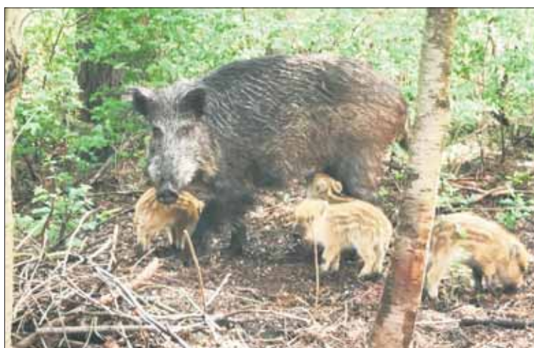
Odstrzałem mają zajmować się teraz wyłącznie koła łowieckie

– Proszę nie wnosić próśb o zlecenie firmom zewnętrznym odstrzału redukcyjnego dzików. Odstrzał nie należy do zadań miasta, jest to obowiązek kół myśliwskich, one są za to odpowiedzialne. Proszę o zwracanie się bezpośrednio do nich. Możemy udzielić informacji, gdzie są jakie obwo-