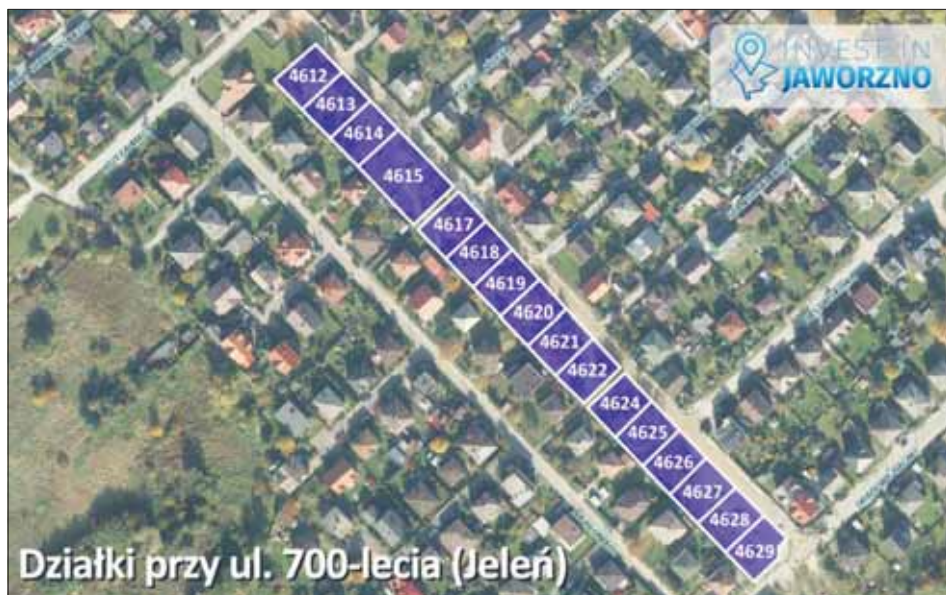
Działki przy ul. 700-lecia (Jeleń)

Miasto Jaworzno oferuje na sprzedaż kilkanaście działek budowlanych.