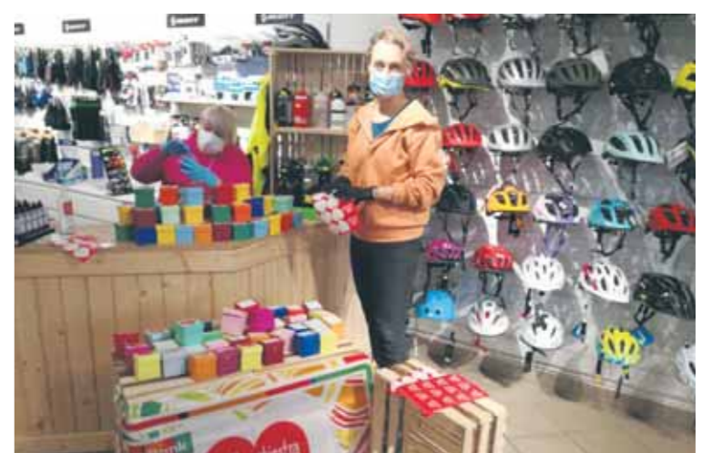
JAWOBIKE i przyjaciele pakują 200 orkiestrowych ciasteczek dla wolontariuszy