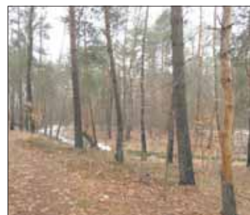
Kępnica w lesie

Las jako miejsce akcji specjalnie się nie zmienił. To przede wszystkim królestwo sosny zwyczajnej i dębu czerwonego. Sporą domieszkę sta- nowi tutaj brzoza brodawkowata. W cieniu sosen niższe piętro drze- wostanu stanowią świerki pospo-