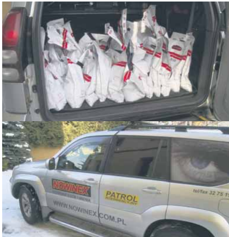
Zbrane pieniądze są transportowane w bezpiecznych kopertach