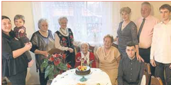
Solenizantka z najbliższymi

W jej życiu nie brakowało również trudnych momentów – bo jest pokoleciem wojny! Mając 17 lat – ze sfalszowaną datą urodzenia jako 18 latka – rozpoczęła pracę w tzw. „worku” – oddziale cementowni, gdzie pracowała do wybuchu II wojny światowej. Uchylając się od pracy na rzecz III Rzeszy, została aresztowana i osadzona w więzieniu w Mysłowicach (obecnie Areszt Śledczy), gdzie przebywała prawie rok. Stamtąd w roku 1941 przewieziono ją do przymusowej pracy w niemieckim gospodarstwie