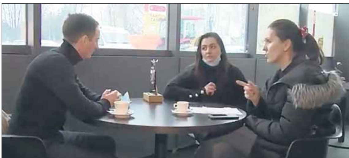
Otwarcie lokalu spotkało się z pozytywną reakcją wśród mieszkańców miasta