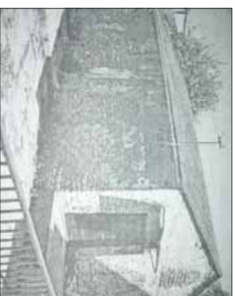
Bożnica przy ul. Stojatowskiego – stan 2003 rok

Natomiasz na dzisiejszej ulicy Sądowej znajdowała się synagoga, która zresztą istnieć do dnia dzisiejszego. Obecnie (od wielu już lat) znajduje się w budynku zakładu kominiarski. Przed wojną była to siedziba żydowskiego stowarzyszenia Mizrach, mieściła się tam również szkoła dla chłopców żydowskich. Funkcjonowała tam także synagoga własna. Na starym planie budynku widać zresztą wyraźnie podziół wewnętrzny na główną salę oraz galerię, czyli tę część, która przeznaczona była dla kobiet.