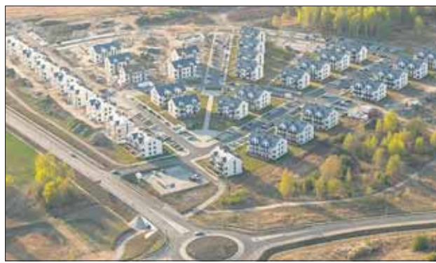
Trwają prace nad ukończeniem 63 mieszkań w ramach IV etapu inwestycji

Do ukończonych mieszkań niedawno na wynajem wprowadzili się już mieszkańcy. Tym razem, ze wzglę-