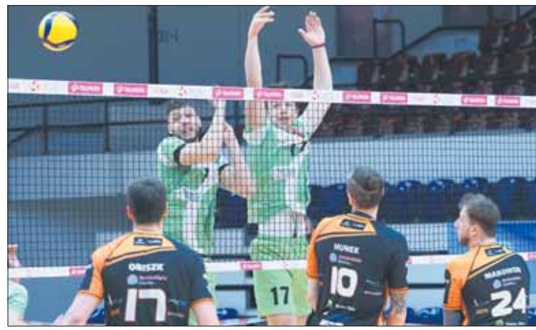
Jaworzniacka drużyna nieuchronnie zmierza do II ligi