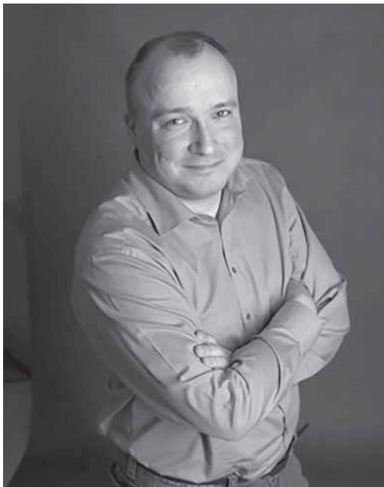
Autor artykułu Jarosław Sawiak

W Stronie Guermantes czytamy m.in., o śnie ołowianym. Pisze tam Proust, iż zadziwiającym jest fakt, że po przebudzeniu się z głębokiego snu, nawet jeżeli potrzebujemy dłuższej chwili, aby dojść do siebie, w końcu i tak stajemy się sobą, wskazujemy poniekąd w rzeczywistości samych siebie. Ciekawe jest zresztą i zastanawiające, że w języku polskim funkcjonuje wyrażenie dochodzić do siebie, daje wszak samo w sobie dużo do myślenia, tak jakby swista prawda ludowa chciała nam z uporczywością rutyny dowieść, że czasem, aby na powrót stać się sobą, trzeba przemierzyć nam jakąś nieznaną, dziwną i nieokreśloną podróż, która zaprowadzi nas w miejsce, w którym byliśmy jeszcze przed chwilą. Nie stajemy się kimś trzecim, czwartym, czy setnym, ale po prostu sobą. Wracamy do siebie, na miejsce. A przecież moglibyśmy stać się zupełnie kimś innym; odnajdujemy jednak swoje myśli, wspomnienia, zasoby wiedzy, słów i refleksji, odnajdujemy samego siebie. Stajemy się sobą. Nie jest się więc wówczas,