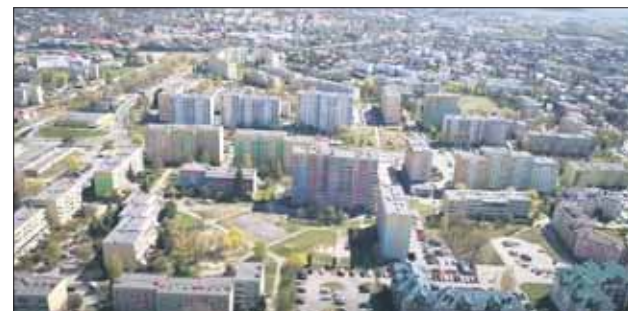
Prawie 58 proc. ludności Polski mieszka w blokach

Pan prezes uspokaja: – Bloki mają się dobrze, nawet można powiedzieć super dobrze. Związane to również jest z faktem, że na wielu terenach Jaworzna zostały za-