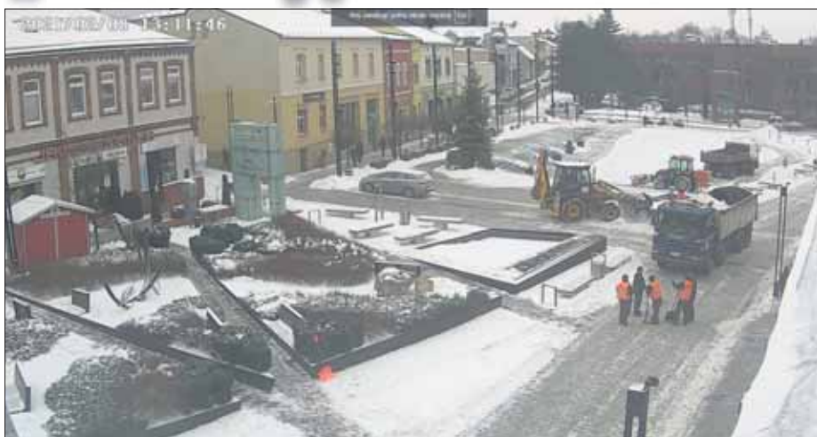
Poniedziałek 8 lutego. Najlepiej odśnieżane miejsce w mieście

Gratulujemy autorowi zdjęcia i zapraszamy po odbiór kuponu na pyszną pizzę dla dwóch osób z Pizzerii 2-ka.