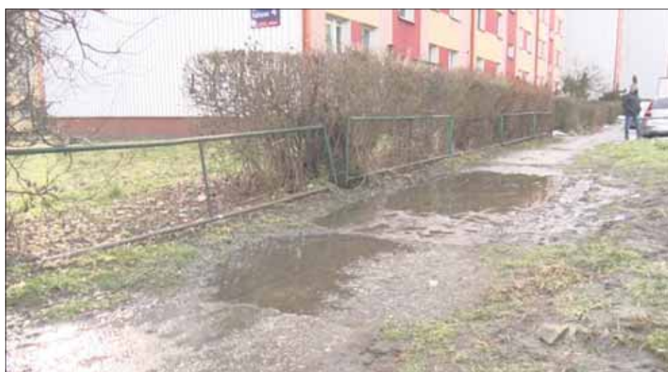
Kłopotliwa dziura w chodniku na Kalinowej