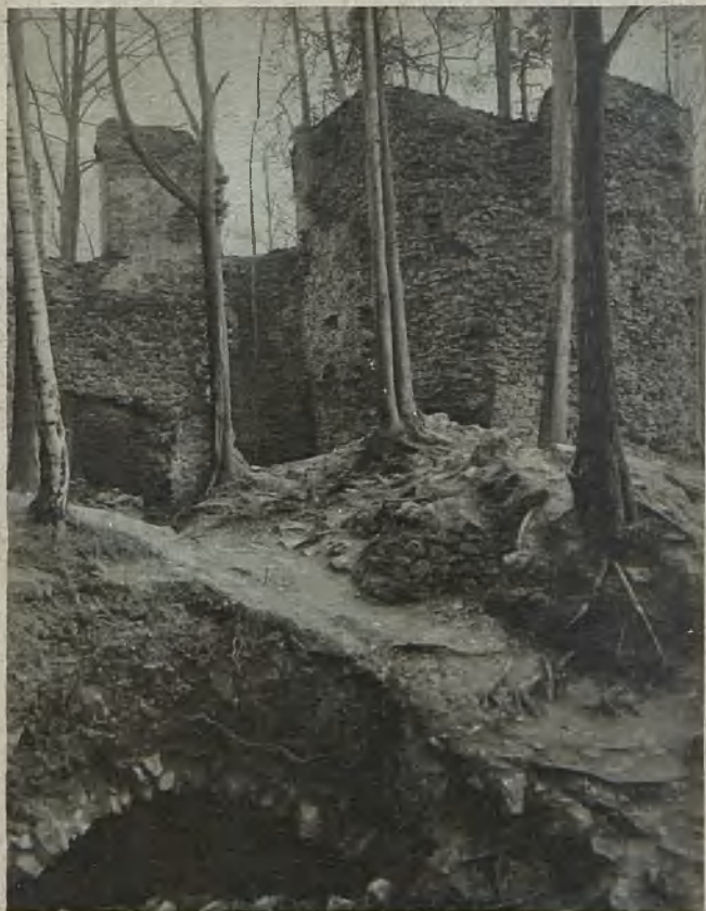
Ruinen der Zeisburg bei Freiburg Ruins of the Zeis Castle near Freiburg Zeisborgens ruiner vid Freiburg