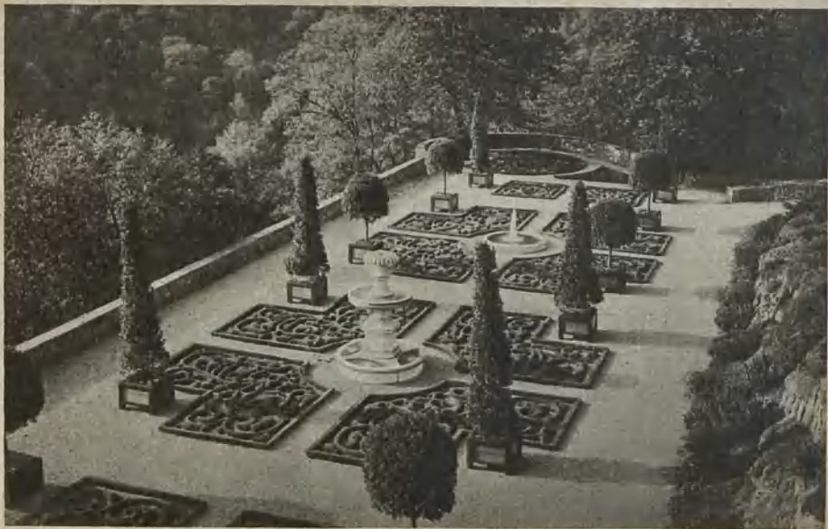
Westterrasse auf Schloß Fürstenstein Western terrace of the Fuerstenstein Palace Västterrassen på Slottet Fürstenstein