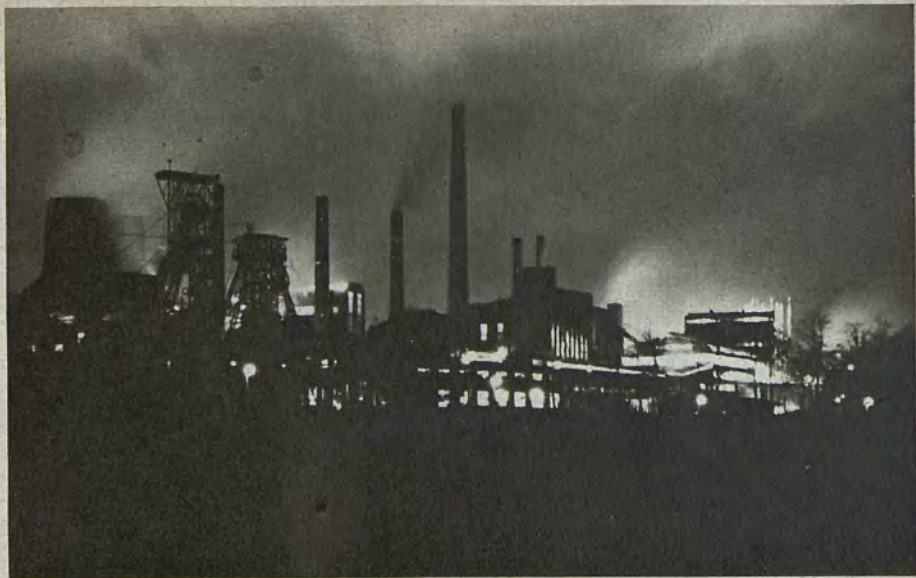
Waldenburger Steinkohlenbergwerk Waldenburg coal mines Stenkolsgruva i Waldenburgs bergland