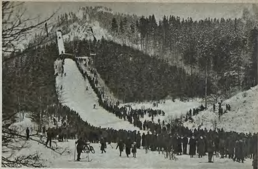
Görbersdorf, Freudengrundschanze (60 m) Goerbersdorf, the ski take-off at Freudengrund (60 m.) Görbersdorf, Glädjegrundskansen (60 m)