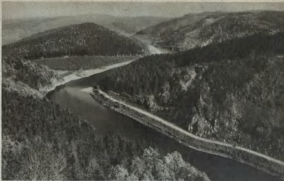
An der Schlesiertsperre Along the Silesian Valley Damm Vid Schlesierdalspärren