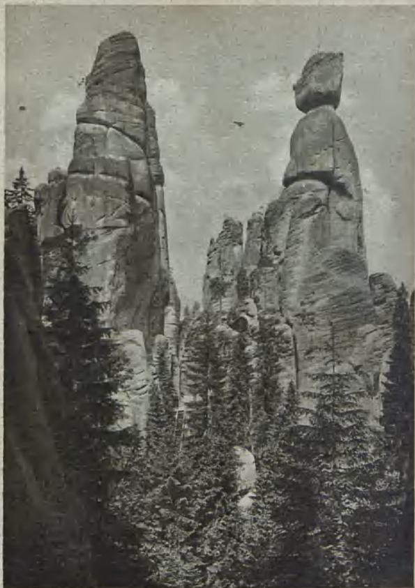
„Bürgermeister und Frau“ in Adersbach “Bürgermeister und Frau” at Adersbach Adersbachs »Borgmästare med fru»