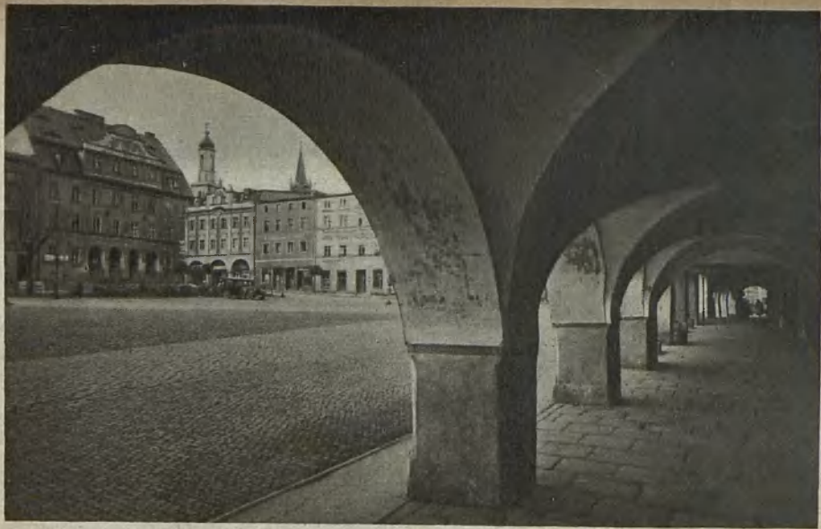
Lauben und Ring in Friedland Arcade and ring at Friedland Arkad och Ring i Friedland