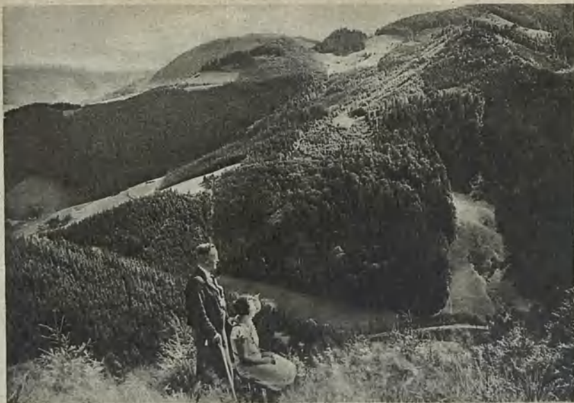
Bad Charlottenbrunn, Fürstenblick Bad Charlottenbrunn, Fürstenblick Badorten Charlottenbrunn, Fürsteblicken