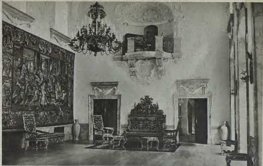
Schloß Fürstenstein, Conradsaal Fuerstenstein Palace, the Conrad Room Slottet Fürstenstein, Conradsalen