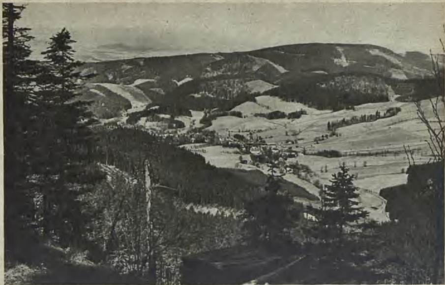
Görbersdorf, Blick von der Freudengrundschanze auf die Schneekoppe Goerbersdorf, view of the Schneekoppe taken from the ski take-off at Freudengrund Görbersdorf, blick från Glädjegrundskansen på Snöhättan (Schneekoppe)