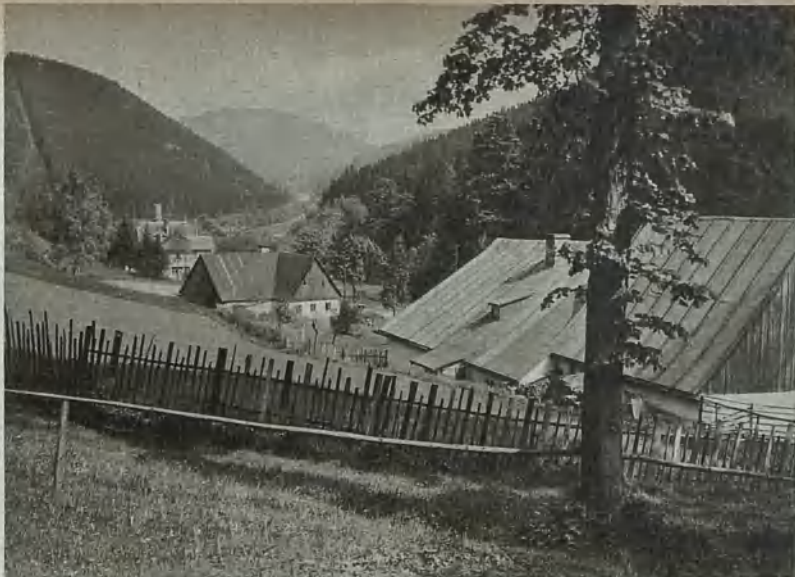
Blitzengrund im Waldenburger Bergland Blitzengrund in the Waldenburg Bergland Blixtgrunden i Waldenburger bergland