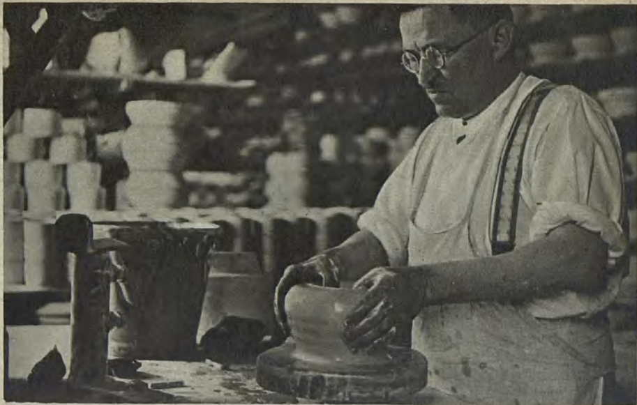
Waldenburger Porzellanindustrie, Dreher bei der Arbeit Waldenburg porcelaine industry, modellers at work Porslinsindustri i Waldenburg, svarvare vid sitt arbete