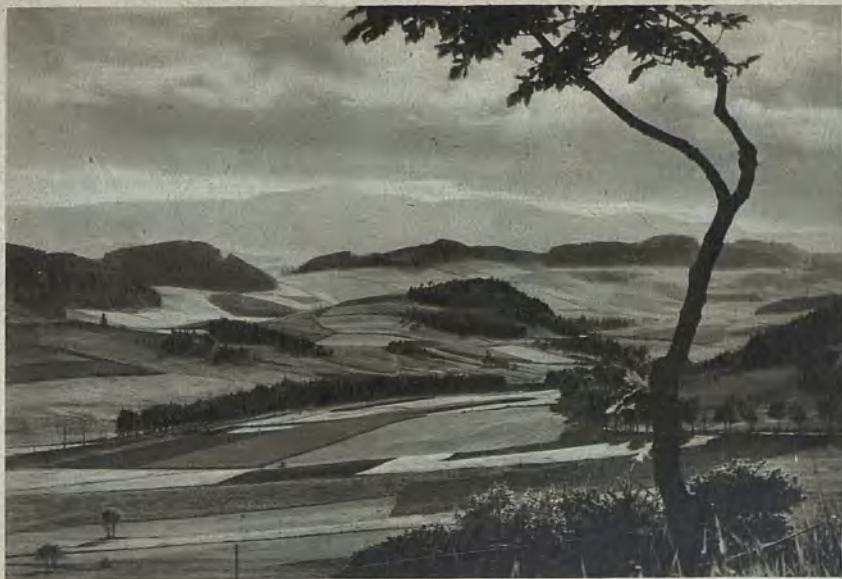
Blick von der Gottesberger Friedenshöhe auf das Riesengebirge View of the Riesengebirge taken from the Gottesberg Friedenshöhe Utsikt från Gottesberger Friedenshöhe över Riesengebirge