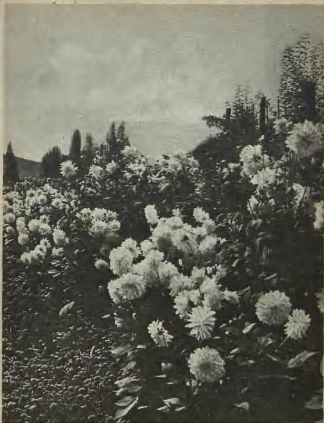
Inmitten der Blumenpracht der Gärtnerei Liebichau Amidst the floral grandeur of the Liebichau nursery I mitten av trädgårdsanläggningen Liebichaus blomsterprakt