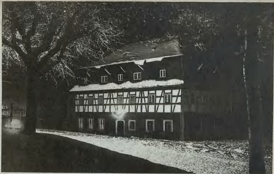
Alte Brauerei in Wüstegiersdorf Old brewery at Wüstegiersdorf Gammalt bryggeri i Wüstegiersdorf