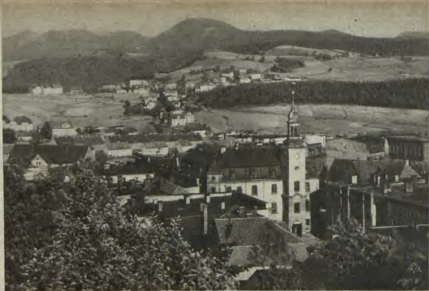
Blick auf Gottesberg View of Gottesberg Utsikt över Gottesberg