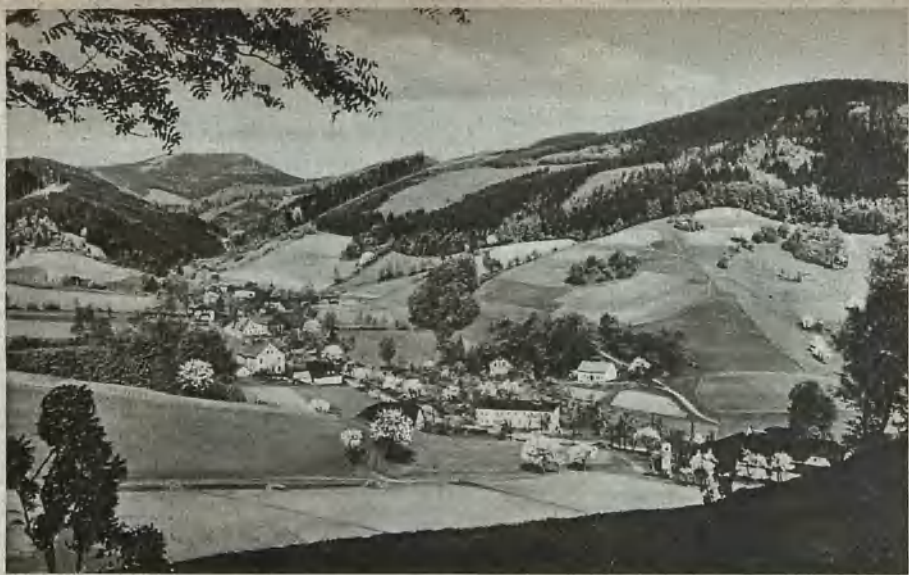
Blick über Lomnitz nach dem Hohen Heidelberg View across Lomnitz towards the "Hohen Heidelberg" Utsikt över Lomnitz till höga Heidelberget