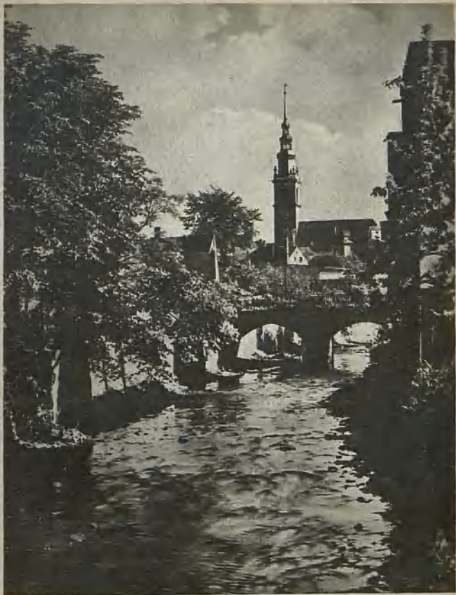
Freiburg, an der Polsnitz Freiburg, on the Polsnitz Freiburg, vid ån Polsnitz