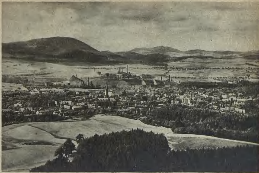
Blick auf Waldenburg mit dem Hochwald View of Waldenburg and the High Forest Utsikt över Waldenburg med storskogen