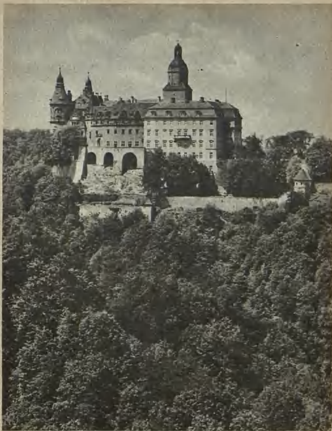
Schloß Fürstenstein Fuerstenstein Palace Slottet Fürstenstein