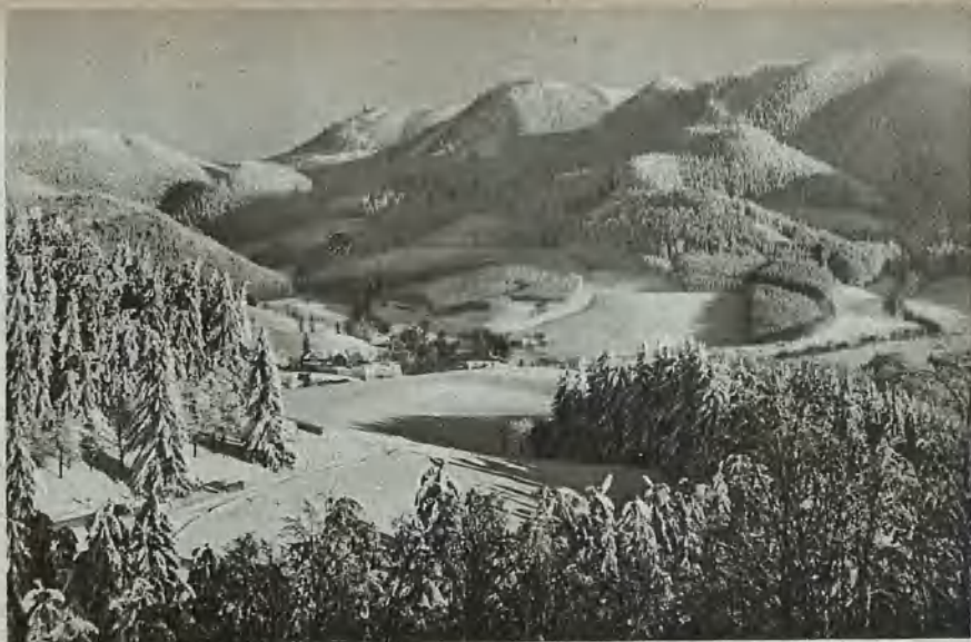
Görbersdorf im Rauhref Goerbersdorf in frost Görbersdorf i rimfrost