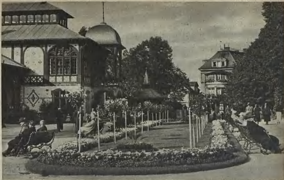
Kurpark in Bad Salzbrunn Kurpark at Bad Salzbrunn Kurpark i Badorten Salzbrunn