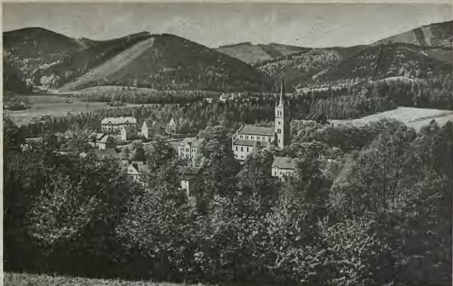
Blick auf Bad Charlottenbrunn View of Bad Charlottenbrunn Blick på badorten Charlottenbrunn