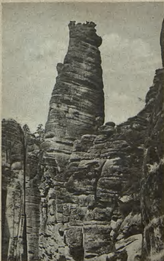
Wekelsdorfer Felsen bei Friedland, Felsenkrone Wekelsdorf Rocks near Friedland, Felsenkrone Wekelsdorf klippan vid Friedland, Felsenkrone