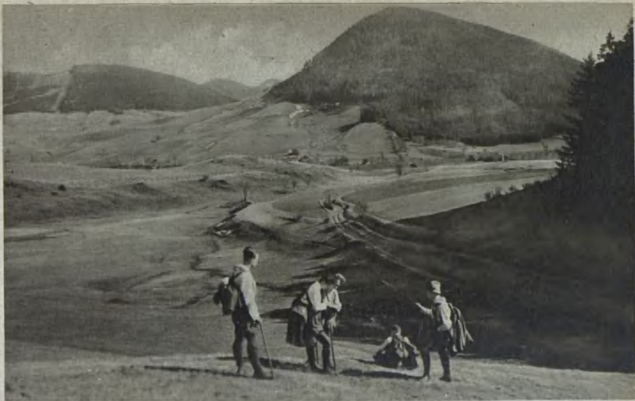
Blick auf den Storchberg View of the Storchberg Utsikt åt Storchberget