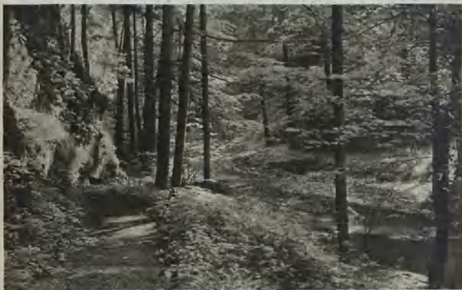
Schloß Fürstenstein, am Posttor, und Fürstensteiner Grund Fuerstenstein Palace, the Post Gate, and the Fuerstenstein Valley Slöttet Fürstenstein, vid Postporten, och Fürstensteiner Grund