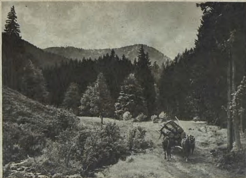
Blick auf den Heidelberg View of the Heidelberg Blick på Heidelberget