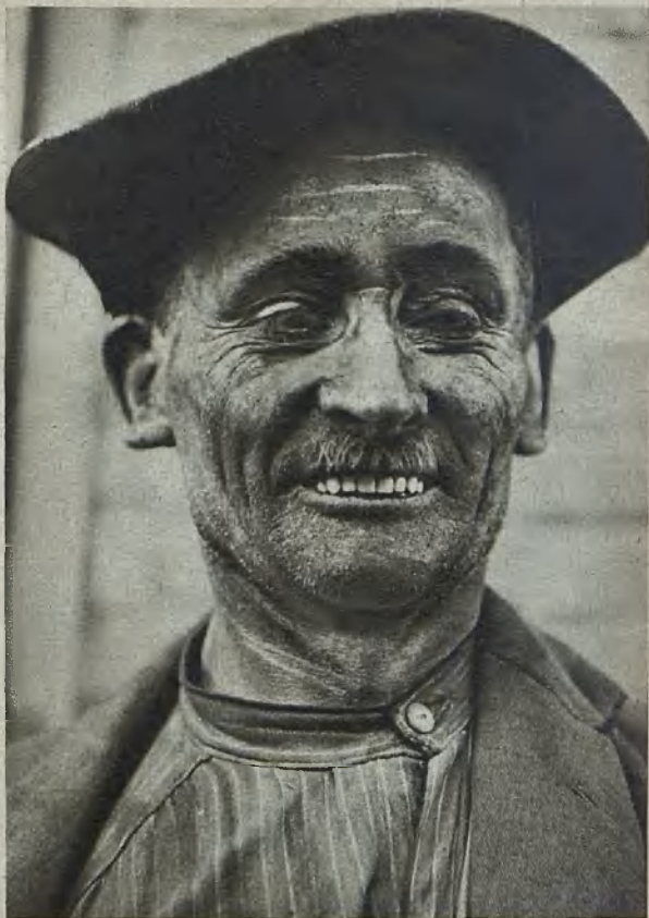
Kumpel aus dem Waldenburger Bergland Waldenburg Bergland mate Gruvarbetar från Waldenburgs bergland