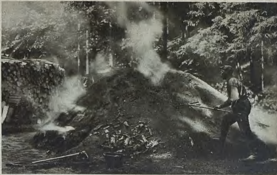
Holzkohlenmeiler im Waldenburger Bergland Charcoal pile in the Waldenburg Bergland Träkolsmåla i Waldenburgs bergland