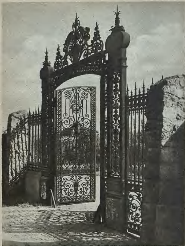
Eingang zur Gärtnerei Liebichau Entrance to the Liebichau nursery Ingång till trädgårdsanläggningen Liebichau