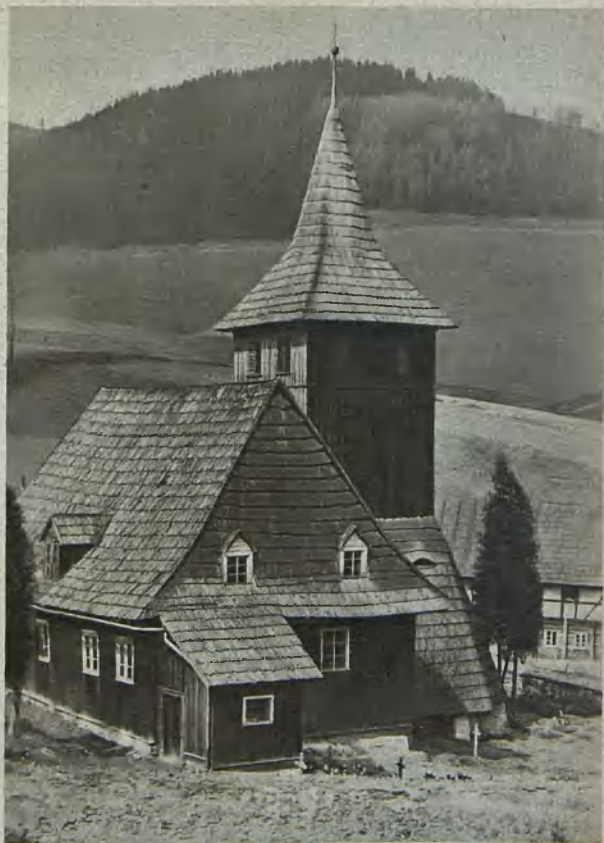
Schrotholzkirche in Donnerau Wooden church at Donnerau Träkyrka i Donnerau