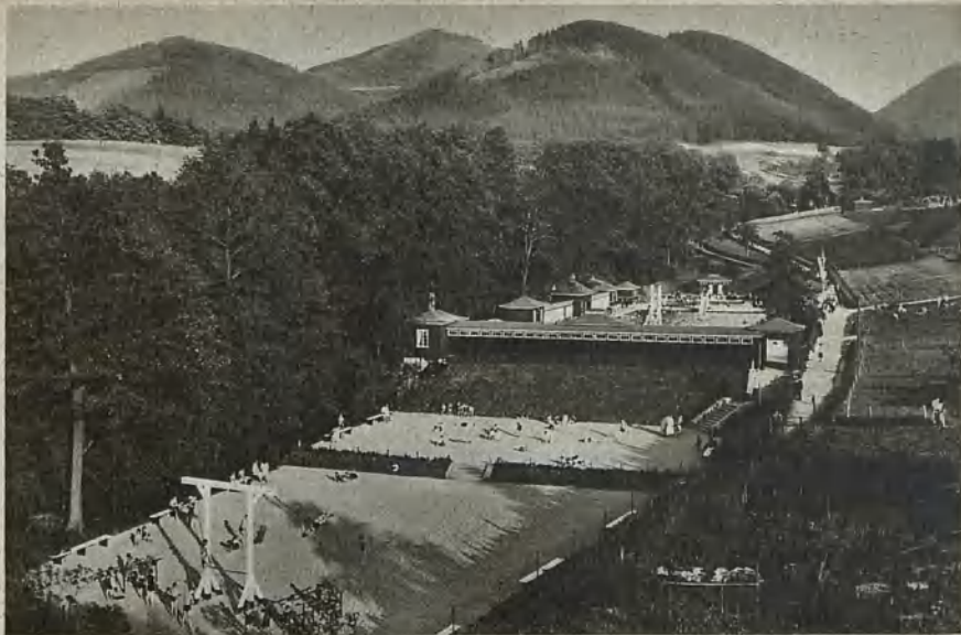
Waldenburg, Freibad in Neuhaus Waldenburg, public baths at Neuhaus Waldenburg, fribadet i Neuhaus