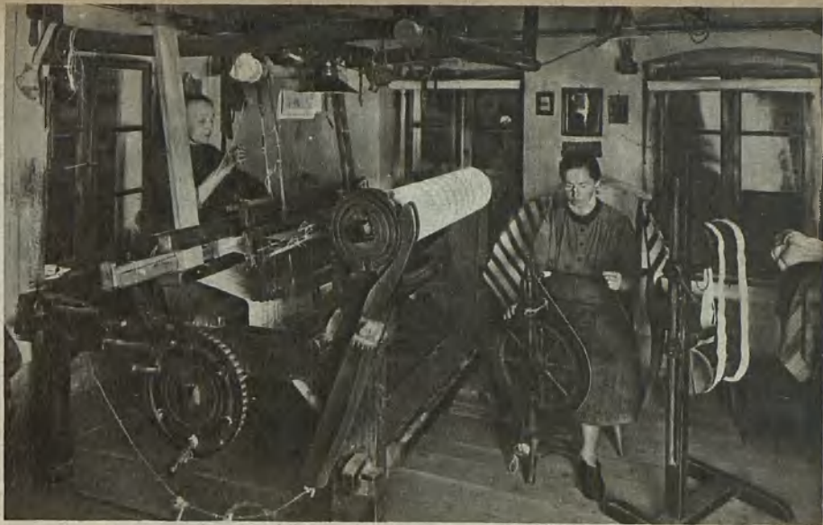
Hausweberinnen in Michelsdorf Home weaver at Michelsdorf Hemväverskor i Michelsdorf