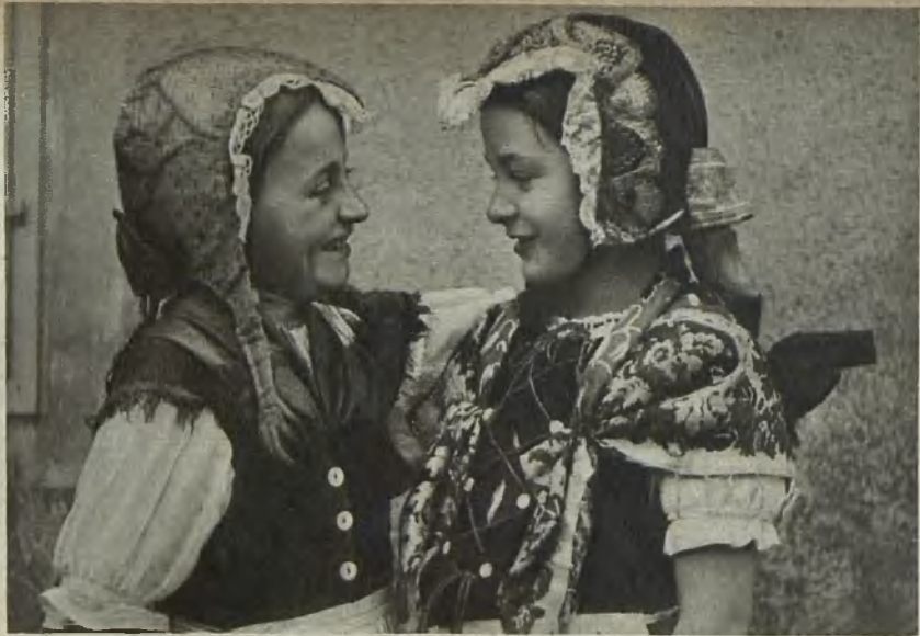
Alt-Waldenburger Trachten Old Waldenburg folk costumes Gamla folkdräkter från Waldenburg