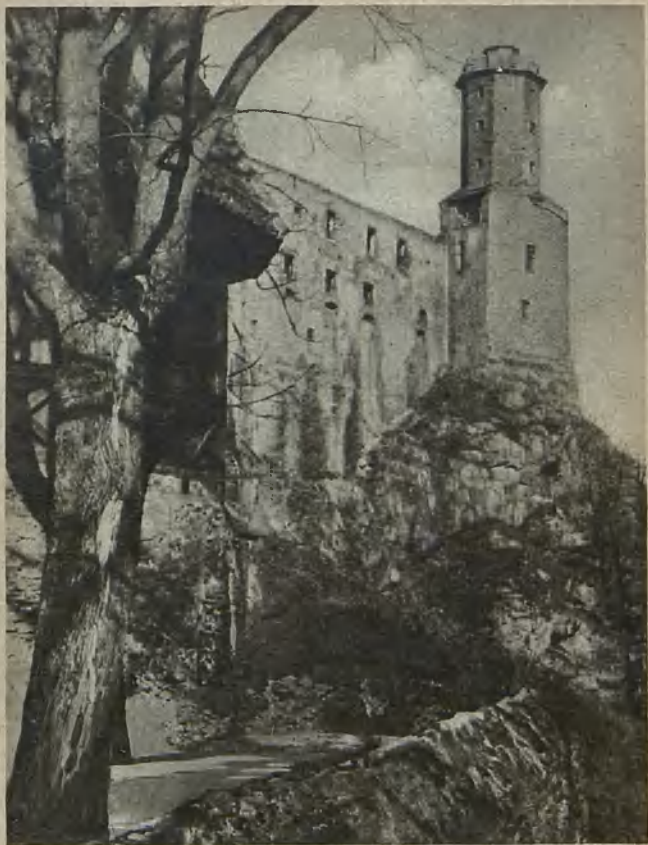
Die Kynsburg Kynsburg Kynsborgen