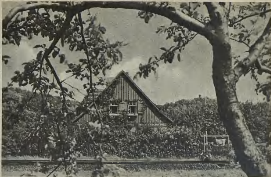
Präsident-Born-Baude (Jugendherberge) in Kynau President Born Hut (hostel for youths) at Kynau Präsident-Born-Baude (ungdomshärberge) i Kynau