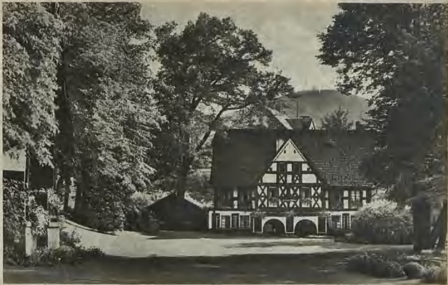
Das Wiesenhaus in Bad Salzbrunn The "Wiesenhaus" at Bad Salzbrunn Wiesenhaus i Badorten Salzbrunn