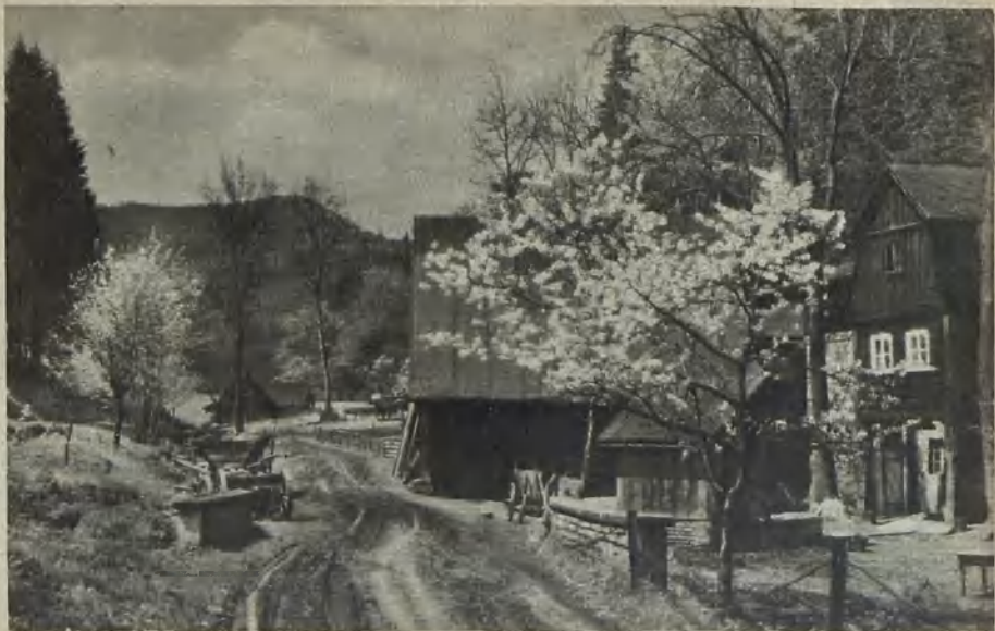
Frühling im Dreiwassertal Spring in the Dreiwassertal Vår i Dreiwasserdalen