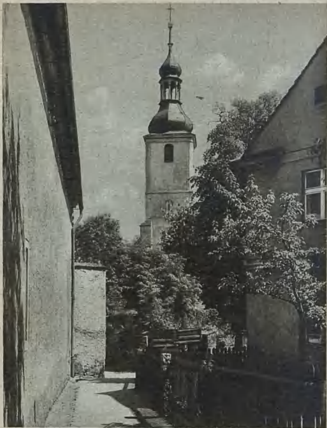
Freiburg i. Schles., an der katholischen Kirche Freiburg, Silesia, along the catholic church Freiburg i. Schles., vid katolska kyrkan