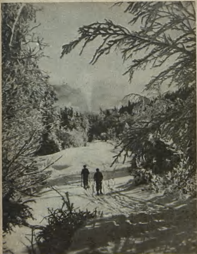
Aufstieg von Gottesberg zum Hochwald Ascent from Gottesberg to the High Forest På vägen från Gottesberg till storskogen