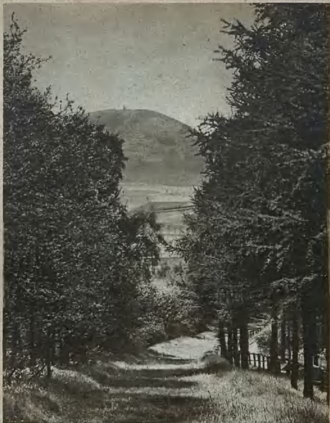
Waldenburg, Blick aus dem Stadtwald auf den Hochwald Waldenburg, view of the High Forest taken from the municipal forest Waldenburg, blick från stadsskogen över storskogen