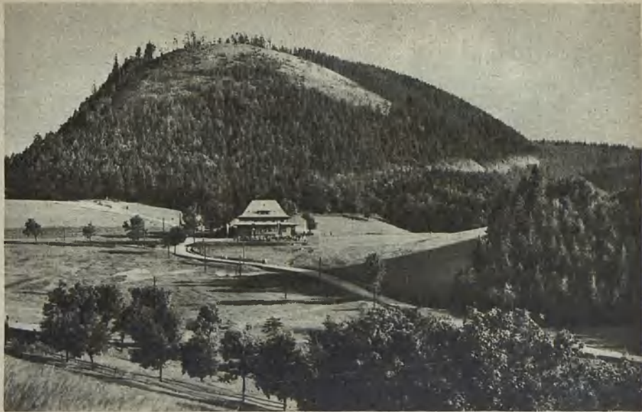
Blick auf die Andreasbaude (805 m)