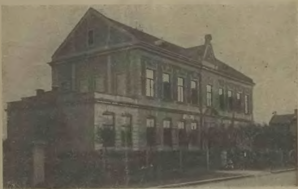
Budynek szkolny w Nowym Boguminie.