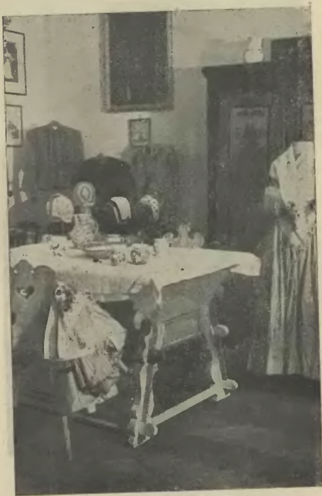
Ludowe meble śląskie i części stroju laskiego.

Muzeum Macierzy Szkolnej pomieszczone jest w gmachu Polonii. Zajmuje kilka pokoi, urządzonych na ten cel z ubikacją mie-