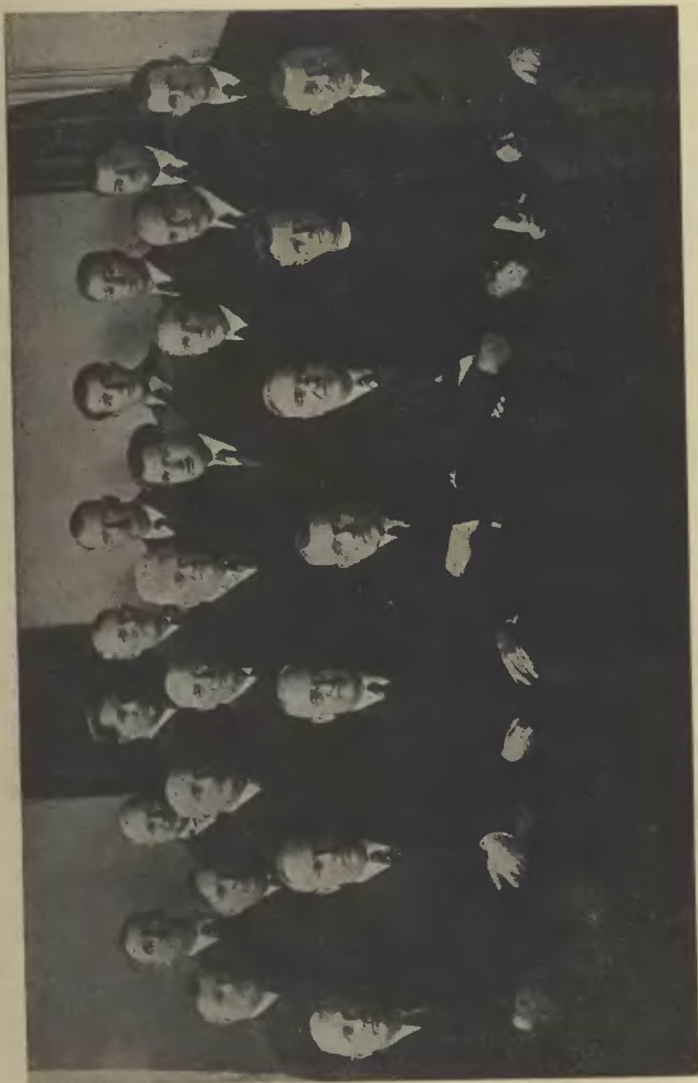
Członkowie Zarządu Głównego i Komisji Rewizyjnej w r. 1938.