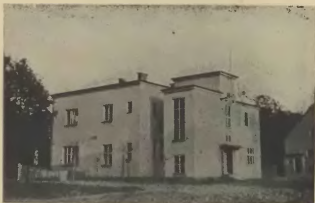
Pawilon restauracyjny w Parku Sikory.

3. Uroczystość otwarcia Pawilonu Restauracyjnego. Kiedy Towarzystwo Parkowe po latach walki z różnymi przeciwnościami uzyskało koncesję na prowadzenie restauracji, wyłoniło się nowe zagadnienie, stające się coraz bardziej palącym, mianowicie przebudowanie i powiększenie pawilonu dotychczasowego, który nie odpowiadał już nowym wymaganiom. Piętrzyły się jednak trudności, które przez szereg lat nie pozwalały na zrealizowanie tego projektu. Przewyciężono je w reszcie i dziś w Parku stoi piękny i obszerny pawilon restauracyjny, którego uroczyste otwarcie od-