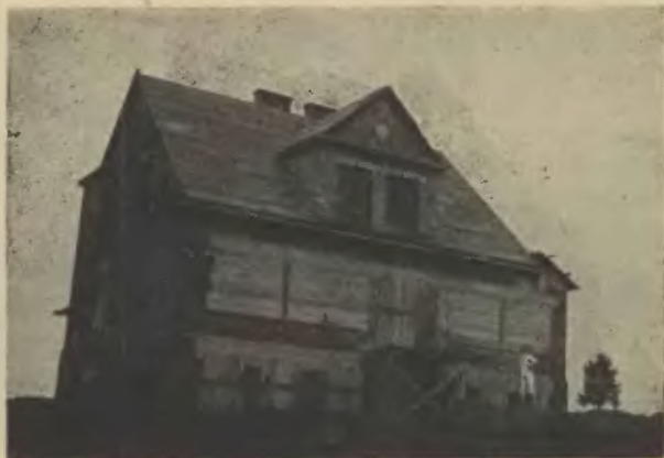
Niedokończony budynek szkolny w Mostach „na Szańcach”.