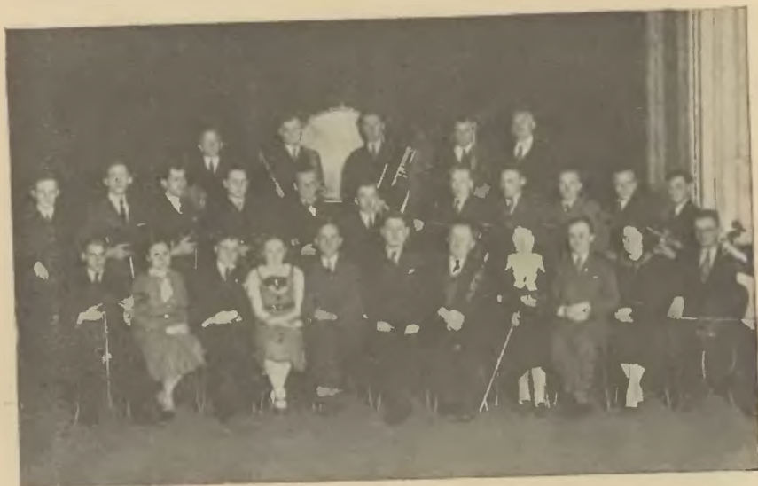
Orkiestra Macierzy Szkolnej przy Kole Macierzy Szkolnej w Cz. Cieszylinie. Jedyna tego rodzaju Sekcja Macierzy.

W porównaniu z r. 1934 wzrosła liczba Kółek z 16 na 20, liczba zebrań z 338 do 425, referatów z 279 do 380.