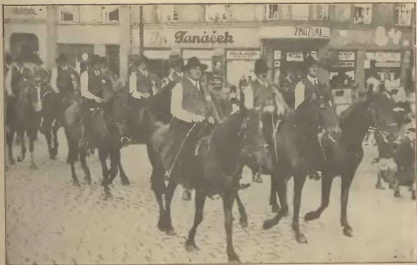
Fragment z Krajowego Festynu Macierzy Szkolnej: Banderja konna w pochodzie.

Liczby na tabeli statystycznej świadczą, że działalność ta była dobra. Urządzono cały szereg przedstawień szkolnych, poranków, wycieczek i innych imprez. Każda szkoła pamiętała o urządzeniu każdej ważniejszej rocznicy narodowej i państwowej. Wszystkie