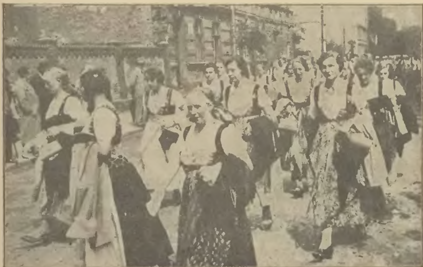
Fragment z Festynu Krajowego Macierzy Szkolnej Ślżaczki w stroju cieszyńskim w pochodzie.

Założona w roku szkolnym 1911-12 przez Koło Pań Towarzystwa Szkoły Ludowej w Krakowie, jako szkoła gosp. dom., przejęta na etat Macierzy Szkolnej w roku 1914, była czynna do 30 czerwca 1920 r. Zamknięta wskutek wypadków plebiscytowych, została otwarta dnia 16 grudnia 1927 jako pięciomiesięczna szkoła gospodarstwa domowego, dnia 1 września 1928 jako jednoroczna szkoła rodzinna; od 1 września 1929 obejmuje, prócz szkoły rodzinnej, pięciomiesięczne kursa gotowania i także kursa szycia.