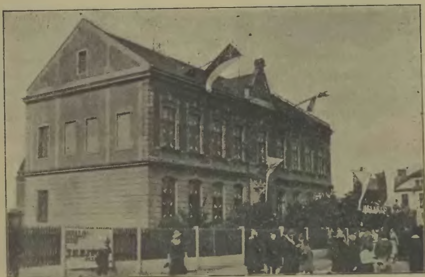
Polska szkoła ludowa w Nowym Boguminie, która 2 lata temu uroczystie obchodziła 30-lecie swego istnienia.