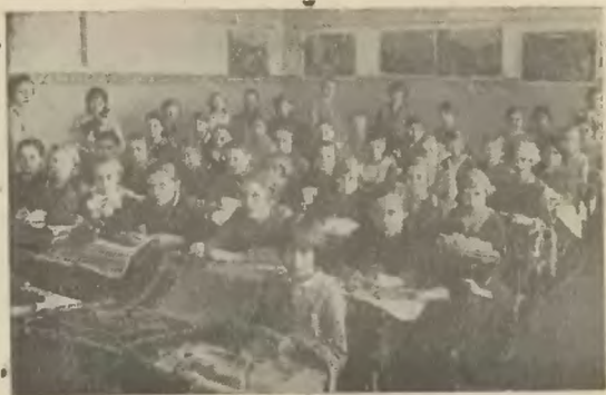
Nauka robót ręcznych w szkole wydziałowej.

W dniu 3 maja urządziła szkoła wieczorek szkolny. W skład programu weszły śpiewy, występy orkiestry i solowe, piasy i rewja K. Bergera: „Księżyc się gniewa“. W drugiej połowie maja urządzono trzydniową wycieczkę do Krakowa, w której wzięła udział działwa szkoły wydziałowej, zaś szkoła ludowa miała wycieczkę na Stożek. 8 czerwca urządzono w Parku Sikory festyn szkolny. Dzieci wystąpiły z ćwiczeniami masowymi i pojedynczymi. Festyn udał się tak pod względem moralnym jak i materjalnym.