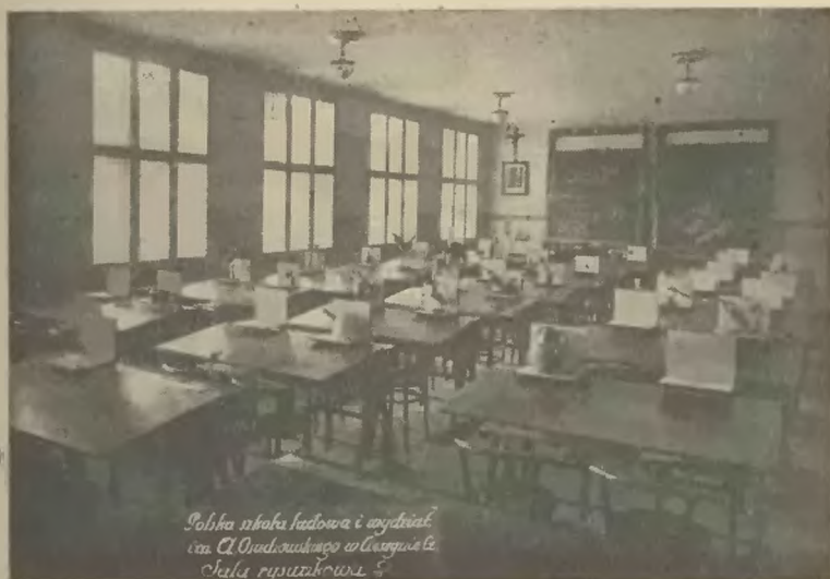
Sala rysunkowa w Szkole Macierzy Szkolnej (Cz. Cieszyn.).

2. Szkoła ludowa w Dzieńmorowicach , której kolaudacja odbyła się dnia 12 września 1931, rozpoczęła istnienie 14 września 1931.