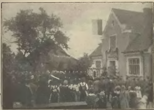
Otwarcie Domu Macierzy w Gródku.

Na uroczystości Mikołaja popisywały się dzieci śpiewem, deklamacjami, tańcami, za co je Mikołaj obdarował łakociami. Podobny popis odbył się podczas uroczystości gwiazdkowej i wtedy obdarzono dzieci ciepłą bielizną i odzieżą oraz łakociami i struclami. W przedstawieniu szkoły brały udział również dzieci