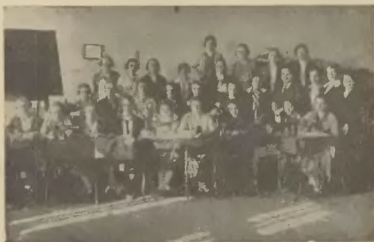
Kurs kroju i szycia (Piotrowice).

Jak i inne lata urządzono kilka pogadanek, na których wygłoszono odczyty na różne tematy. Prócz tego urządzono 3 wieczornice, 2 obchody narodowe i wieczorek pożegnalny dla abiturjentów. Program