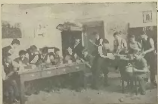
Roboty ręczne uczniów w szkole wydziałowej.