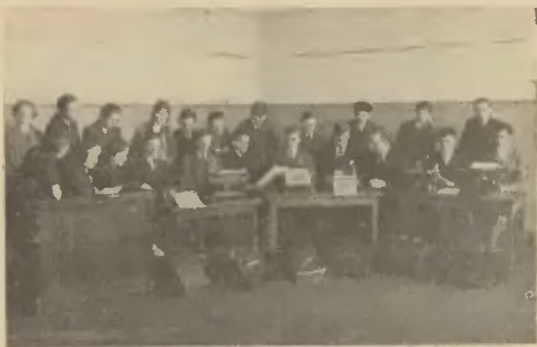
Kurs handlowy. (Nauka pisania na maszynach.)