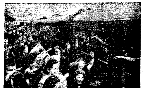
250 tys. dzieci wyjeżdża do tych dotychczas na wczasy i kolonie letnie. Na zdjęciu odjazd z Warszawy jednego z 250 specjalnych pociągów.

Załoga Zakładów Przemysłu Ociekacza, w której wykonano plan miesięczny na 1 i półtora, już 5 km. zobowiązania się wykonują plan produkcyjny za lipiec 21 lipca. Poszczególne zespoły wykonują: