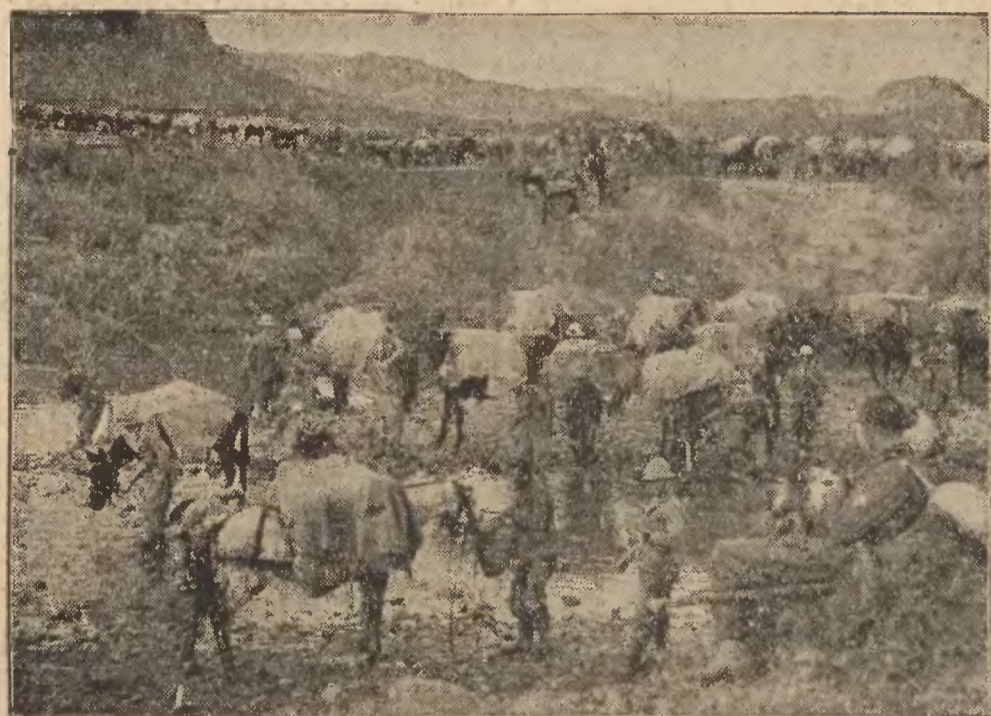
Włoska kolumna amunicyjna przy wodopoju w okolicach Makalle.

Londyn, 8. 12. Tel. wł. O położeniu na froncie południowym w Abisynji donoszą źródła angielskie, że wojska włoskie utworzyły tam cały szereg placówek, otoczonych drutem kolczastym i uzbrojonych w karabiny maszynowe. Z placówek tych wyszły od czasu do czasu paucle, które po dokonaniu rekonesansu wracają na stanowisko. Stąd powstają pogłoski o nagłych posuwaniach się wojsk włoskich naprzód i o cofaniu się ich. Nietyle opór zbrojny Abisyńczyków, ile błota, tamują dalszy marsz włoską naprzód.