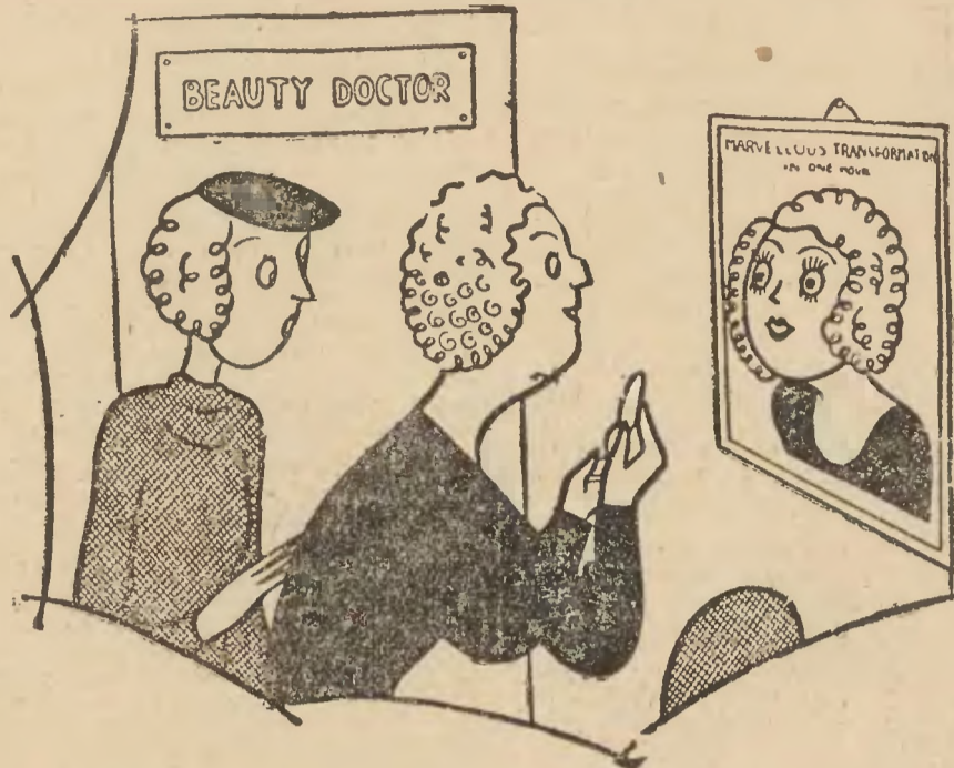
— Ależ, mamusiu, to nie lustro!