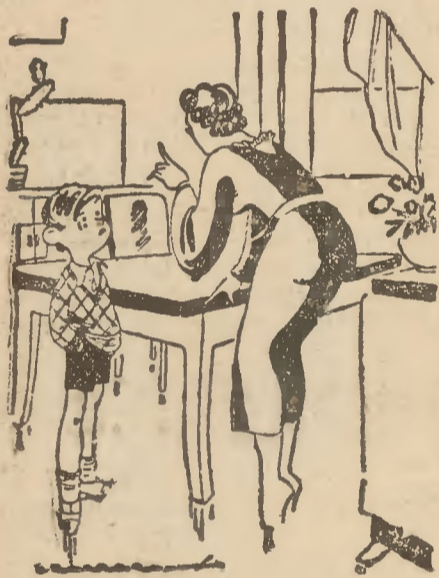
— Jeżeli jeszcze raz powiesz „pieroną” nie dostaniesz kolacji.