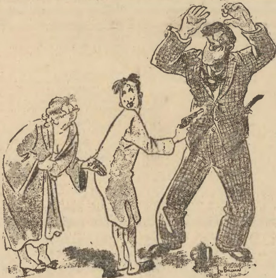
— Nie potrzebujesz tych kul?