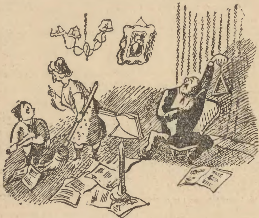
— Cicho! Tatuś studjuje „Piątą symfonię” Beethovena.