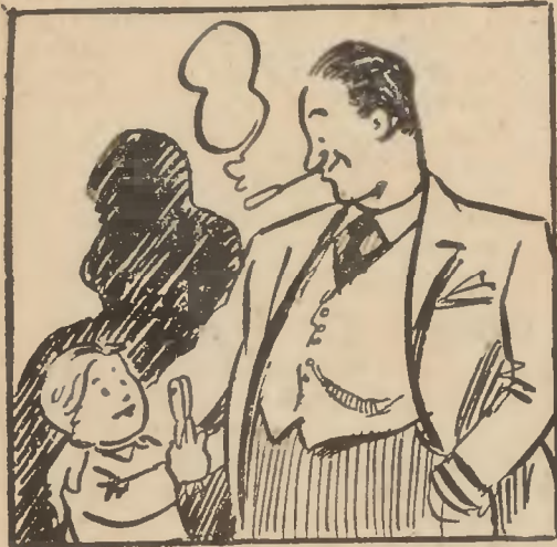
Dziękuję bardzo, wujczkowi.

Oprócz biletów w pudełku znajdował się prawdziwy gwizdek na czerwonym sznurku i... dziurkacz!!