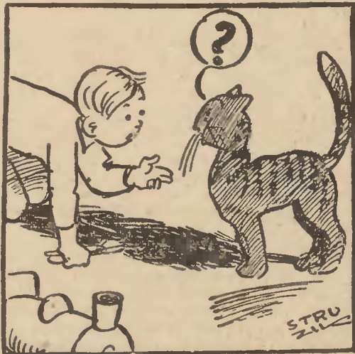
Dokąd pan chce jechać?

Romek miał już pociąg z wagonami i lokomotywą. Ustawił więc pociąg na podłodze. Do wagonów powсадzał słonia, psa i Misia i gwizdnął w swój nowy gwizdek.