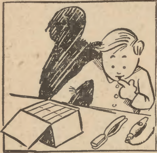
Dostał od wujka śliczną zabawkę.

W dużym czerwonym pudełku było moc biletów kolejowych. Wyglądały jak prawdziwe, na każdym z nich by-