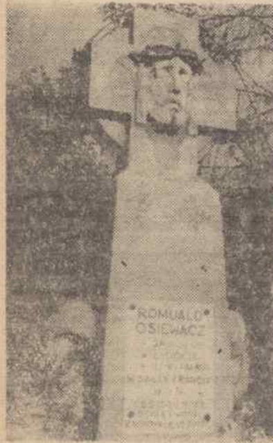
Ten pomnik, to jedyne dzieło jakie pozostało po artyście w Ligocie.

Twórczość rzeźbiarska Trieblera jest bogata. Artysta ma w dorobku swym szereg doskonałych portretów we wszystkich rodzajach tworzywa: gips, brąz, glina, polandmarmur prawdziwy i sztuczny. Rzeźbi kompozycje figuralne, pomniki monumentalne, na-