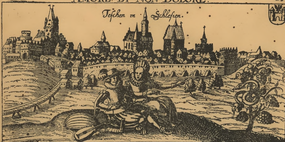
Tefchen in Schlesien.