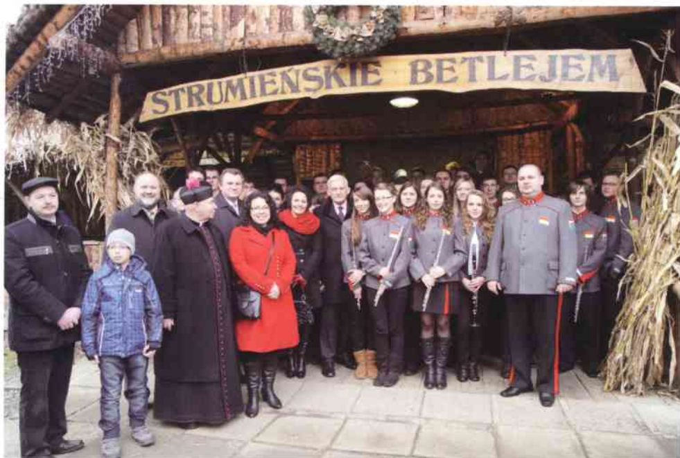
Strumień - pamiątkowe zdjęcie z Premierem Jerzym Buzkiem