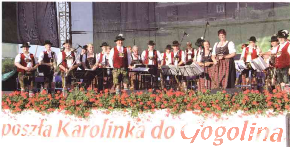
Stadtkapelle Schongau kilkakrotnie występowała w gminie Gogolin