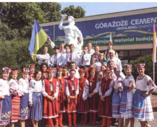
Przy Karolinie chętnie fotografowali się goście z miast partnerskich