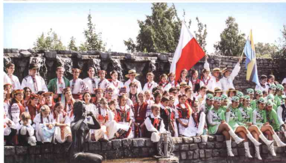
Karolinka łączy nas wszystkich