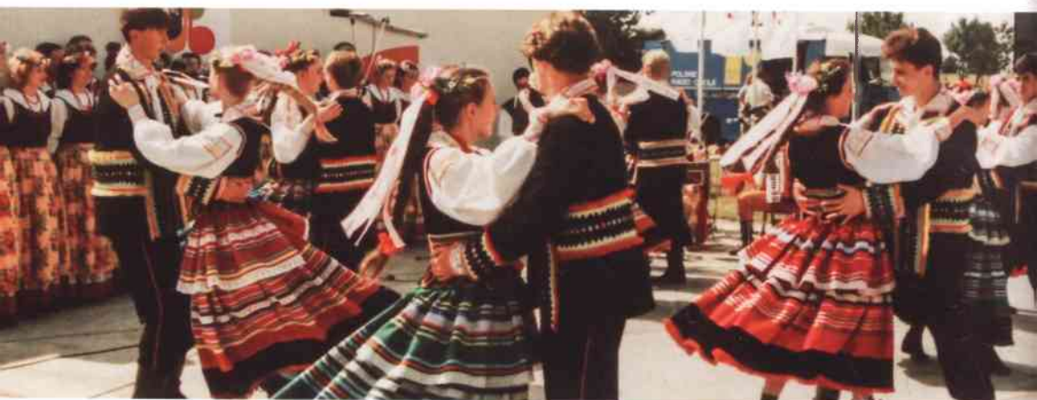
Tańczące zespoły na deskach amfiteatru