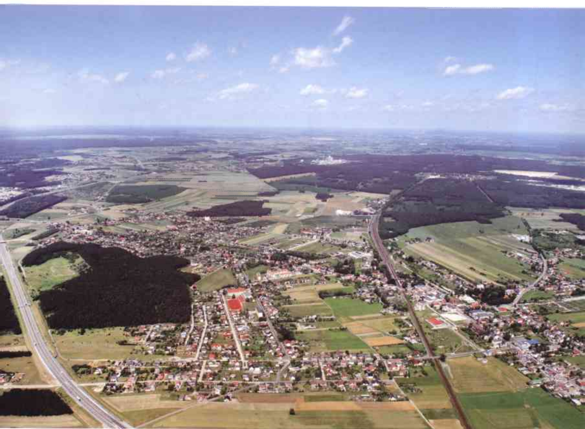
Panorama Gogolina z lotu ptaka