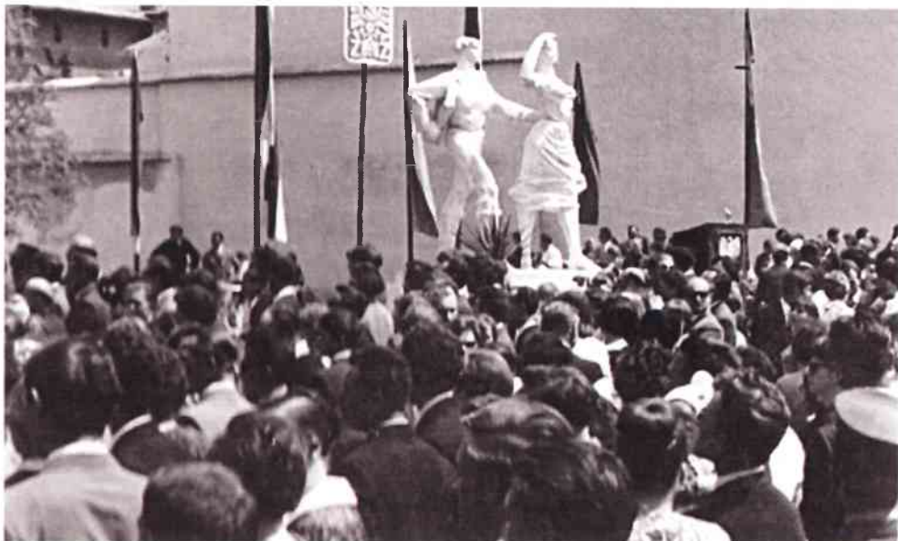
Uroczystość z okazji odsłonięcia pomnika - 28.05.1967 r.