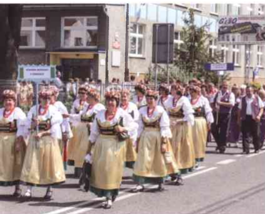
Opolskie Święto to także prezentacja pięknych strojów