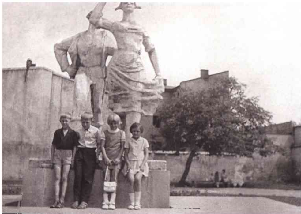
Pamiętkowe zdjęcie przy pomniku

Cieszy jednak to, że po przemianach społeczno-politycznych pomnik doskonale się „obronił”. W zapomnienie poszła ideologiczna strona przedsięwzięcia, pozostało sympatyczne przesłanie o wesołej Karolinie i Karliczku, który przywodzi na myśl dziarskiego śląskiego młodzieńca.