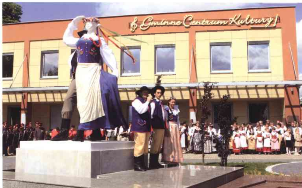
Inauguracja Opolskiego Święta Pieśni Ludowej w 2013 r.

Na budynku Gminnego Centrum Kultury znajduje się tablica z umieszczoną na niej sentencją „Uczmy się kultury krainy serca myślącego i rozumu kochającego”. Zostały tu zacytowane słowa księdza arcybiskupa Alfonsa Nossola nawiązujące do twórczości śląskich poetów Andreasa Gryphiusa i Josepha von Eichendorffa. Jak pisze we wstępie do wierszy Eichendorffa Ksiądz Arcybiskup: „Serce i myśl, gdy ze sobą harmonijnie współgrają, są w stanie cudownie łączyć i scalać, przyjaźnie jednoczyć i otwierać na człowieczy uniwersalizm oraz świadomość nowej jedności, której Europa dzisiaj tak bardzo potrzebuje” 2 .