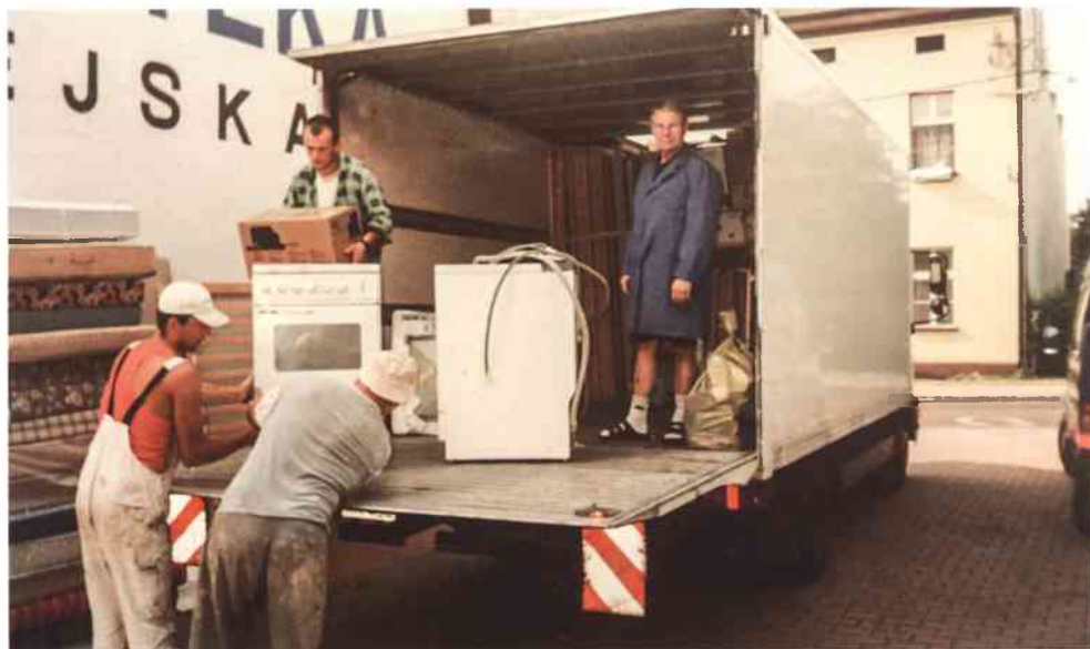
Po wielkiej powodzi Gmina Gogolin otrzymała dużą pomoc z Schongau

pracownicy Urzędu Miejskiego. Podczas sesji uczestniczący w niej burmistrzowie jasno wyrazili wolę podtrzymywania kontaktów partnerskich i dalszej współpracy.