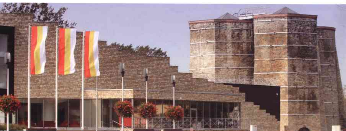
Hotel Vertigo na tle pieców wapienniczych