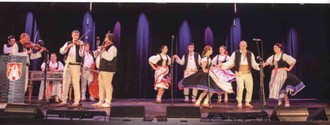
Na gogolińskiej scenie często gościli kapele góralskie