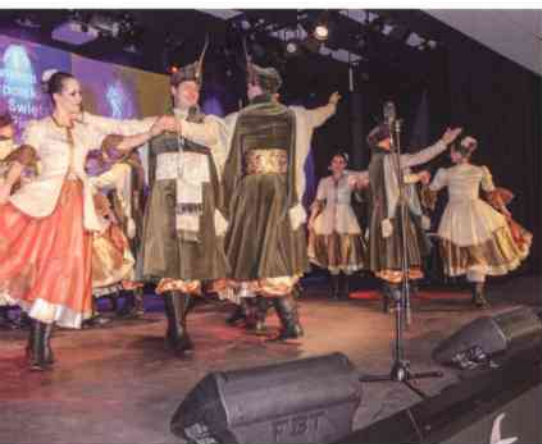
Na scenie gościły zespoły z różnych regionów Polski