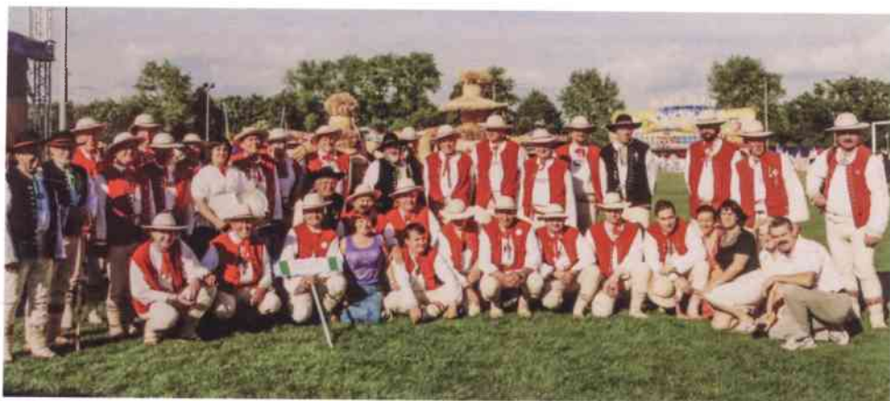
Chór Męski Gorol z Jablunkova podczas Opolskiego Święta Pieśni Ludowej

Nawiązane kontakty przyniosły znakomite i długofalowe efekty. Współpraca samorządowa obejmuje dziś współdziałanie strażaków, środowisk oświatowych i szeroką współpracę w zakresie kultury. Szczególne miejsce zajmuje działalność związana z realizacją projektów transgranicznych, inicjowanych przez obie strony. Warto podkreślić, iż z inicjatywy Gminy Gogolin zrealizowano ponad dwadzieścia wspólnych przedsięwzięć. Zawiązana w 1998 r. współpraca z samorządem Jablunkova stała się punktem wyjścia i okazją do poszerzenia partnerskiej kooperacji. Od dekady Gmina Gogolin intensywnie współpracuje również z Gminą Písek, a dzięki pośrednictwu władz samorządowych Gminy Gogolin, w 2013 r. podpisano umowę o partnerskiej współpracy między samorządem Jablunkova i Kysuckého Nového Mesta, miastami które są partnerami Gminy Gogolin.