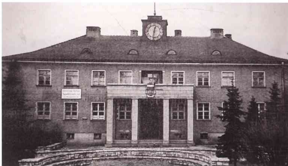
Gogoliński ratusz w latach 70. XX w.

W roku 1989 rozpoczął się proces gruntownej przebudowy państwa polskiego. Wydano wówczas wiążącą dla administracji terenowej Ustawę o samorządzie terytorialnym. Na mocy Rozporządzenia Rady Ministrów z dnia 28 grudnia 1990 r. połączono niektóre miasta i gminy, w których działały wspólne organy. W tej grupie znalazł się Gogolin.