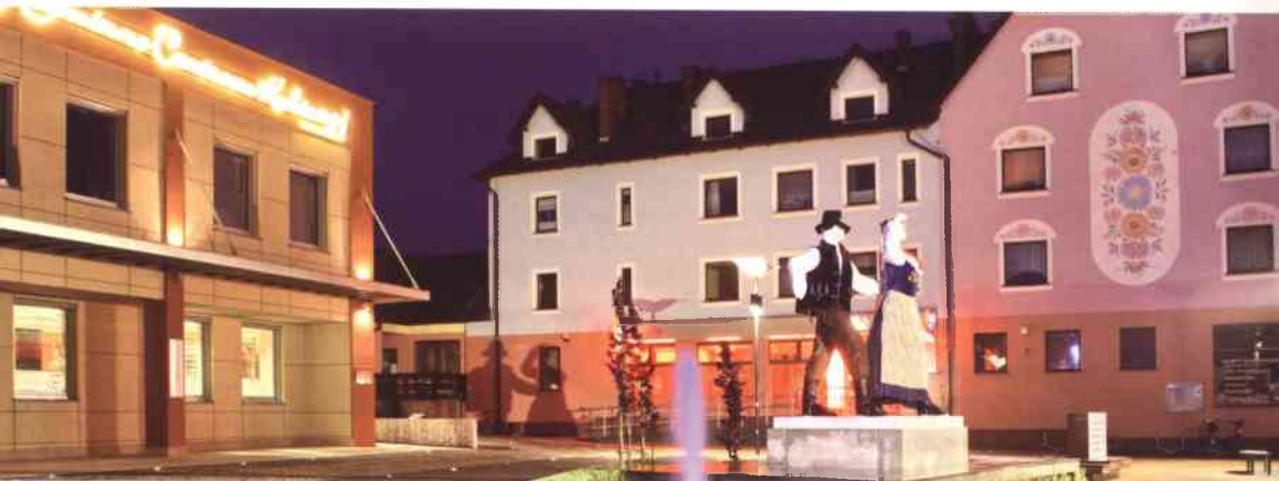
Malownicze otoczenie pomnika Karolinki i Karliczka