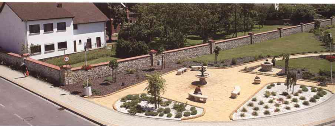
Skwer przy Alei św. Urbana