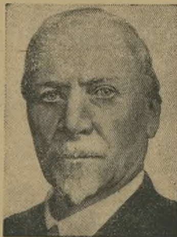
Büroführer General Smuts in Berlin.

erstrahlte das Ganze im Licht stärkster elektrischer Beleuchtung, die Marconi von Rom aus durch Herz-Wellen einschaltete.