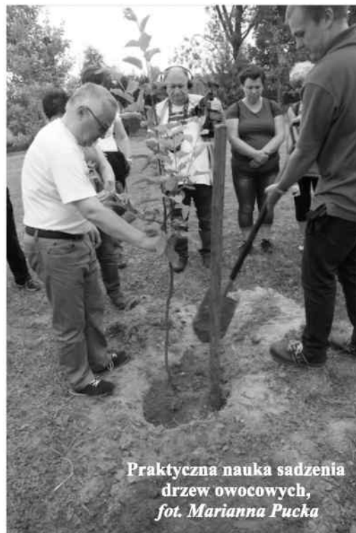
Praktyczna nauka sadzenia drzew owocowych

Urząd Gminy Rudniki przewiduje wstępnie założenie modelowego sadu rodzimych odmian drzew owocowych na terenie Żytniowa.