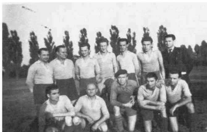
Przedwojenny Huragan z Rudnik