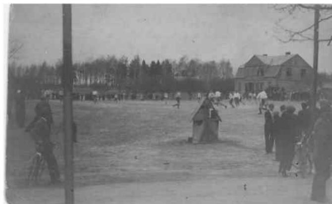
Rok 1927. Mecz w parku z " Macabi Krzepice ". W głębi za drzewami cmentarz.

Trzeba tu wspomnieć, iż od początku istnienia LZS-u do lat 60-tych, ze względu na brak środków zawodnicy na mecze dojeżdżali rowerami. W latach 60-70 - środkami transportu były ciągniki z przyczepami. Wkładano na nie ławki z parku, przyozdabiano brzoškami i tak z powszechną radością udawano się na mecze.