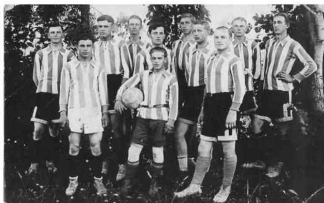
LZS Huragan w pełnej krasie w roku 1928

Rozgrywki odbyły się w Praszce w miejscu obecnego Liceum i zostały nazwane POLSKA - NIEMCY. Ta lokalizacja nie była przypadkowa, gdyż Polskie i Niemieckie władze wyraziły zgodę na rozegranie tych meczy w maksymalnej odległości 1 km od granicy.