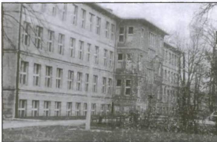
Budynek Zespołu Szkół Chemicznych