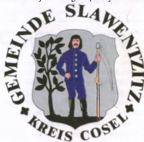
Herb gminy Sławięcice z XIX wieku