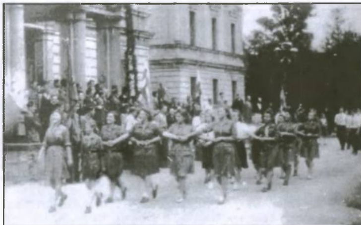
Rok 1947. Manifestacja 1-Majowa przed zamkiem

Warsztaty zostały w 1989 r. przekazane w dzierżawę Wojewódzkiemu Zakładowi Doskonalenia Zawodowego. Jednak po kilku latach WZDZ zrezygnował z dzierżawy i aktualnie war-