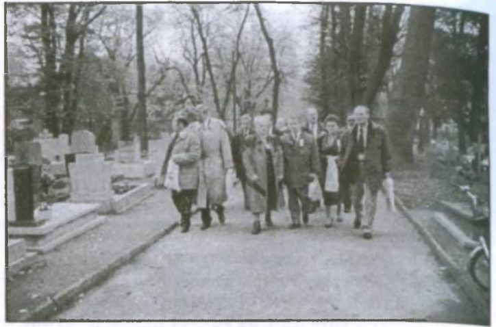
Absolwenci ZSZCH na cmentarzu