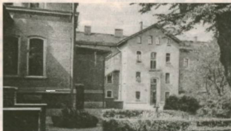
Przedwojenny widok Szpitala w Sławięcicach