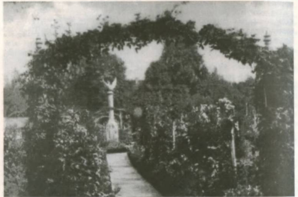
Na zdjęciu: Ogród róż - Rosengarten